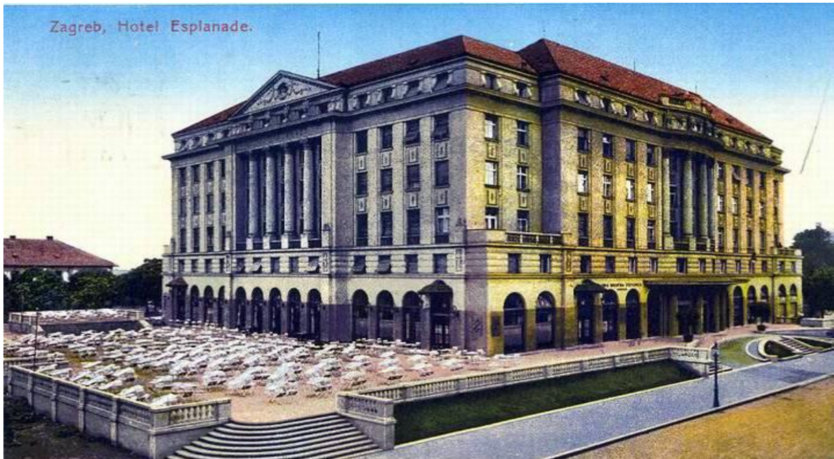
Slika 6: Hotel Esplanade na svojim počecima

izbor za miss, a missica koja je pobijedila, djevojka Štefica Vidačić, sljedeće je godine u Berlinu pobijedila i dobila titulu miss Europe.