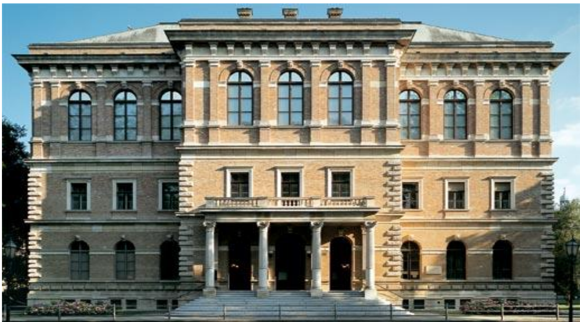
Slika 4. Palača Hazu

Palača Hazu ili palača akademije je najveća znanstvena i umjetnička ustanova te se nalazi u neorenesansnoj palači koja se sagradila samo za tu namjenu 1880. godine. Jedina je to prava palača u Zagrebu. (Vitković, 2011: 2) Najposebnija je po tome što se u njenom atriju čuva Bašćanska ploča koja je jedan od najstarijih zapisa na hrvatskom jeziku pisan glagoljicom. U njoj je nalaze još neka mnoga poznata umjetnička dijela čime čuva dugu hrvatsku povijest i tradiciju.