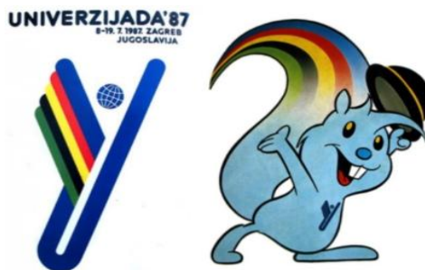
Slika 8. Logotip i maskota Univerzijade Zagi

Univerzijada je imala veliki značaj radi bogatog sportskog programa, ali bitne stavke bile su organizacija i pripreme. Gradili su se mnogi objekti: Rekreativno sportski centar Jarun, Plivački i vaterpolo centar ASD mladost, Rekreativno sportski centar Šalata, stadion Dinamo i Dom sportova. Radi bolje infrastrukture izgradio se autobusni kolodvor, dok je željeznički kolodvor bio obnovljen. Unatoč krizi i inflaciji, Zagreb i njegova okolica doživjeli su „infrastrukturnu renesansu“. Realizirali su se poslovi na raznim područjima djelatnosti: sport, organizacija izgradnje, financije, marketing, organizacije boravka, informiranja i propagande, tiska i izdavaštva, kulture i zabave, općih poslova, elektroničke tehnologije itd. (Zekić, 2007: 3) Veliki značaj dobio je i kulturni program kao promidžba organizatora. Značajan dio vezan za kulturu bilo je otvaranje velikog broja muzeja i galerija s mnogo različitih izložbi u tijeku trajanja Univerzijade. Teme nisu isključivo bile sportske već se prezentirala nacionalna baština i tradicija što je privuklo velik broj domaćih i stranih posjetitelja.