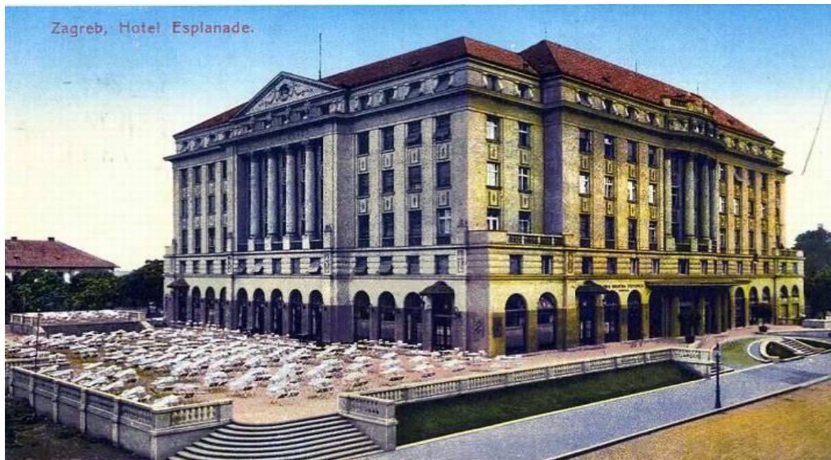
Slika 6: Hotel Esplanade na svojim počecima

izbor za miss, a missica koja je pobijedila, djevojka Štefica Vidačić, sljedeće je godine u Berlinu pobijedila i dobila titulu miss Europe.