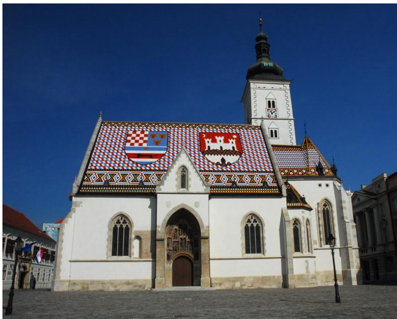
Slika 3. Crkva sv.Marka

Crkva sv. Marka izgrađena je u 13. stoljeću, a iz te prve faze izgradnje crkve koja je bila romaničkog stila sačuvani su samo prozor u južnom zidu i baza zvonika. Gotički svodovi i svetište građeni su u drugoj polovici 14. stoljeća kada je crkva dobila i svoj najznamenitiji dio a to je gotički južni portal. „Taj „najbogatiji“ gotički portal u izrađen je u Parlerovoj radionici, jednoj od najpoznatijih srednjovjekovnih kiparskih radionica.“ (Balog, 2007: 3) Na zapadnom zidu crkve nalazi se najstariji zagrebački grb koji datira iz 1499. godine. Crkva je kompletno obnovljena u drugoj polovici 19. stoljeća prema nacrtima bečkih arhitekata Friedricha Schmidta i Hermanna Bollea te ponovo rekonstruirana u prvoj polovici 20. stoljeća. Na oltare su postavljena djela znamenitog kipara Ivana Meštrovića. Crkva sv. Marka jedna je od najstarijih građevina u Zagrebu i jedna od poznatijih zagrebačkih simbola. (www.infozagreb.hr, 2017.)