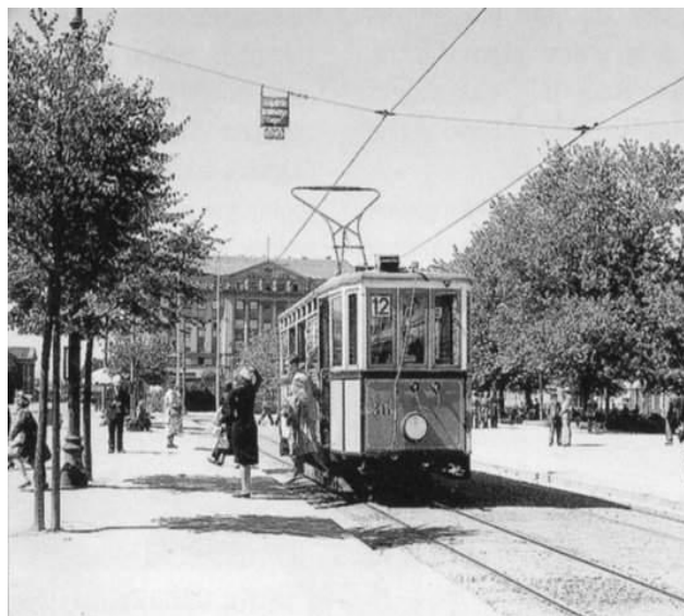
Slika 5. Prvi električni tramvaj

„Zagreb nema prijestolnički duh Beča, ni prenaplašenu raskoš Pešte, niti neusporedivu draž Praga, ali je svojim sukladnim smještajem, slikovitošću svojih ambijenata, živošću i ljepotom svojih ulica, trgova, parkova i spomenika istinski oblikovan po mjeri čovjeka.“ (Travirka, 2009:5)