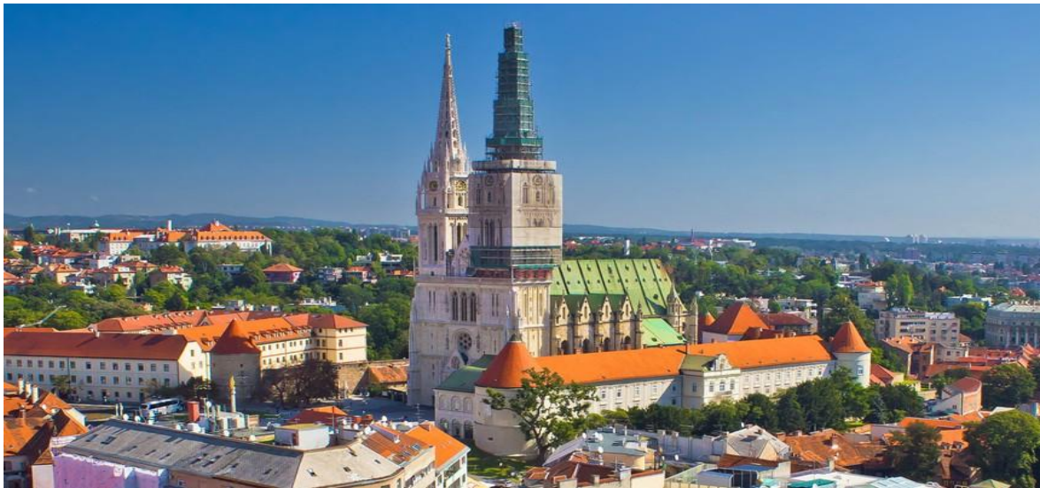
Slika 2. Zagrebačka katedrala

U nastojanju da se katedrali vrati prvotni izgled, u Zagreb je pozvan bečki profesor arhitekture Friedrich Schmidt koji je u Zagreb doveo svog učenika Hermanna Bollea. Međutim, katastrofalni potres 1880. godine teško je oštetio katedralu pa je prema Bolleovim nacrtima katedrala ne samo rekonstruirana, već je u unutarnjem uređenju dobila obilježja neogotike. (Deanović, Čorak, 1988: 279) To je posebno došlo do izražaja oblikom pročelja i dvaju neogotičkih zvonika čime je 1902. definiran sadašnji izgled katedrale.