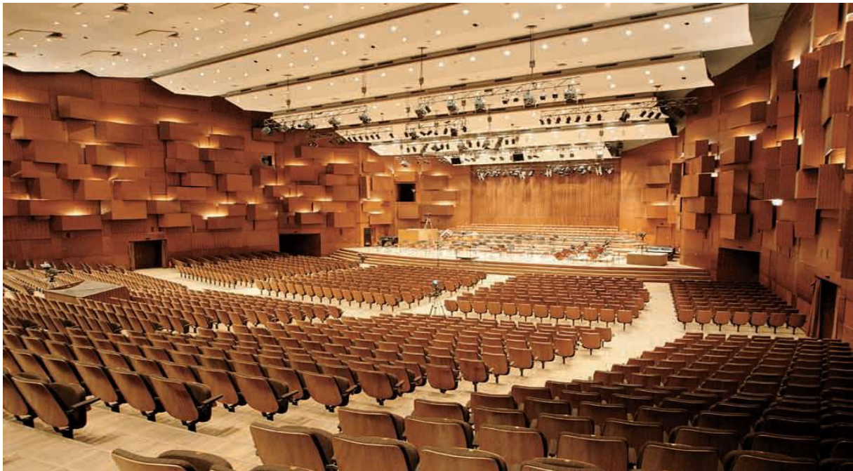
Slika 7. Koncertna dvorana Vatroslava Lisinskog

svake godine slavi kao Dan dvorane i tom prigodom u Zagreb dolazi velik broj posjetitelja. (Vukonić, 1994: 178-185)