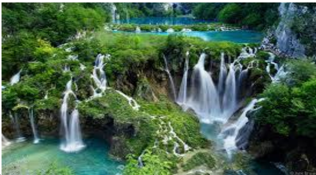
Slika 1. Slapovi na plitvičkim jezerima