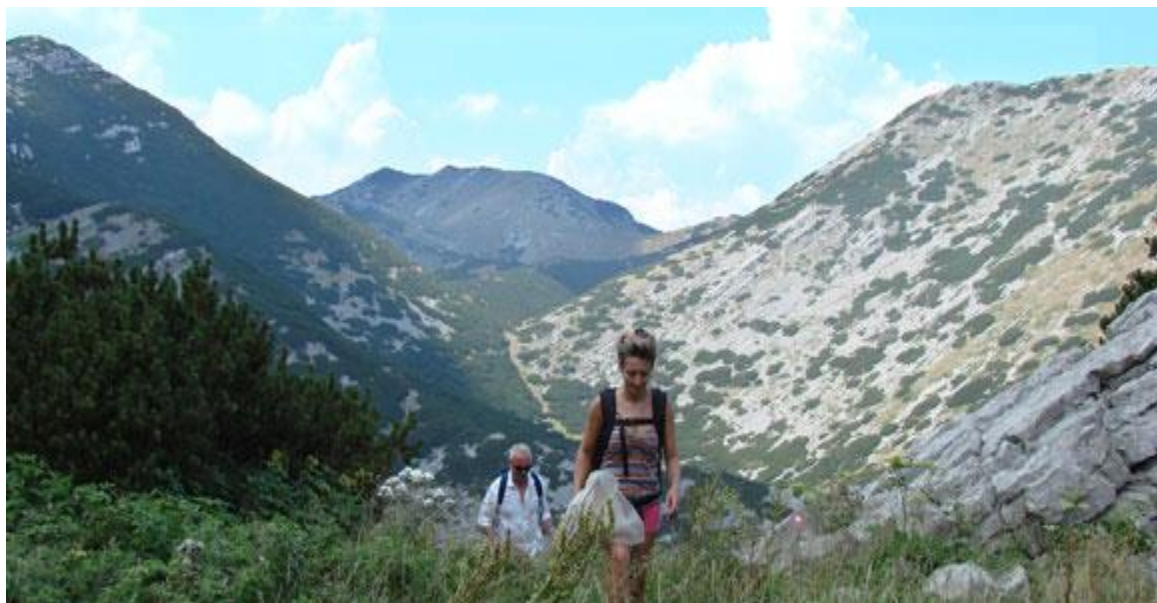
Slika 8. Pješačke staze na Paklenici