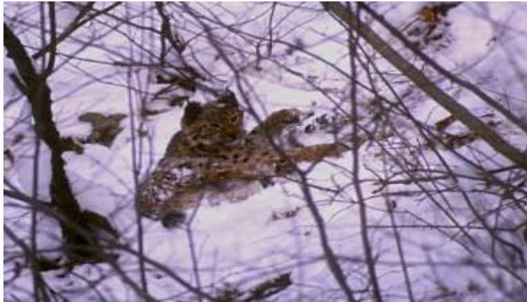
Slika 6. Ris, jedna od tri zvijeri na Risnjaku