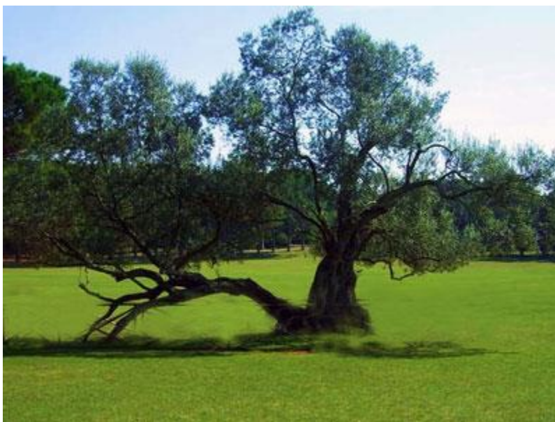
Slika 2. Maslina na Brijunima