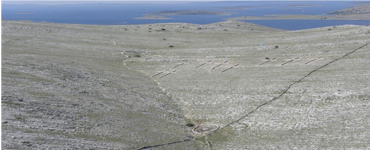
Slika 3. Kameni križevi na Kornatima