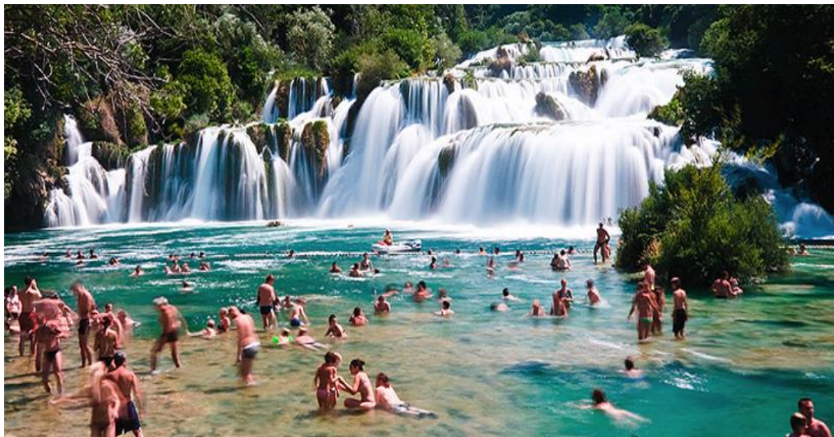
Slika 4. Kupači na rijeci Krki