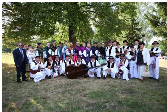
Slika 1. HKUD „Slavonija“ Jakšić.