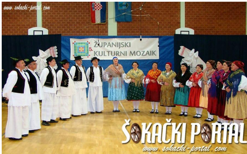
Slika 19: KUD „Požeška dolina“.