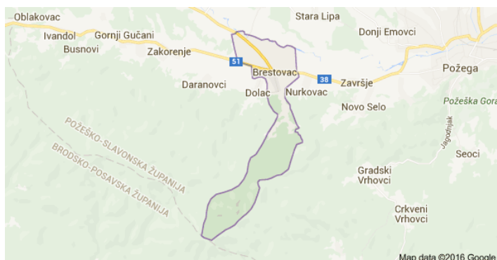
Slika 16: Općina Brestovac