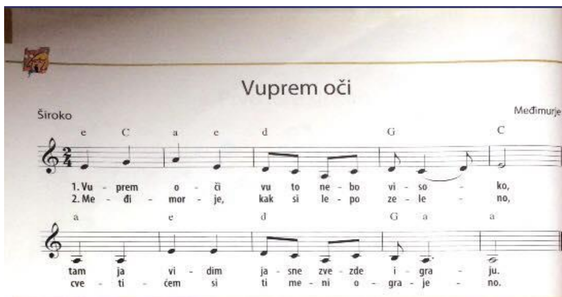
Slika 11(Sikirica, Marić, 2013:12)

Iz udžbenika Glazbena šestica izdvojio sam narodni napjev Vuprem oči . Tradicijska narodna glazba Međimurja vrlo je specifična. Melodijske linije su velikog opsega, ritam je slobodniji, što melodiji omogućava da „teče bez zastoja“. Napjevi ovoga kraja vrlo su specifični po svom modalnom prizvuku (dorski i eolski modus). Međimurske su pjesme također često i u molu, te se u njima razaznaju i elementi pentatonike, što daje sjetan, smiren i pomalo tužan ugođaj. 6