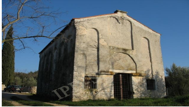
Slika 11. Crkva sv. Kristofora