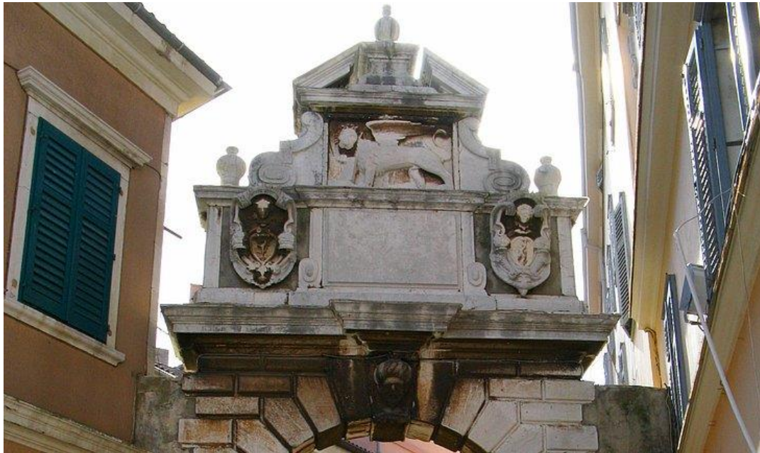
Slika 2. Balbijev luk

1678.ta su vrata srušena i podignut je novi objekt, kasnije prozvan Balbijev luk, u čast tadašnjem načelniku.