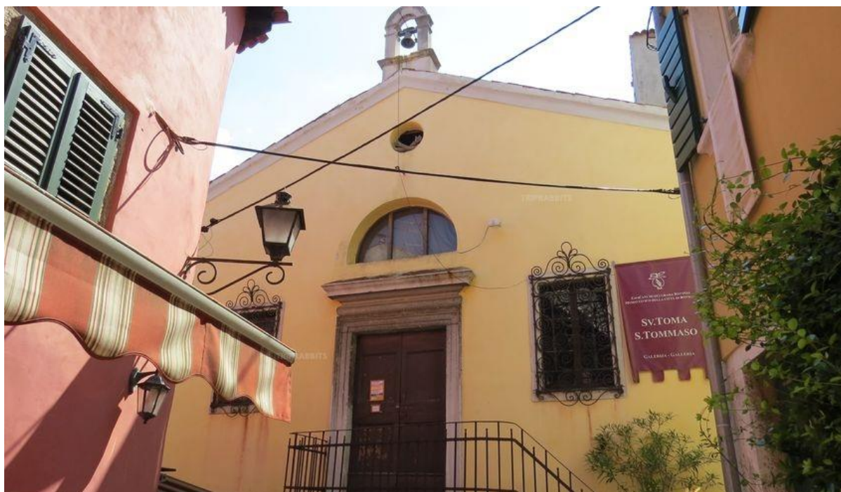
Slika 8. Crkva svetog Tome Apostola