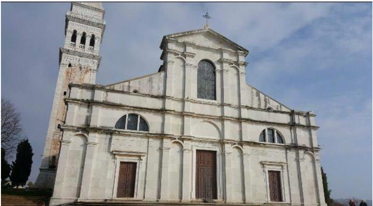
Slika 4. Crkva Sv. Eufemije u Rovinju

Oko 950. godine bila je nova bazilika dovršena. To je bila trosobna bazilika s tri polukružne izbočene apside. Na sredini je postavljen sarkofag tijelom Sv. Eufemije koja je postala sa Sv. Jurjem zaštitnica grada i župe. Crkva je imala tri glavna oltara i bila je dovoljno velika za skupine hodočasnika, koji su povremeno dolazili u Rovinj. 22