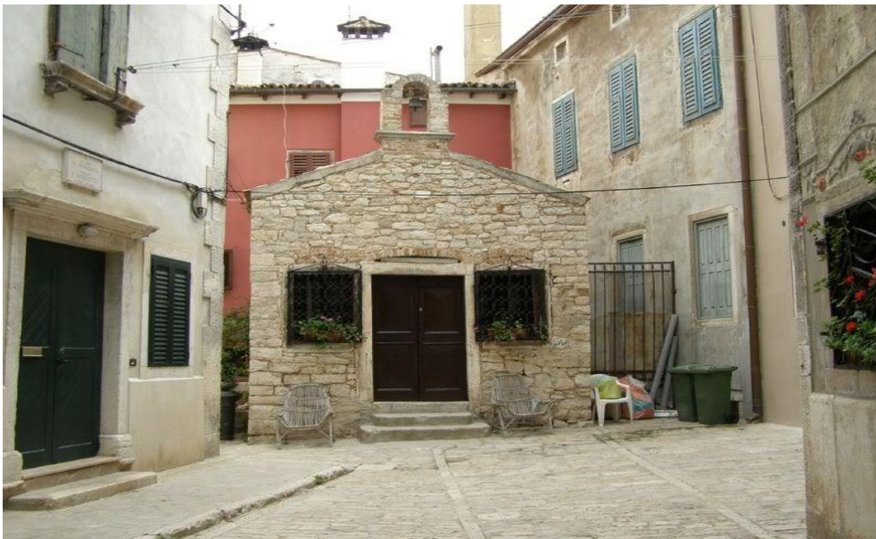
Slika 7. Crkva sv. Benedikta

Izgrađena je u 14. stoljeću i nalazi se na malom trgu, okružena visokim kućama. To je Trg i Ulica pod lukovima, a odmah su u blizini i Vrata sv. Benedikta, sada Vrata na obali. Crkva je građena u 14. stoljeća i ovamo su dolazili serviti iz samostana na otoku sv. Katarine. Bogoslužje se služi jednom godišnje, na blagdan sv. Benedikta, kada je izložena javnosti jednom godišnje.