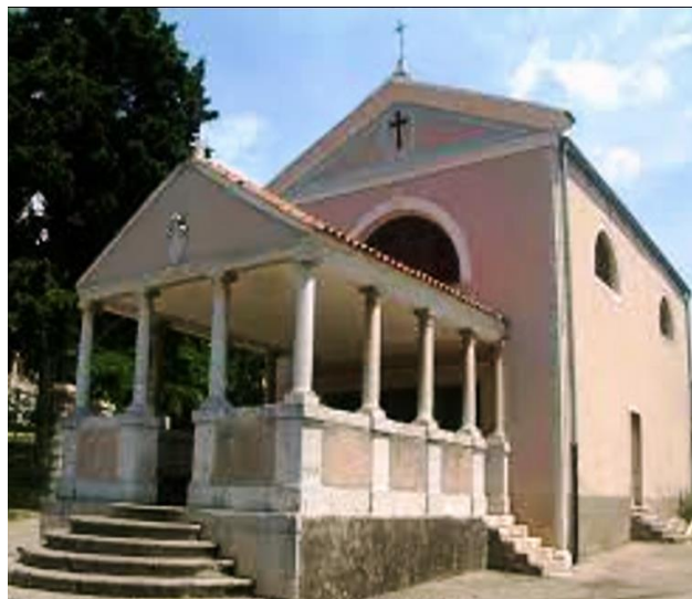
Slika 9. Crkva Majke Božje od Milosti

Nalazi se u Carduccijevoj ulici. Datum izgradnje i posvete crkve nisu poznati, ali poznati su natpisi iz kojih saznajemo da je 1584. preuređena. Crkva je nekad bila izvan gradskih zidina, ali se grad postupno proširio pa se danas nalazi unutar grada. 16 God. 1762. u crkvi je pokopana Elisabetta Angelini-Califfi, poznata kao Majka Siromašnih. Crkva je obogaćena izrezbarenim klupama i zavjetnim darovima koji su obješeni na njezinim unutarnjim zidovima.