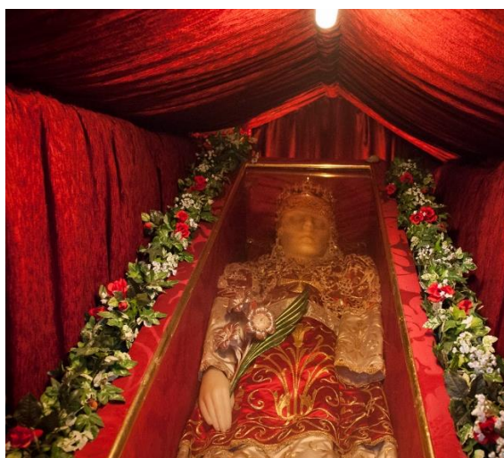
Slika 5. Sarkofag s relikvijom svetice Eufemije

Lavovi su je usmrtili, ali joj tijelo nisu okusili. Bilo je to 16. rujna 304. godine poslije Krista. Tijelo mučenice sačuvali su kršćani. Ono je oko tri stoljeća počivalo u kalcedonskoj crkvi, a zatim kad su Perzijanci 620. godine opsjedali Kalcedon u mramornom je sarkofagu prevezena u Carigrad i smještena u velebnu crkvu koju je u njezinu čast bio podigao još car Konstantin. Tu je ostala do 800. godine, kada je, kako kaže prastara predaja, jedne olujne noći sarkofag sa svetičinim tijelom nestao iz Carigrada.