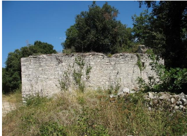
Slika 10. Crkva sv. Damjana

Nalazi se između močvare Palud irta Sv. Damjana. Crkva je u većoj mjeri devastirana tako da ona danas izgleda kao zgrada pačetvorinastog tlocrta bez krova i pročelja. Prema stilskim obilježjima, nastanak ove crkve možemo smjestiti između XI.-XII. stoljeća, dakle u doba romanike.