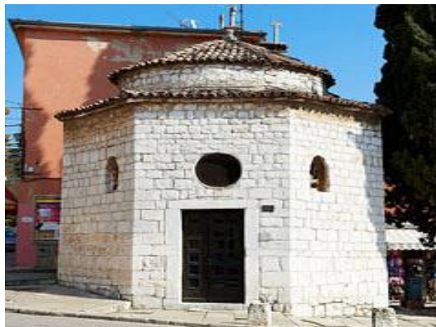
Slika 6. Romanička crkva Presvetog Trojstva

Najvažnija i najbolje sačuvana romanička građevina u Rovinju. Dostojanstvena u svojoj jednostavnosti najstarija je građevina u Rovinju iz 13. stoljeća.