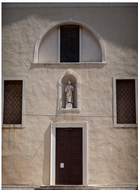
Slika 12. Franjevački samostan i crkva sv. Franje Asiškog