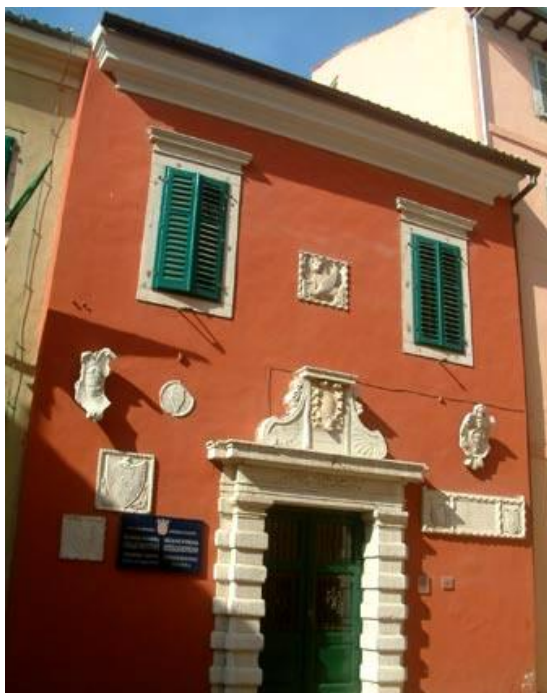
Slika 3. Gradska palača

U dijelu prizemlja nalazio se čak i zatvor, dok je na katu bila velika sala Gradskog vijeća, uredi te arhiv. Pročelje i atrij su obnovljeni između 1850. i 1860. te 1935., kad je postavljeno niz grbova venecijanskih i rovinjskih obitelji te gradski grb. 21