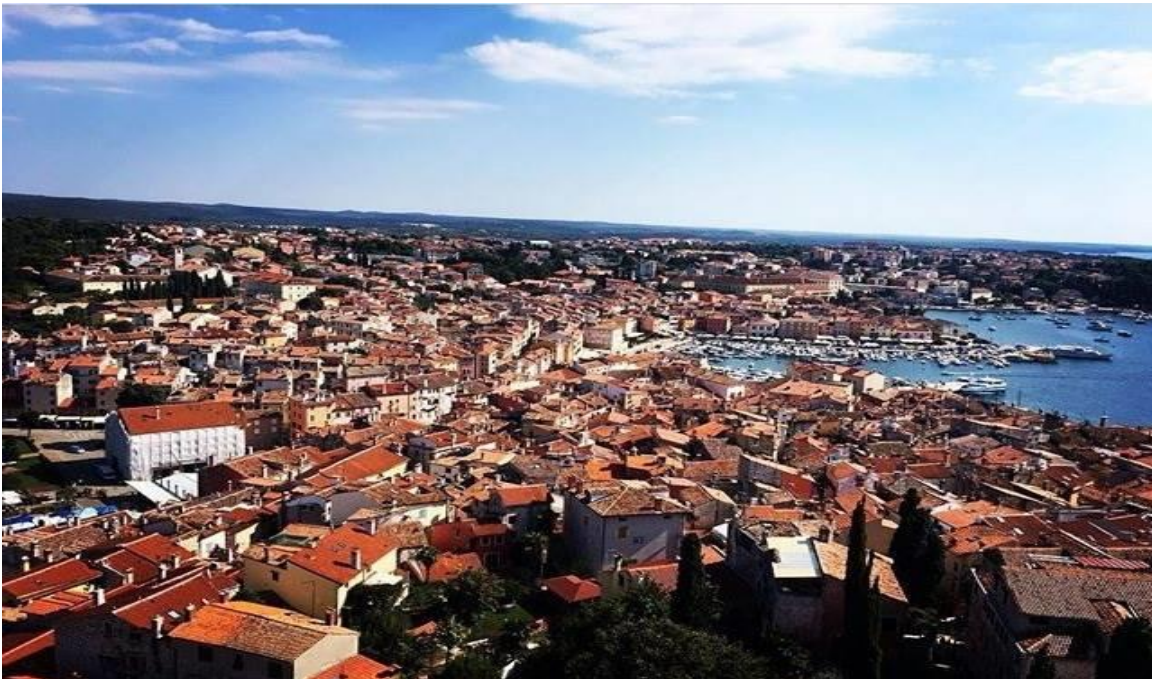
Slika 1. Pogled na Rovinj sa zvonika crkve sv. Eufemije

Stari je grad ponešto odvojen od novijih četvrti te ga to čini autentičnim. Na kopnu