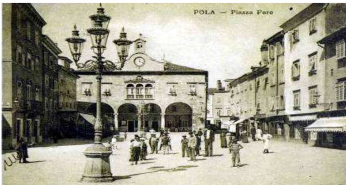
Slika 4. Puljski forum