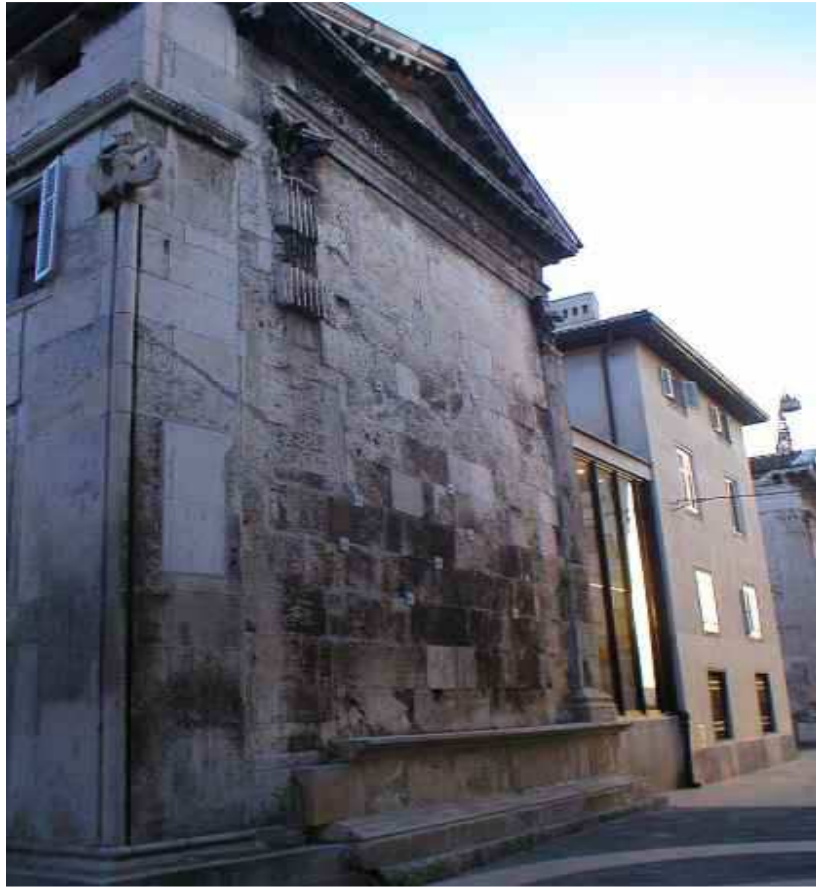
Slika 6. Stražnji zid Dijanina hrama