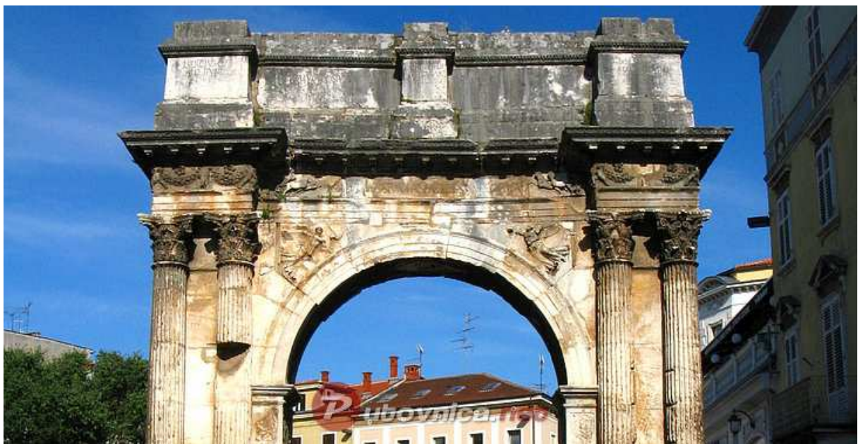
Slika 11. Slavoluk Sergijevaca