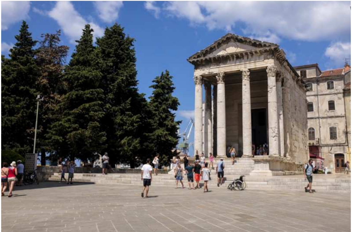
Slika 5. Augustov hram