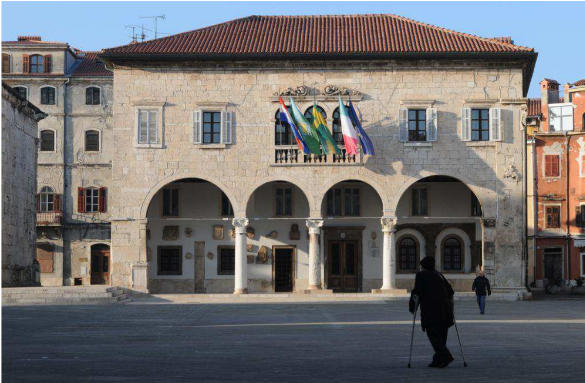
Slika 7. Komunalna palača