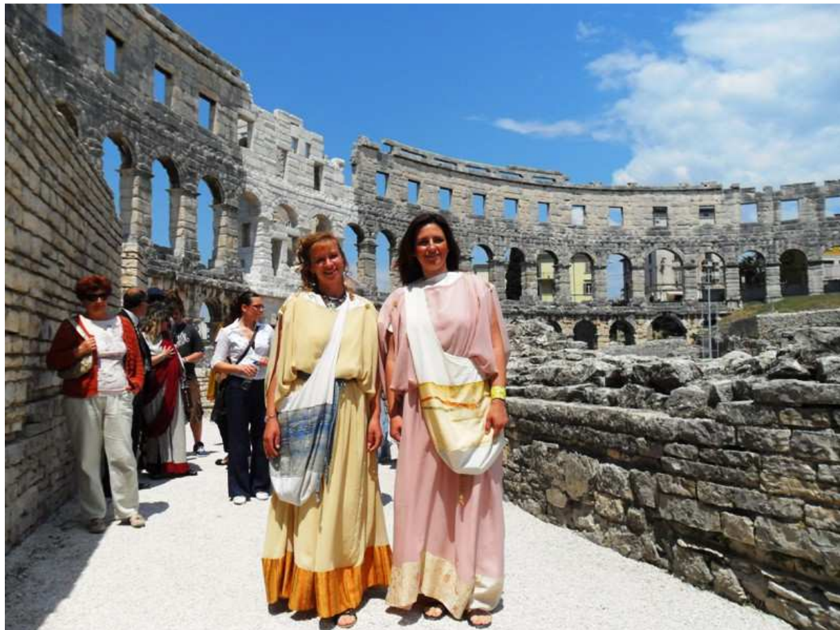
Slika 8. Rimska Pula