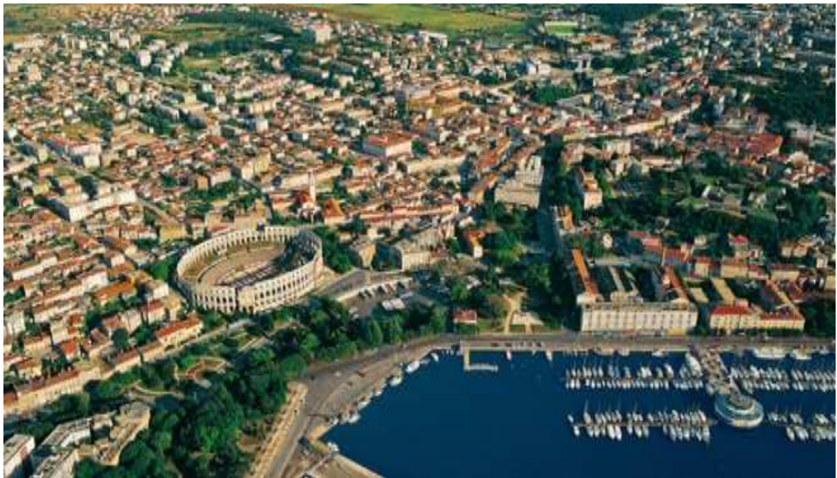
Slika 3. Grad Pula