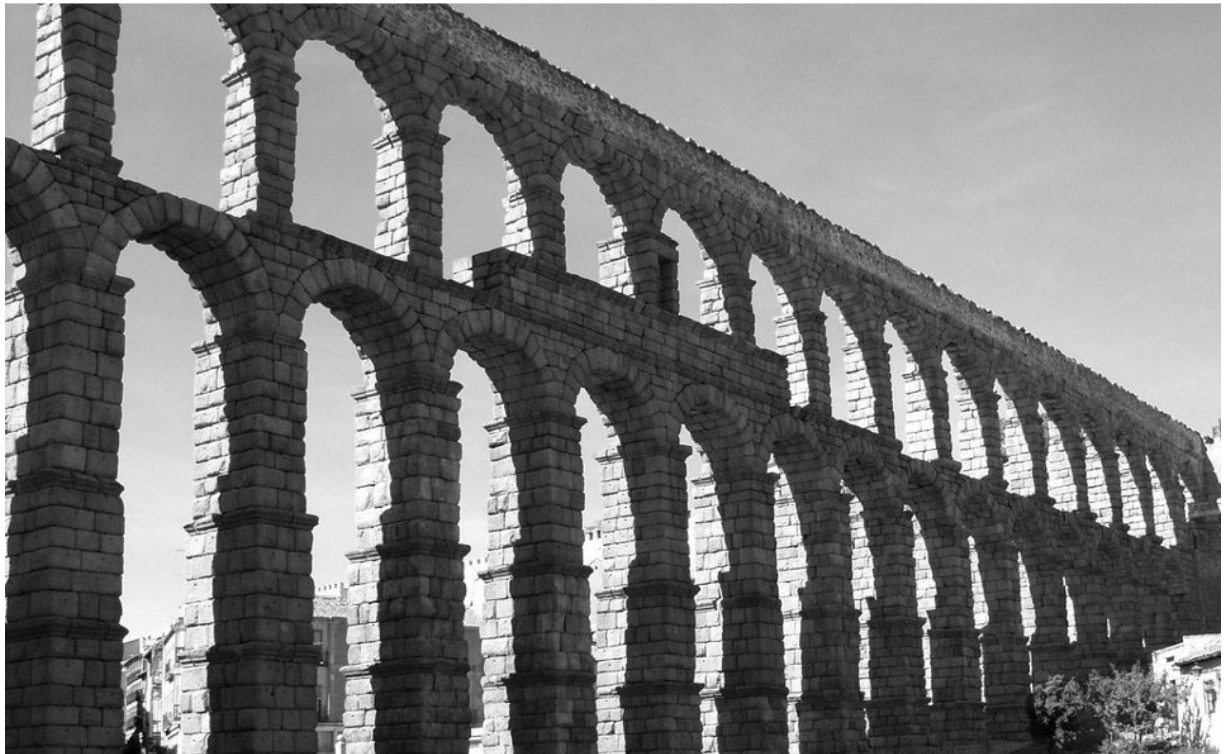
Slika 2. Rimsko Carstvo