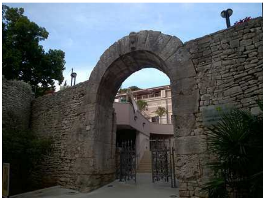
Slika 10. Herkulova vrata