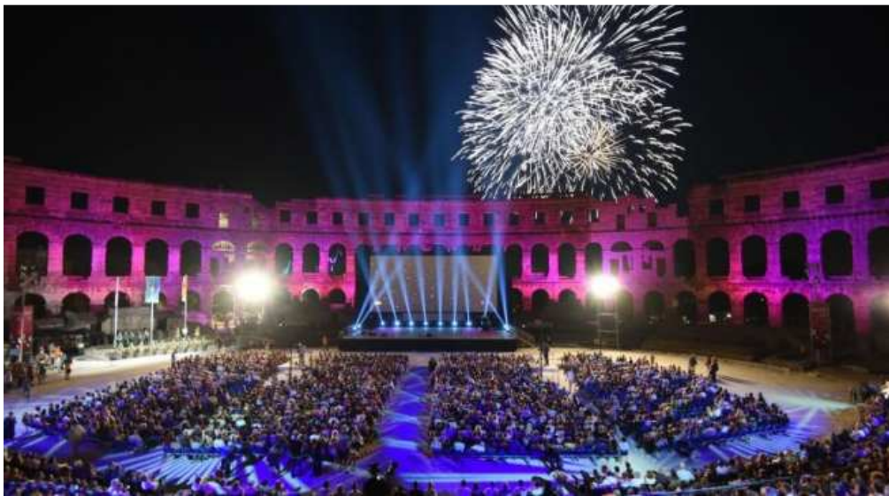
Slika 12. Film festival u Puljskoj areni

Izvor: Telegram, http://www.telegram.hr/kultura/branko-lustig-otvorio-62-puljski-filmski-festival/ , 29. kolovoza 2017.