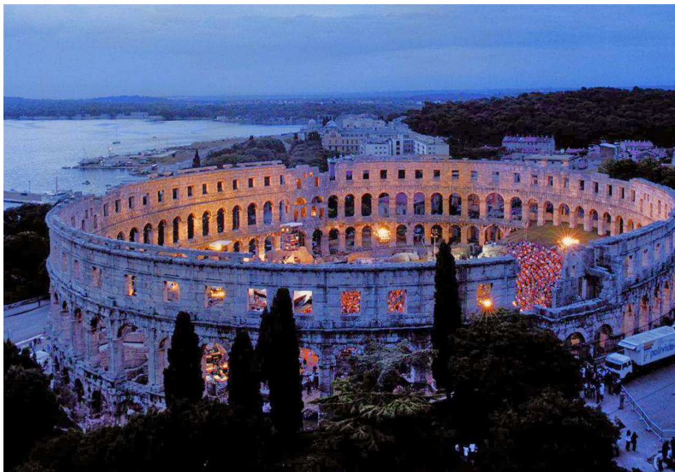
Slika 9. Puljska Arena