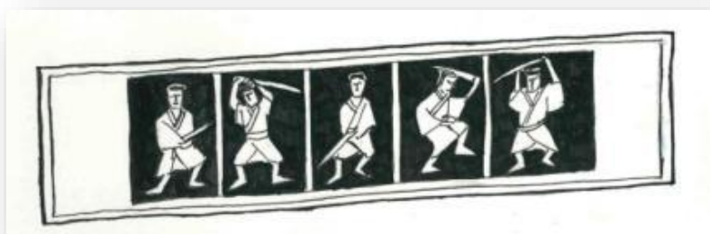
Slika 4. Utusushi

Izvor: http://aboutjapan.japansociety.org/the-many-facesofkamishibai .preuzeto 9.9.2017.