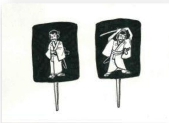
Slika 5. Prikaz oblika Tachi-e