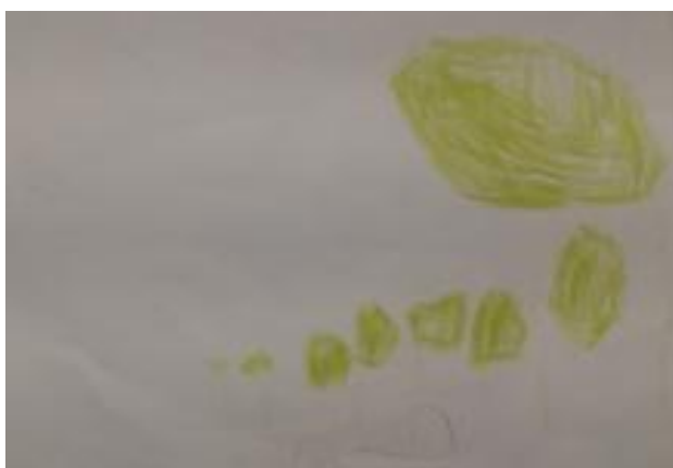
Slika 42. Noel, 4,5 godina: „Čizme putuju kroz šumu gdje se nalaze velika zelena stabla s puno lišća. Čizme su smeđe jer hodaju po zemlji.“