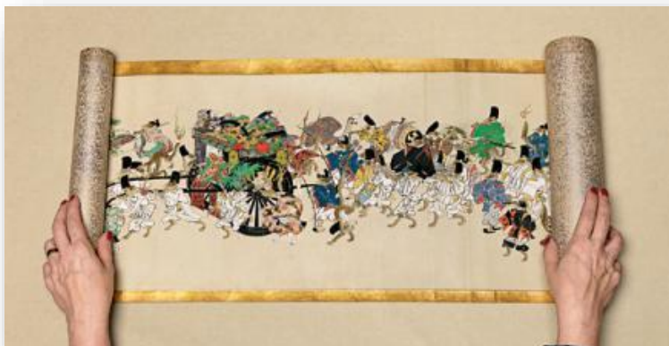
Slika 2. Prikaz oblika Emaki ( ilustrirani svitak)