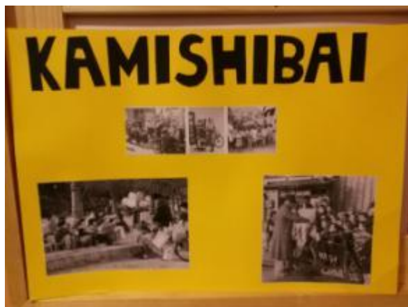
Slika 27. Kamishibai pripovjedači