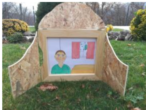
Slika 14. Ilustracija 1.