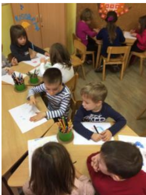
Slika 33. Rad na nastavku priče