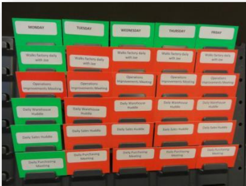
Slika 8. Primjer Kamishibai ploče

Kamishibai ploče u industriji koriste se u službi vizualnog obavještanja i praćenja proizvodnje te zahtijevaju kompleksnije istraživanje i obradu. U kontekstu ovog rada spomenute su kako bi se uvidjelo da Kamishibai zapravo ostavlja utiske i u nekim netipičnim namjenama i svrhama koji nisu toliko poznate.