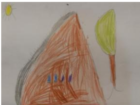
Slika 35. Patrik, 5 godina: „Ove su čizme išle visoko na planinu i nisu bile same, nego je s njima išao i drugi par čizama.“