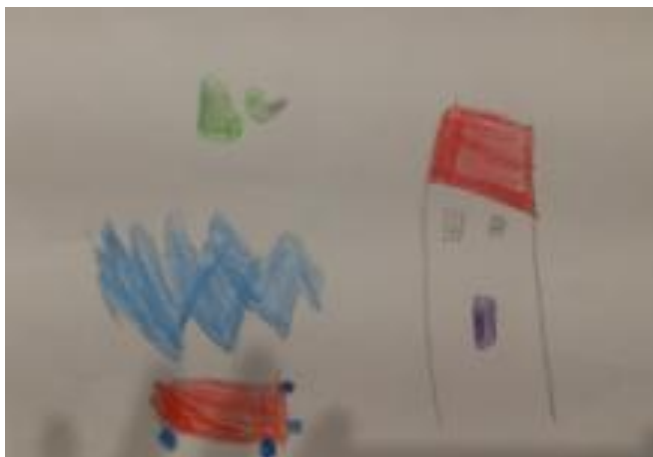
Slika 39. Lejla, 5,5 godina: „Čizmice su išle na more s motorom, ali su se brzo vratile doma.“