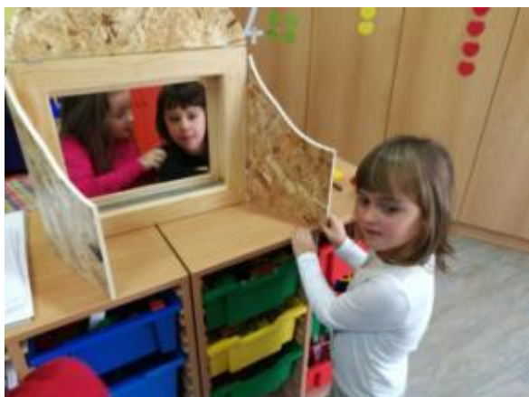
Slika 31. Upoznavanje pozornice