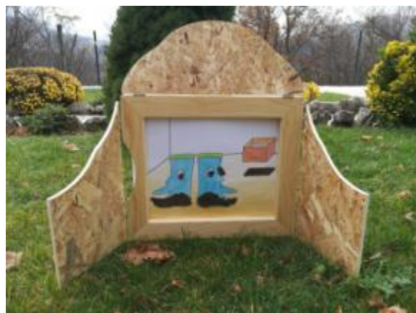
Slika 18. Ilustracija 5.