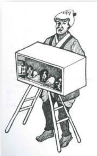
Slika 6. Tachi-e