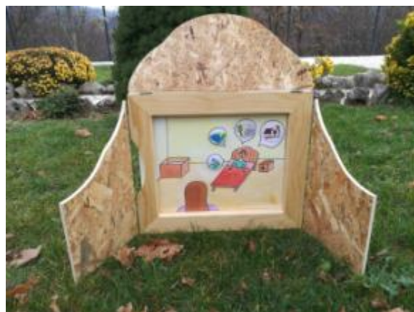
Slika 24. Ilustracija 11.