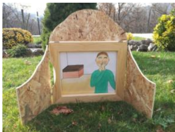
Slika 16. Ilustracija 3.