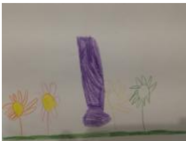
Slika 38. Lana, 5 godina: „Moje čizme štaju na livadi i gledaju cvijeće.“