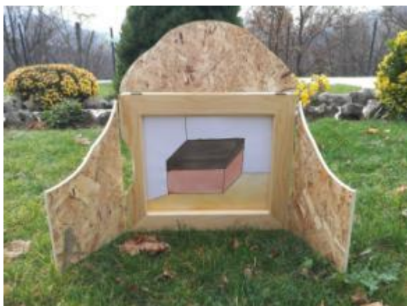
Slika 17. Ilustracija 4.