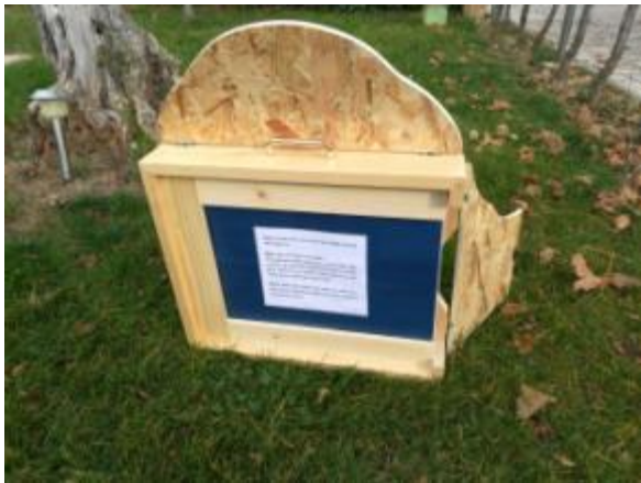
Slika 7. Prikaz teksta na poleđini slike

govorna improvizacija izvođača. Ako se tekst zapisivao, zapisivao se odostraga slika olovkom u najtanjim crtama kako bi bio mali podsjetnik izvođaču ukoliko bi zaboravio detalje radnje. (Nash, 2009: 5, vlastiti prijevod). Kada djeca izrađuju svoje Kamishibai priče, dovoljno je radnju opisati u nekoliko rečenica. Iz tog se razloga i preporučuju dijalozi. Dugi opisi i predugo zadržavanje na jednoj kartici priče, smanjuje dinamičnost izvedbe. Zato tu postoje ostali elementi, poput korištenja onomatopeje, efektivne pauze, emocionalnog tona, mijenjanja glasova koji su na izbor izvođaču i obogaćuju dramatizaciju teksta, odnosno, priče kako sam autor to želi. (McGowan, 2010:37-43, vlastiti prijevod)