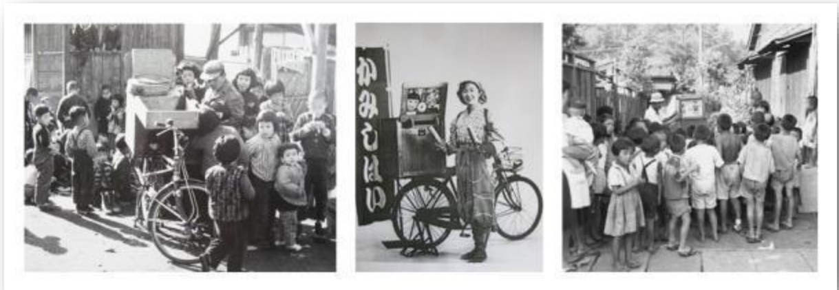
Slika 1. Kamishibai pripovjedač u povijesti