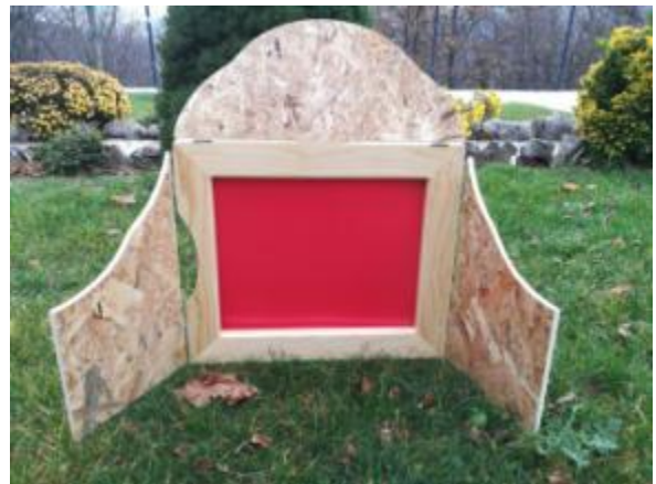
Slika 10. Vrata Kamishibai pozornice