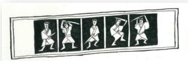
Slika 4. Utusushi