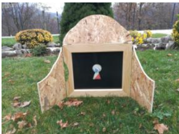
Slika 23. Ilustracija 10.