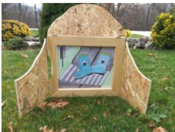
Slika 21. Ilustracija 8.