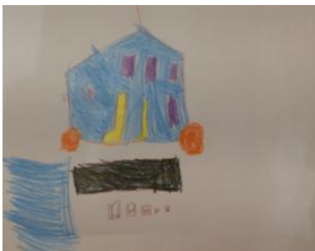
Slika 36. Una, 4,5 godina: „Čizme su jako žute boje i krenule su autima na more. Voze po cesti koja ima puno parkirališta blizu.“