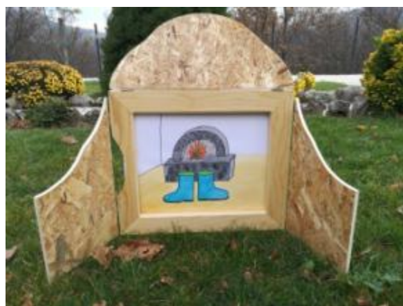
Slika 26. Ilustracija 13.