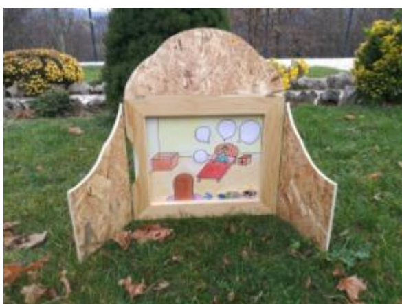
Slika 25. Ilustracija 12 .