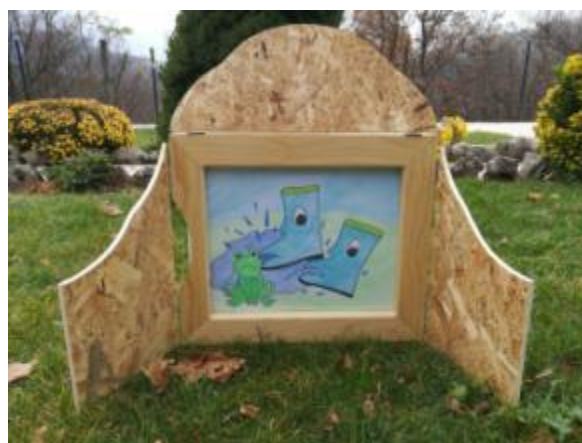
Slika 20. Ilustracija 7.