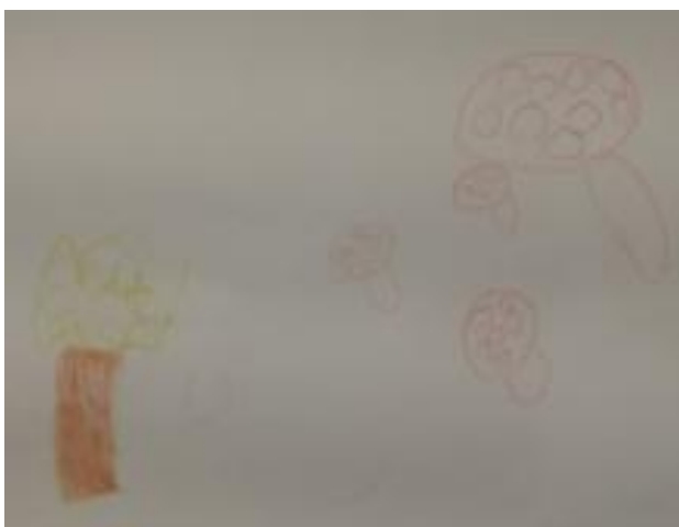
Slika 41. Franka, 5 godina: „Čizme su u šumi i beru gljive.“