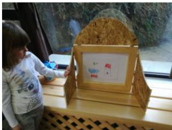
Slika 32. Nastavljanje radnje priče