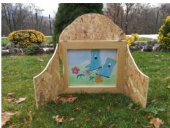
Slika 19. Ilustracija 6.