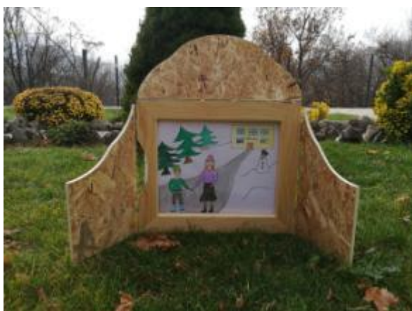
Slika 15. Ilustracija 2.