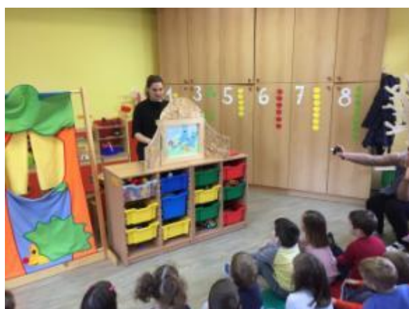
Slika 29. Izvedba Izvor: Odgojiteljica, 27.11.2017.