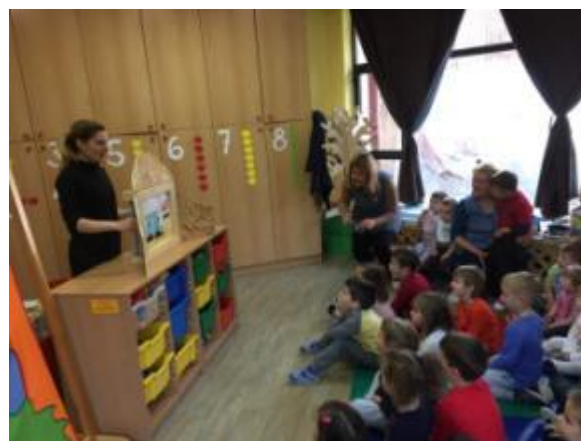
Slika 30. Djeca prate priču