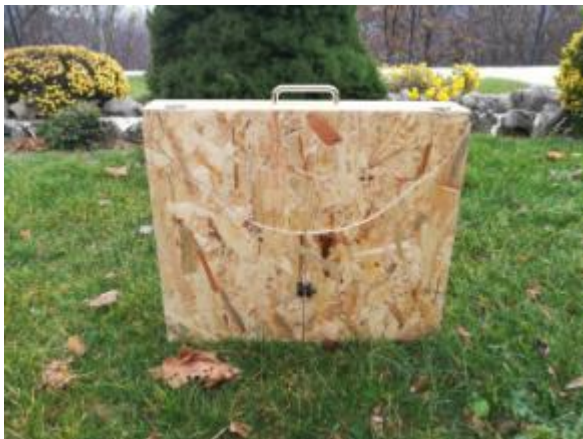
Slika 9. Kamishibai pozornica