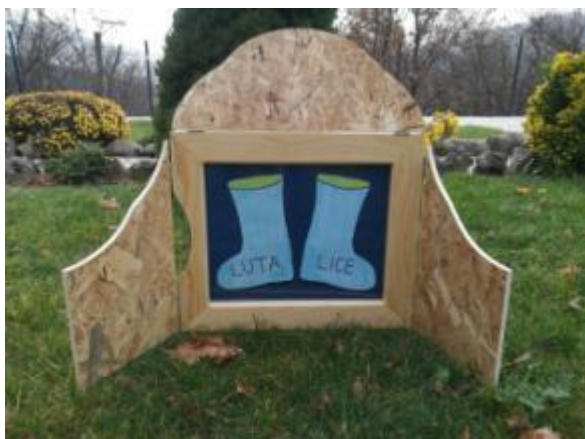
Slika 13. Naslovnica