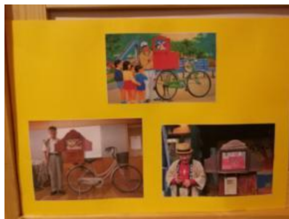
Slika 28. Kamishibai pripovjedači