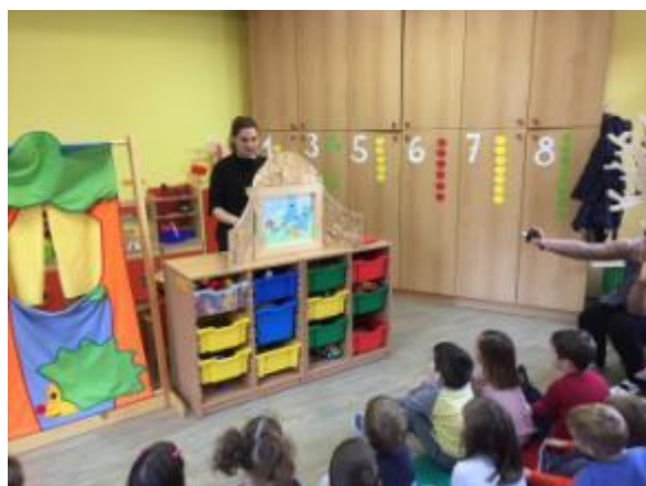
Slika 29. Izvedba Izvor: Odgojiteljica, 27.11.2017.