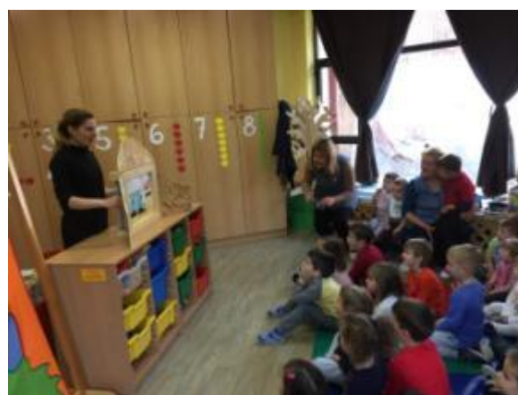
Slika 30. Djeca prate priču