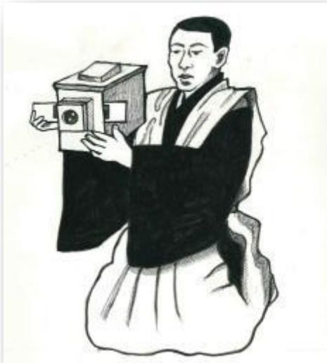
Slika 3. Prikaz oblika Utusushi