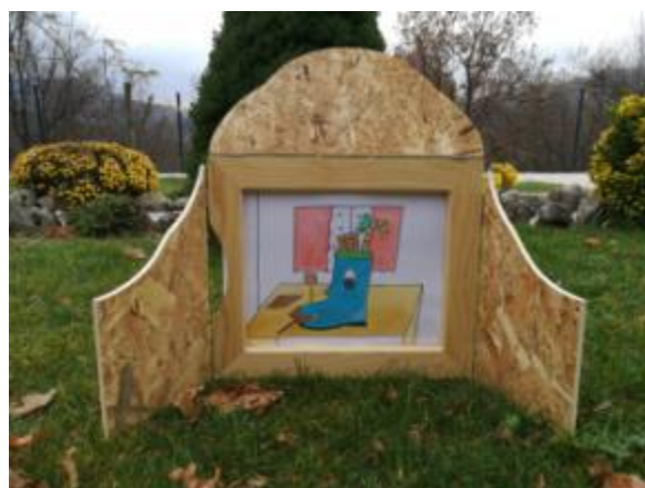
Slika 22. Ilustracija 9.