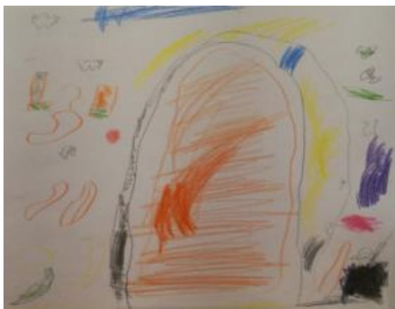
Slika 33. Tea, 4,5 godine: „ Moje su čizmice išle visoko na planinu, na planini je jako padao snijeg. “