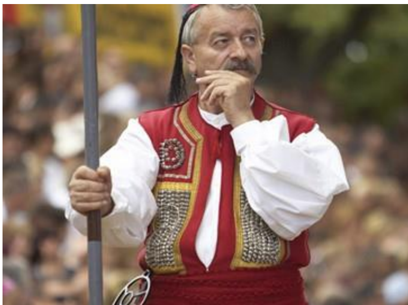
Slika 6. Namještač alke

Na svaki znak trube namještač alke (Slika 6.) se sklanja na lijevu stranu. Oko pasa nosi pričuvnu alku.