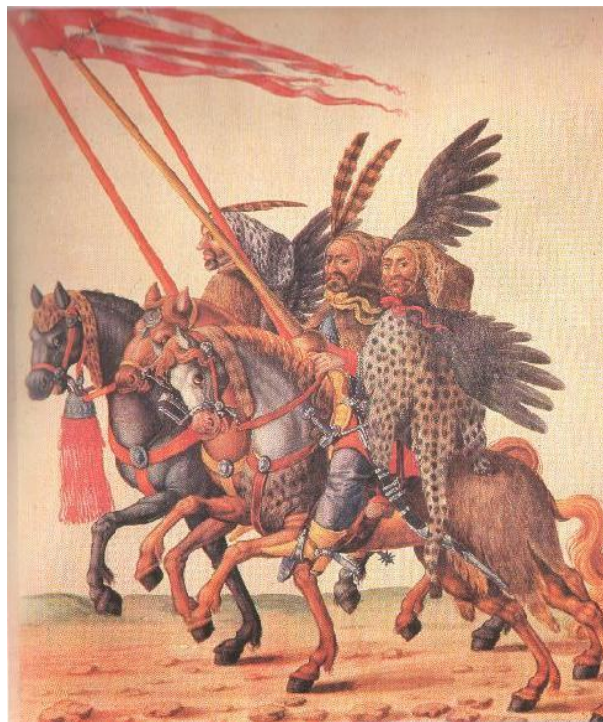
Slika 1. Neredoviti juriški konjanici Akindžije

Prve turske provale i haranja na hrvatskim prostorima započinju koncem 14. stoljeća, najveći zamah su imala u 15. stoljeću, a nešto manji u 16. stoljeću, a u sljedećim stoljećima su bili slabiji, rjeđi i onda su prestajali. Nositelji provala bile su takozvane akindžije. Akindžije (Slika 1) kao lake konjaničke odrede na granicama za provale na neprijateljski teritorij kao uvod u osvajanja, obično je predvodio mjesni sandžakbeg. Provala manjeg dijela akindžija, oko stotinu, nazivala se haramiluk , a sudionici haramije , dok je još manji odred nazvan četa . Akindžije su se upisivale u posebne deftere, a dijelile su se na razrede timarnika i slobodnih baštinika. Pojedine su skupine nazivane prema imenima glasovitih zapovjednika, primjerice, Evrenos-bega i drugi. Na hrvatskom području isključivo sastavljen od muslimana, odred je uključivao kako pridošle etničke Turke, tako i mjesno islamizirano seosko stanovništvo. 3