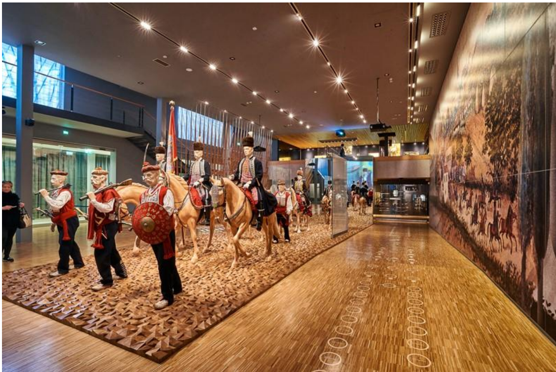
Slika 10. Muzej Sinjske alke

Nakon što je odlukom Vlade Viteško alkarsko društvo Sinj postalo vlasnik cijelog kompleksa alkarskih dvora, 2007. krenulo se s njihovom obnovom. Radovi na dvorima i muzeju potrajali su do 2015. kada je muzej svečano i otvoren. Tradicijska građa u ovom je muzeju uokvirena najvišim muzejskim standardima europskih i svjetskih razmjera, pri čemu je glavni dio muzeja interaktivne prirode. Dio eksponata traži aktivno djelovanje promatrača, što je destigmatiziralo muzejsku baštinu kao sadržaj sasvim odijeljen od posjetitelja. Metodički i pedagoški nimalo apstraktan raspored građe omogućio je da se u njemu svaki posjetitelj osjeća dobrodošlo te da se do informacija i o najmanje poznatim artefaktima može doći i bez posredovanja muzejskog vodiča kao što je vidljivo na slici (Slika 10). 39