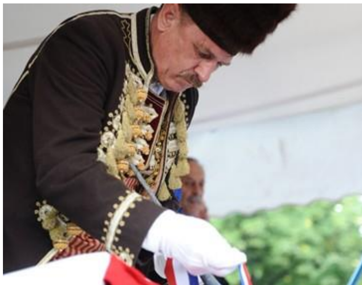
Slika 9. Proglašenje slavodobitnika

preko glavnog trga, prate najprije vojvodu do alkarskih dvora, zatim slavodobitnika i alajčauša, a potom se razilaze. 37