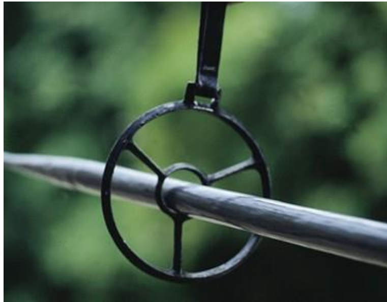
Slika 8. Kolut alke

Obruči i krakovi debeli su 6,6 mm i imaju oštar rub s one strane s koje se kopljem gađa u alku. 36