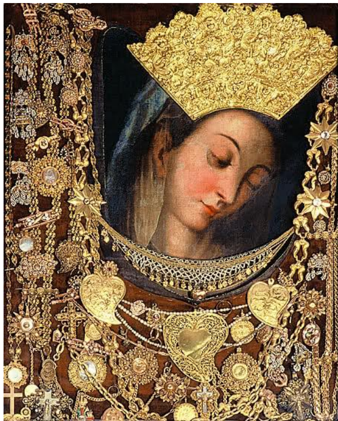
Slika 3. Okrunjena Gospa od Milosti – Gospa Sinjska

Karakteristično za 18. stoljeće je to što se u vrijeme protuturskih ratova u Dalmaciji Marija prizivala kao zaštitnica pod imenom Gospe od Milosti, Kraljice Mira ili Marije Pobjednice te su u tu svrhu Mariji, zaštitnici katoličkog stanovništva u borbama protiv Osmanskog Carstva, posvećivane crkve, oltari, kapele. Najveću vrijednost marijanskog svetišta u Sinju predstavlja slika Gospe od Milosti, koju je naslikao nepoznati mletački slikar u 16. stoljeću. Nakon 1715., koju su branitelji pripisali Gospinu zagovoru, pisac Dnevnika opsade navodi kako su mletački časnici po primitku plaće skupili među sobom oko 80 cekina i poslali dva časnika u Mletke da daju iskovati zlatnu krunu s križem, kojom će okitati Gospinu sliku (Slika 3). Pri dnu krune urezan je natpis u dva reda: In perpetuum coronata triumphat – Anno MDCCXV (Zauvijek okrunjena slavi slavlje – Godina 1715.). 21