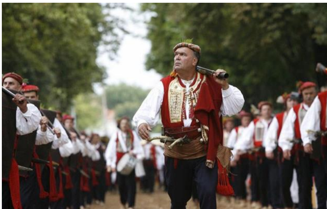
Slika 4. Predvodnik alkarskog natjecanja – arambaša

Alkarsko natjecanje započinje svečanom povorkom koju predvodi arambaša (Slika 4.) i odabrana četa alkarskih momaka, koje slijedi štitonoša koji nosi trofejni turski štit, a potom vodiči edeka (konja bez jahača) na kojemu je trofejna oprema koja je, po legendi, pripadala seraskeru Mehmed-paši Čeliću, kao što je prije navedeno, turskom vojskovođi iz vremena opsade Sinja 1715.