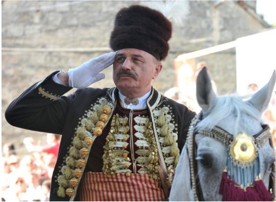
Slika 5. Alkarski vojvoda (zapovjednik Alke)