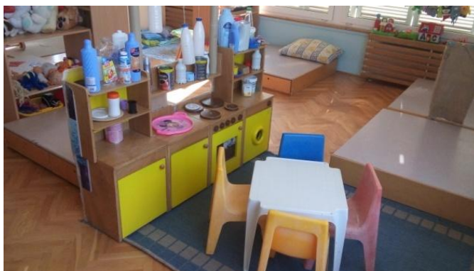
Slika 5 - Kuhinja