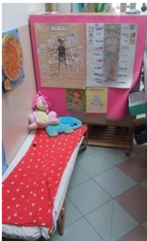
Slika 6 - Kutić (centar) liječnika