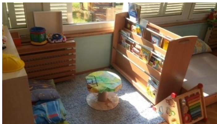
Slika 9 - Knjižnica