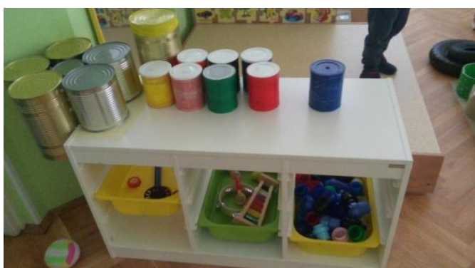
Slika 7 - Glazbeni kutić (centar)