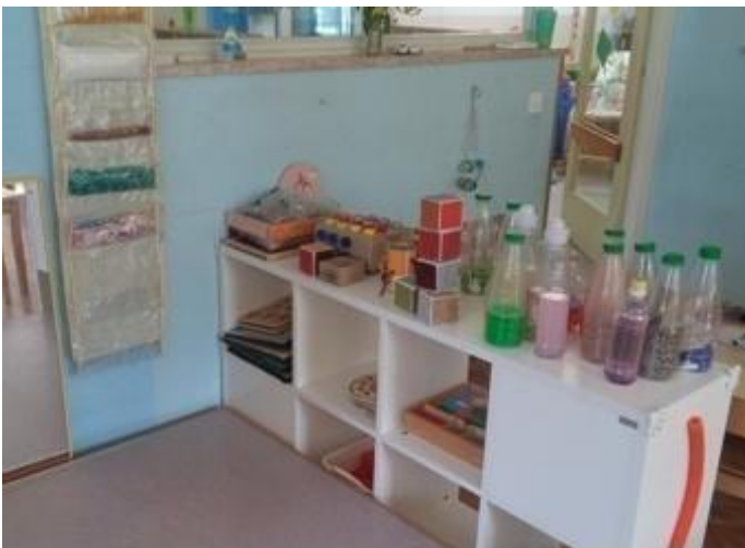
Slika 3 - Kutić (centar) istraživanja