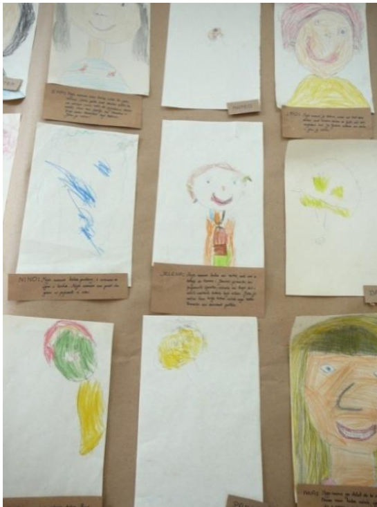
Izvor: Dječji vrtić Olga Ban Pazin