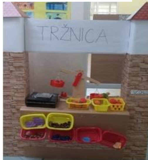
Slika 4 - Tržnica