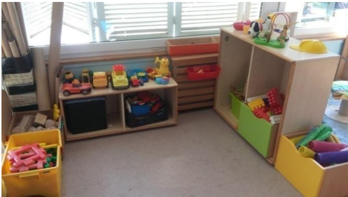
Slika 2 - Kutić (centar) građenja