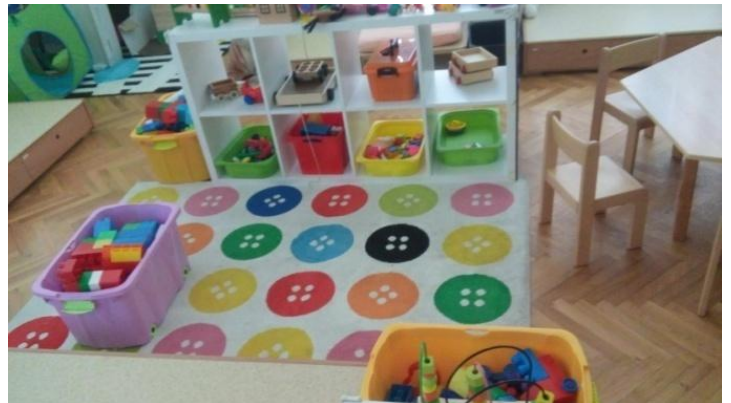
Slika 1 - Kutić (centar) građenja