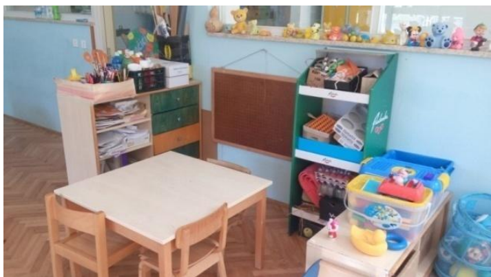
Slika 8 - Likovni kutić (centar)