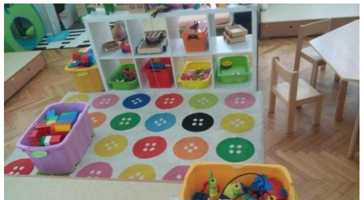
Slika 1 - Kutić (centar) građenja