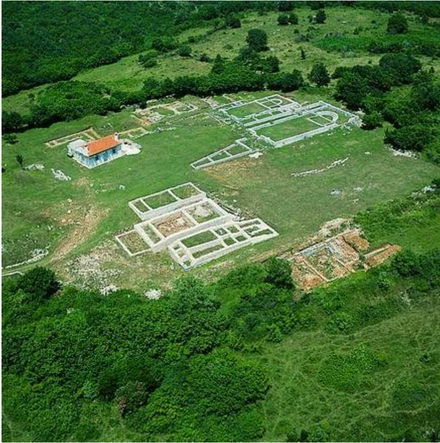
Slika 3. Vizače - Nezakcij