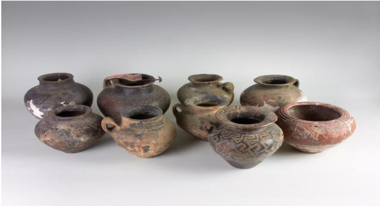
Slika 7. Grobne žare

časopisa Atti e Memorie della Società Istriana di Archeologia e Storia Patria, 22, Parenzo 1905.“ 16