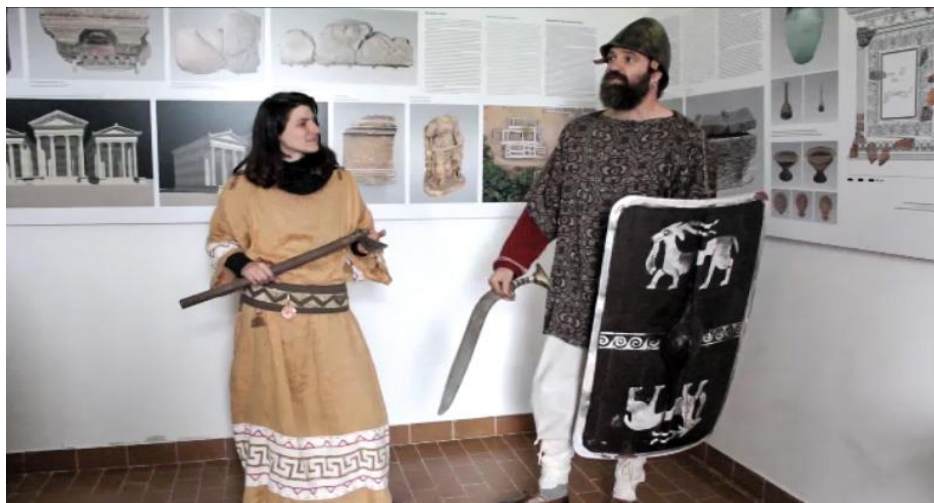
Slika 9. Kostimirani glumci predstavljaju Nezakcij

Turistička zajednica Općine Ližnjan u suradnji s klasterom turističkih zajednica južne Istre i Hrvatskom turističkom zajednicom organizira posjete stranih agenata i domaćih i stranih novinara kako se Nezakcij promovirao i na stranim tržištima. Glumci koji su educirani o Nezakciju, odjeveni u kostime Histra sa rekonstrukcijama instrumenata i oružja, vode posjetitelje po lokalitetu i pričaju im o Histrima i Nezakciju (Slika 9).