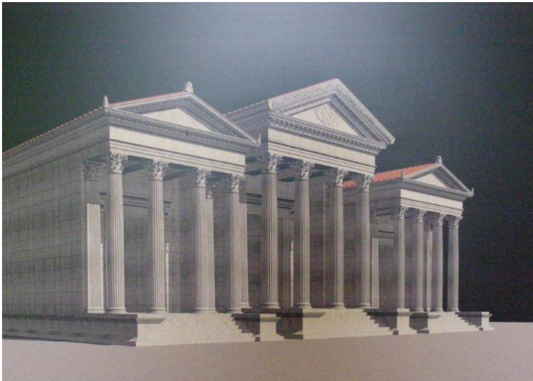
Slika 5. Vizualizacija antičkih hramova

„Središte antičkog grada nalazilo se na južnoj polovici gornje terase. Na njegovom zapadnom dijelu sačuvani su temelji triju hramova (Capitolium), od kojih je srednji duži i širi. Ostaci ne omogućavaju identifikaciju hramova, iako se vrlo vjerojatno radilo o kapitolijskoj trijadi (Jupiter, Junona, Minerva). U hramove se ulazilo monumentalnim stepeništem sa Foruma.“ 13