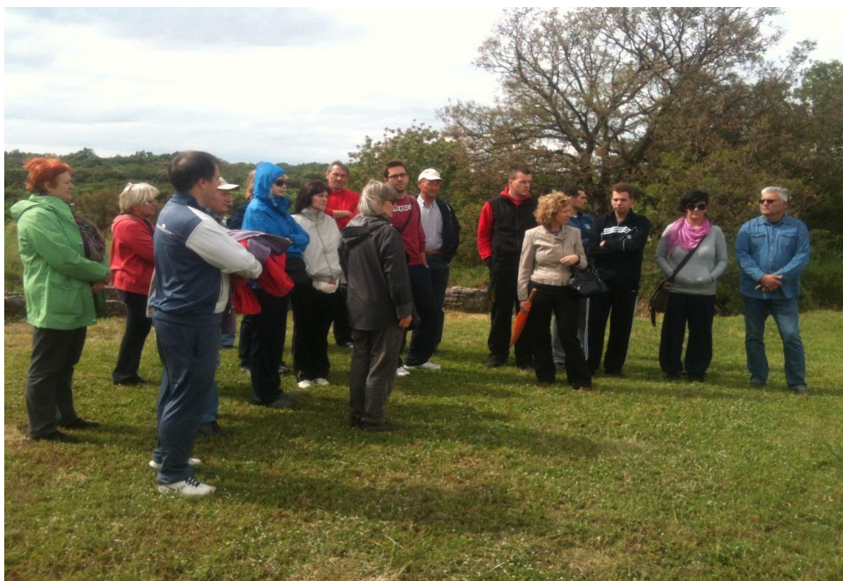
Slika 2. Razgledavanje Nezakcija

doživljaj turista i omogućuju stvaranje potpunije slike o određenoj zemlji, regiji ili mjestu.“ 7 Sukladno tome, turistička zajednica Općine Ližnjan osmislila je zanimljiv proizvod koji je prije svega namijenjen lokalnom stanovništvu i subjektima u turizmu. Proizvod pod nazivom „Ližnjanski vremeplov“ nastao je u suradnji s jedinicom lokalne samouprave i s Arheološkim muzejom Istre s ciljem educiranja putem relevantnih izvora i s mogućnošću kreiranja dodatne ponude i razvoja proizvoda. U sklopu „Vremeplova“ posjetili su se lokaliteti na području Općine Ližnjan, uz stručno vodstvo zaposlenih voditelja odsjeka u muzeju koji su na zanimljiv način predstavili posjećene lokalitete (Slika 2).