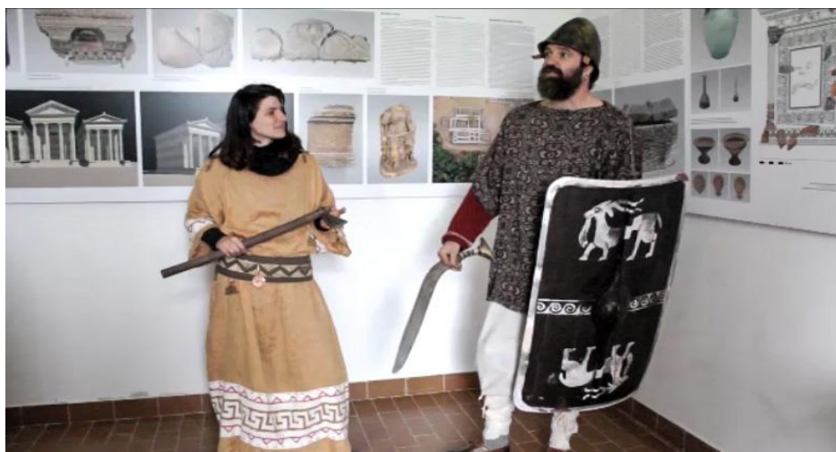
Slika 9. Kostimirani glumci predstavljaju Nezakcij

Turistička zajednica Općine Ližnjan u suradnji s klasterom turističkih zajednica južne Istre i Hrvatskom turističkom zajednicom organizira posjete stranih agenata i domaćih i stranih novinara kako se Nezakcij promovirao i na stranim tržištima. Glumci koji su educirani o Nezakciju, odjeveni u kostime Histra sa rekonstrukcijama instrumenata i oružja, vode posjetitelje po lokalitetu i pričaju im o Histrima i Nezakciju (Slika 9).