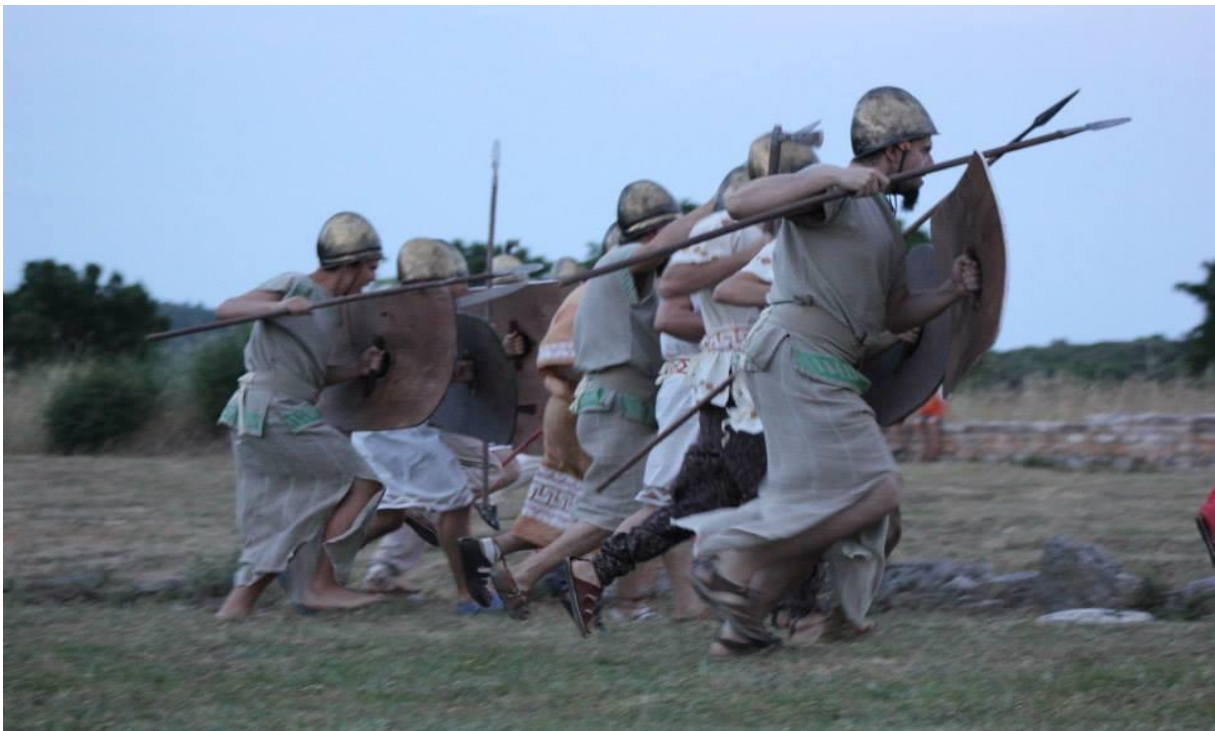
Slika 8. Predstava Epulon - kralj Histra

Režiju i adaptaciju teksta predstave u sklopu manifestacije potpisuje Petra B. Blašković (HNK Osijek), u glavnim ulogama gostuju glumci iz Hrvatskih narodnih kazališta. Kostime je izradila kostimografkinja Marina Sršen kojoj su za kreaciju kostima pomogli prikazi na situli pronađenoj u Nezakciju.