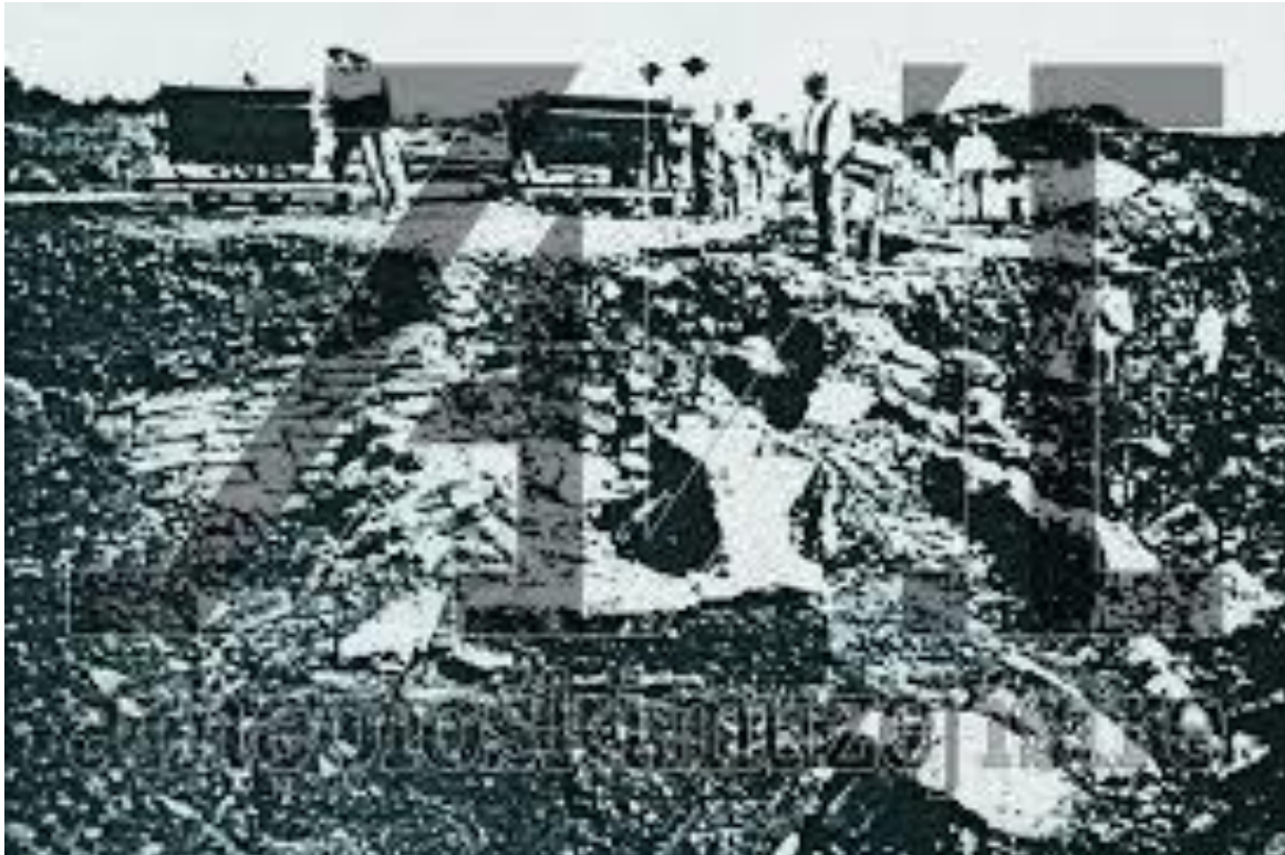
Slika 6. Arheološka istraživanja Nezakcija

Arheološka istraživanja Nezakcija započela su 1900. (Slika 6), u organizaciji Società Istriana di Archeologia e Storia Patria iz Poreča, u čijem sastavu su bili Bernardo Schiavuzzi, Pietro Sticotti i Alberto Puschi. Bila su to najveća arheološka istraživanja Nezakcija. Koliko su nalazi bili bogati u prilog tome govori i činjenica da predstavljaju osnovu Arheološkog muzeja Istre u Puli koji je utemeljen 1902.