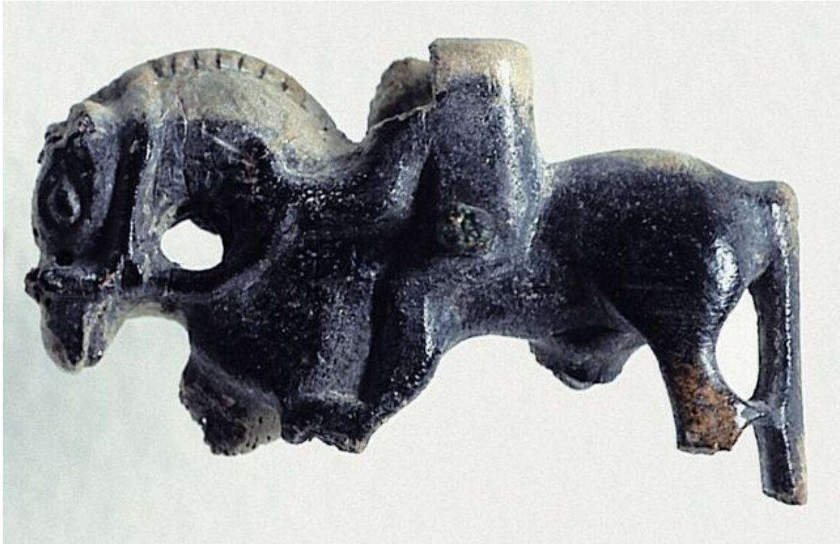
Slika 4. Koštani konjić s jahačem