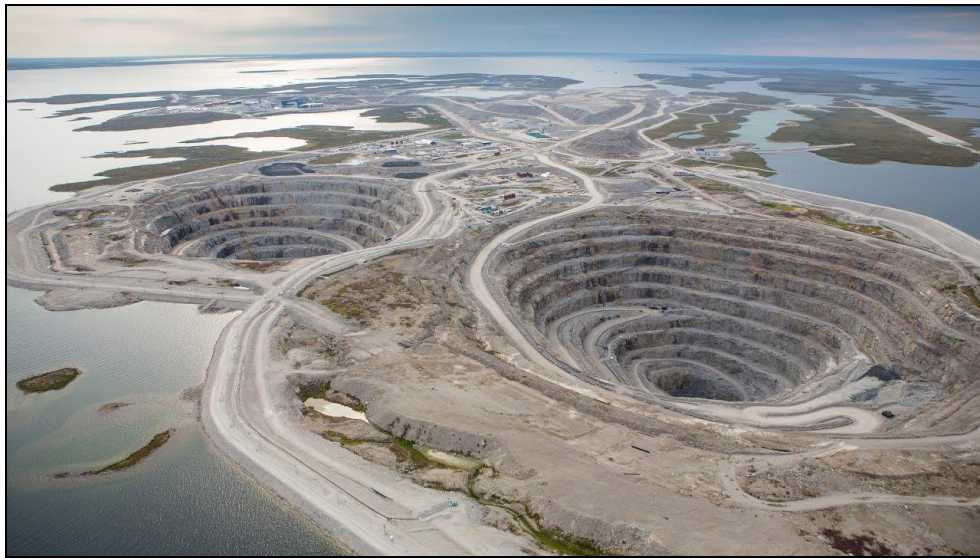
Slika 2. Rudnik Diviak