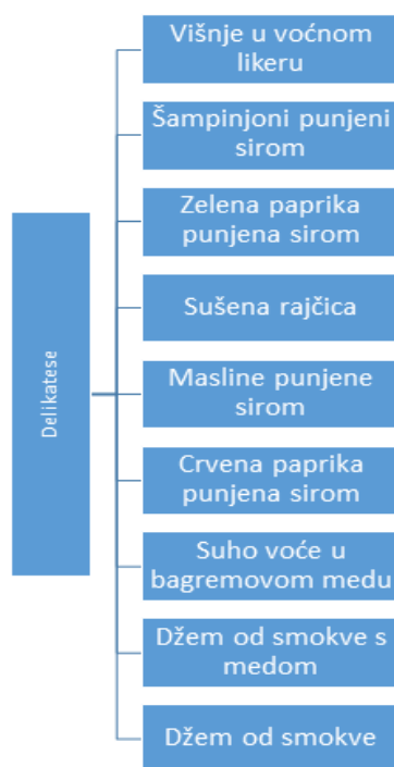
Tablica 3: Prikaz delikatesa

Najbitnija funkcija jednog poduzeća je proizvodnja jer od nje ovise sve druge aktivnosti tog poduzeća.