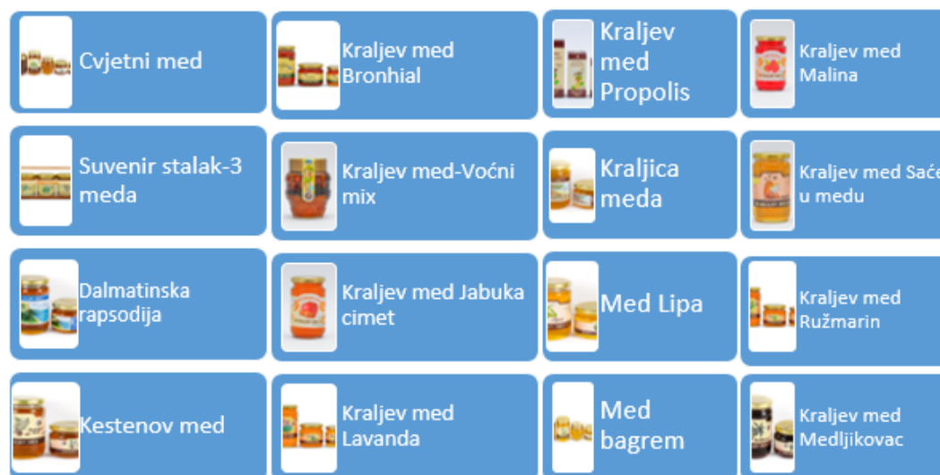
Grafikon 1: Vrste meda poduzeća Kralj Bar-Vil d.o.o.

Proces proizvodnje meda podrazumijeva suradnju pčela i pčelara. Početno, pčele sakupljaju nektar iz prirode i donose ga u košnicu. U daljem procesu nektar se prerađuje u organizmu pčele, obogaćuje enzimima i kasnije skladišti u ćelije saća. Takav med sadrži visoki postotak vode koja se zahvaljujući specifičnoj mikroklimi u košnici odstranjuje i nakon određenog vremenskog perioda taj nivo vlažnosti se dovodi na oko 20%. Med pčele zatvaraju (plombiraju) unutar ćelija saća i za taj med kaže se da je zreo, odnosno da se može oduzimati iz košnice.