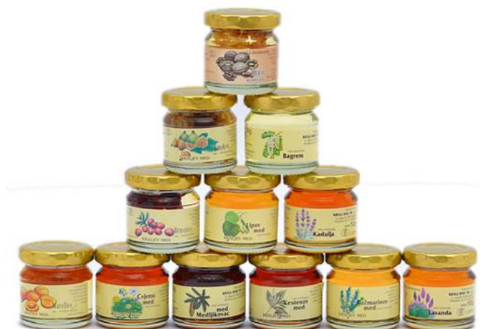
Slika 2: Kraljev med, sve vrste 50g

Kraljev med, izvor: https://kraljevmed.hr/proizvodi/kraljev-med/kraljev-med-vrste/10.07.2017