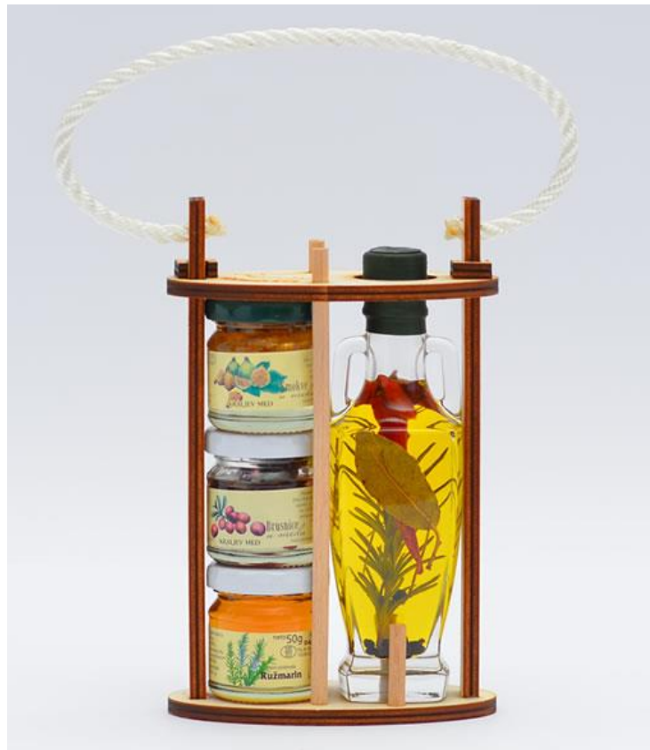
Slika 4: Stalak tri meda i začinsko maslinovo ulje

Kraljev med, izvor: https://kraljevmed.hr/proizvodi/suveniri/stalak-tri-meda-zacinsko-maslinovo-ulje/ 13.07.2017.