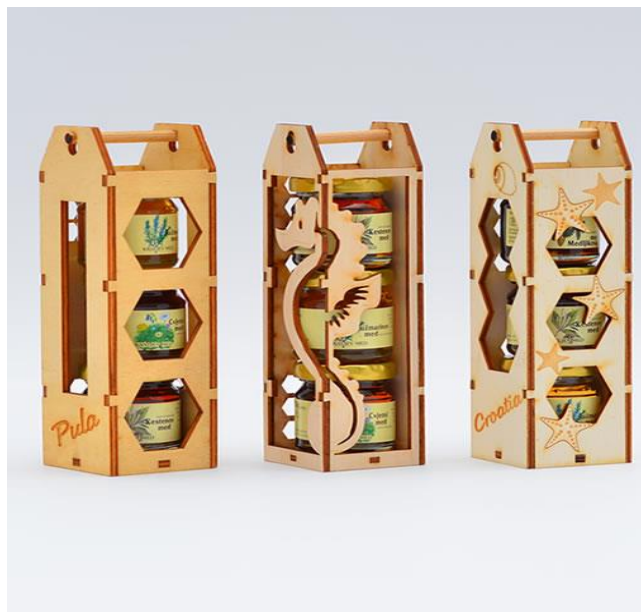
Slika 3: Suvenir – Stalak tri meda visoki

Kraljev med, izvor: https://kraljevmed.hr/proizvodi/suvenir/suvenir-stalak-tri-meda-visoki-2/ /13.07.2017.