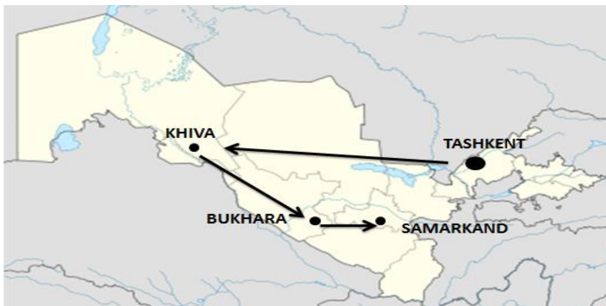
Slika 2. Putovima svile kroz Uzbekistan

Osim što je zemlja bogata arhitekturom, brojnim džamijama i madresama te je dostojno prikazan život ljudi toga vremena sadrži i mnoge nedostatke zbog kojih se turisti možda neće odlučiti posjetiti odredište. Problem čine politički nemiri kao i zemljopisna udaljenost za europske posjetitelje. Turistička tura predstavlja pozitivnu stranu zemlje, no zbog političkih nemira, mnogi turisti će Uzbekistan zaobići na svom putovanju.