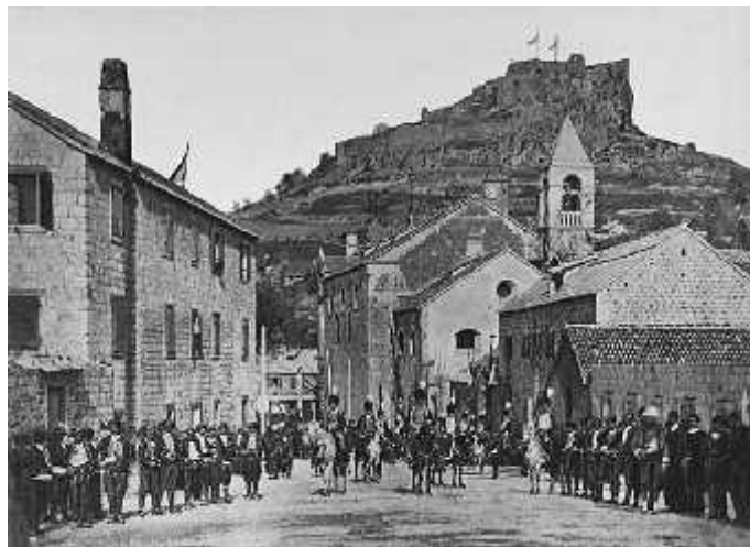
Slika 13. Alkarska povorka u Sinju 18. V. 1875.

pravilima tr i se, tako er u kolovozu, u prvoj tre ini mjeseca. Alka se, osim u Sinju tri puta tr ala izvan njega: 1832. u Splitu (povodom zatvaranja i oslobo enja jednog uglednog gra anina Sinja), 1922. u Beogradu (povodom vjen anja kralja SHS Aleksandra Kara or evi a) te 1946. u Zagrebu, u ast Josipa Broza Tita, povodom III. kongresa Ujedinjenog saveza antifašisti ke omladine Jugoslavije (Gr i , 2001.; Vukuši 2013.).