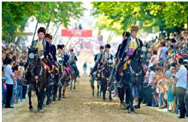
Slika 16. Alkari kopljanici

Alkar je onaj koji jaše na konju u alkarskoj povorci i obu en je u alkarsku odoru. Alkari se, kao i alkarski momci koji sudjbeluju u alkarskoj povorci i natjecanju, biraju isklju ivo izme u lanova Viteškog alkarskog društva koji su ro eni u Cetinskoj krajini, kao i oni kojima su roditelji u njoj zavi ajni. Izbor alkara vrši se svake godine. Alkarom može postati onaj lan koji je nao ita izgleda i juna kog držanja, ako je dobar jaha te ako desnom rukom dobro vlada kopljem. U Alkarskom natjecanju sudjeluje najmanje jedanaest, a najviše sedamnaest alkara kopljanika, uklju uju i alaj- auša. U svakoj trci alkari tr e onim slijedom koji odredi vojvoda na prijedlog alaj- auša (sl. 16).