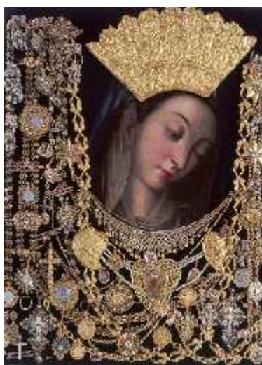
Slika 11. Gospa Sinjska

„svaku noću u vrijeme opsidne odoit po zidu Grada jednu ženu u velikoj svitlosti...”