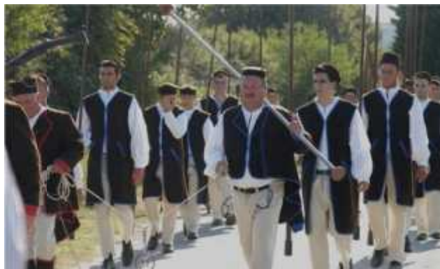
Slika 9. Nosa i prstenca i kopljonoše u povorci