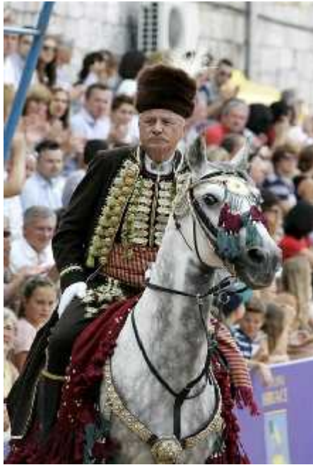
Slika 19. Alkarski vojvoda

izraena u filigranima. Kalpak je od tamnosmeđe kunovine s perjanicom od apljina perja. Sablja mu je zlatom okovana i bogato ukrašena (sl. 19).