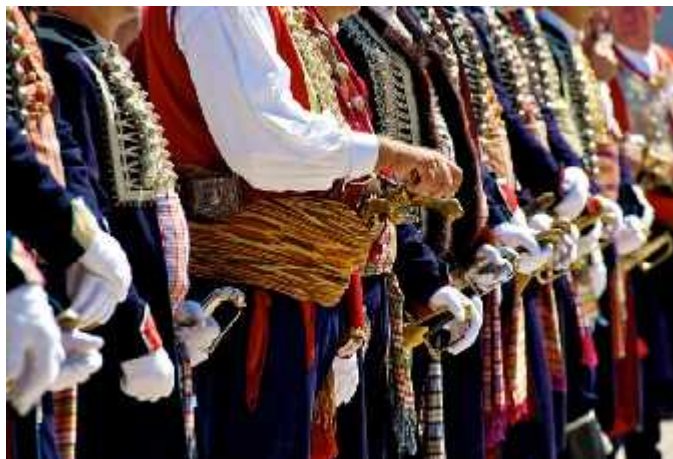
Slika 18. Detalji alkarskih odora