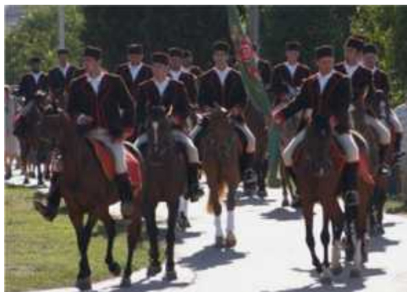
Slika 5. Konjanici u povorci