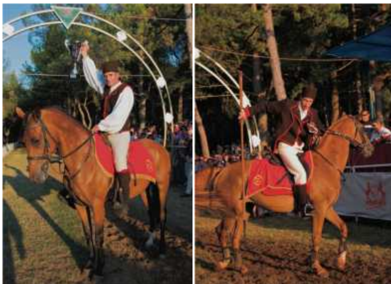
Slika 10. Barbanski konjanici i konji

Tradicionalna narodna nošnja Barbanšine bila je polazna osnova u kreaciji oprava sudionika Trke. Svima je zajedni ka platnena košulja u varijantama s kolarinom ili centinom, hla e brnaveke od bijelog sukna, krožat i klobu i u niskoj ili visokoj varijanti. Prepoznatljivost natjecatelja-konjanika ogleda se u žarko crvenim porubima na tamnosme em suknu, dok ostali sudionici imaju plave porube. Kopljonoše se tako er isti u svojom odorom i to zbog duge kamižole bez rukava. Jedino odstupanje od tradicijskog odijevanja jesu izme koje su zamijenile upanke (sl. 5, sl. 10).