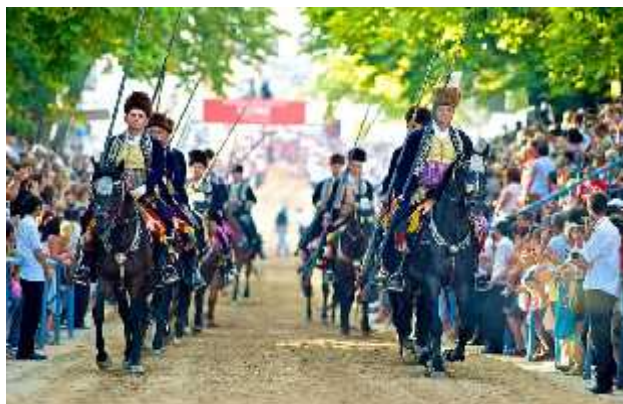
Slika 16. Alkari kopljanici

Alkar je onaj koji jaše na konju u alkarskoj povorci i obučen je u alkarsku odoru. Alkari se, kao i alkarski momci koji sudjeluju u alkarskoj povorci i natjecanju, biraju isključivo između članova Viteškog alkarskog društva koji su rođeni u Cetinskoj krajini, kao i oni kojima su roditelji u njoj zavičajni. Izbor alkara vrši se svake godine. Alkarom može postati onaj član koji je na oči izgleda i junačkog držanja, ako je dobar jahač te ako desnom rukom dobro vlada kopljem. U Alkarskom natjecanju sudjeluje najmanje jedanaest, a najviše sedamnaest alkara kopljanika, uključujući i alaj-čuša. U svakoj trci alkari trče onim slijedom koji odredi vojvoda na prijedlog alaj-čuša (sl. 16).