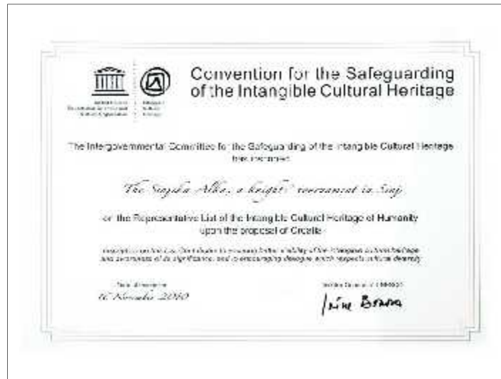
Slika 12. UNESCO-va Povelja o upisu Alke na Reprezentativnu listu nematerijalne kulturne baštine ovje anstva, 2010.