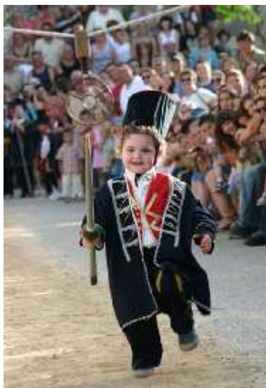
Slika 26. Vu kovi a dje ja alka

Gotovo svaka ulica i svako sinjsko naselje ima svoju dje ju alku. Uz najpoznatiju Vu kovi a dje ju alku, zanimljive su i ostale dje je alke u Sinju. Neke od njih jesu: Brnaška alka, Mari a alka, Alka Baljkov most, Lu ka alka, dvije dje je alke na Bazani, zatim Alka Pelimovac, Alka Bori evac itd. Neke dje je alke su stare i nekoliko desetaka godina, a ve ina ih se održava nakon Sinjske alke, u drugoj polovici mjeseca kolovoza. Neke su Alke starije i od Vu kovi a dje je alke, a neke se voze i na biciklu. Svima je zajedni ko da se održavaju po uzoru na Sinjsku alku i da ih tr e djeca koja imaju isti san – postati pravi alkari i sudjelovati na „velikoj“ Alki (Sinjska Alka, 2015.).