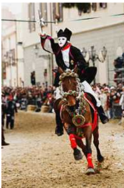
Slika 1. Sa Sartiglia

Promjenama u načinu ratovanja tijekom 16. st. i razvojem vatrenog oružja tijekom 17. st., s bojnih polja polako nestaje konjica, a njezino mjesto preuzimaju pješaci naoružani mušketama. U ratovima se više ne služe kopljima, po njima propadati viteški stalež, a turniri gube na popularnosti. Osim Sinjske alke, prestaju se održavati trke na prstenac (Klen, 1976.).