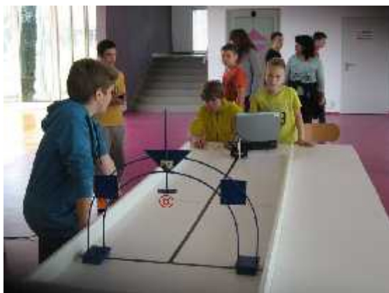
Slika 25. Robotrka na prstenac

Robotrka na prstenac održava se od 2012. u organizaciji Društva za robotiku Istra. Radi se o natjecanju za učenike osnovnih škola iz Istre i Kvarnera, osnovanom s ciljem popularizacije robotike. Natjecanje je ekipno i ekipa ima tri učenika. Cilj natjecanja je osvojiti što više bodova (punata). Bodovi se osvajaju pogađanjem prstenca kopljem koje se nalazi na robotu. Postoji više disciplina i svaki učenik ekipe sudjeluje jednom u svakoj disciplini. Za prvo natjecanje organizirane su tri discipline. Kod poluautomatskog upravljanja robot sensorima svjetlosti prati crnu crtu širine 15 do 20 milimetara koja ga vodi do prstenca. Tijekom vožnje robota, natjecatelj preko računala upravlja samo pomicanjem koplja nakon što robot samostalno prijeđe trećinu staze. Kod ručnog upravljanja natjecatelj preko računala upravlja kretanjem robota i koplja. Postoji i disciplina ručnog upravljanja iz perspektive robota, gdje natjecatelj upravlja kretanjem robota i koplja iz perspektive robota dobivene na monitoru pomoću kamere koja je povezana s računalom. I ovo natjecanje, kao i dva prethodno spomenuta, ima svoj vlastiti sud. Budući da je ovo natjecanje još u začetku, namjera je da Robotrka na prstenac bude svojevrsno kup natjecanje koje uključuje više okupljanja učenika tijekom godine i u različitim sredinama. Završnica kup-natjecanja za svaku školsku godinu bila održavana u Barbanu kao dio programa Trke na prstenac (sl. 25), (Suman, 2014.).