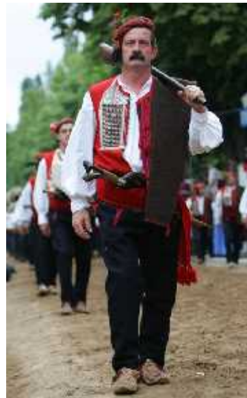
Slika 22. Alkarski momak