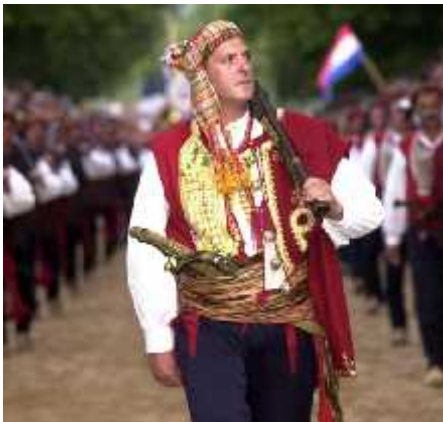
Slika 21. Arambaša