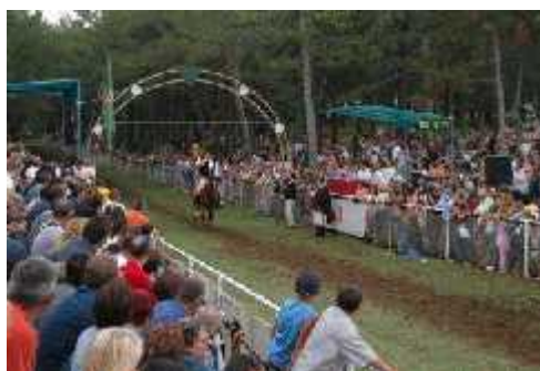
Slika 6. Trkalište na Gradiš u

Trkalište se nalazi na lokalitetu Gradiš e, kamo je iz središta mjesta premješteno 1978. Dužina staze, od starta do prstenca, iznosi 150 metara. Konjanik ju, u punom galopu konja, mora prije i u vremenu od 12 sekundi. Uz trkalište je postavljena zaštitna ograda; s jedne strane se nalazi sve ana loža za visoke dužnosnike i tribine za uzvanike, a s druge strane je slobodni prostor za gledatelje. Ispred sve ane lože nalazi se stilizirani luk u obliku potkove koji je postavljen preko staze, izme u kojeg je rastegnut konopac na kojem visi prstenac (sl. 6).