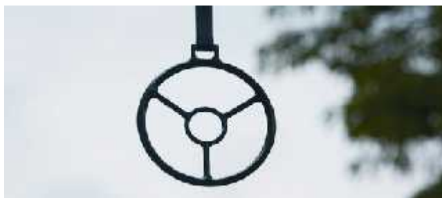
Slika 15. Alka (meta)