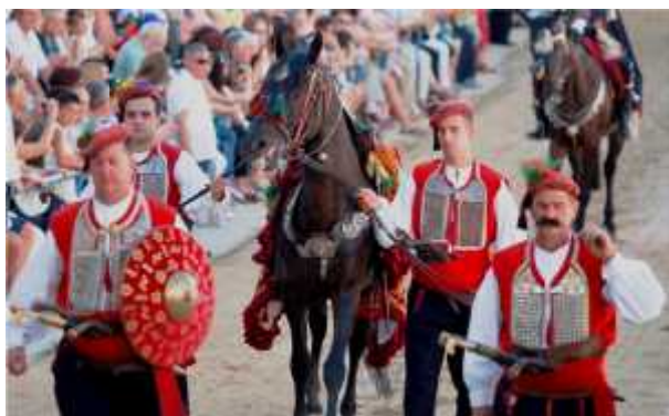
Slika 23. Štitonoša, buzdovandžija, vodi i edeka