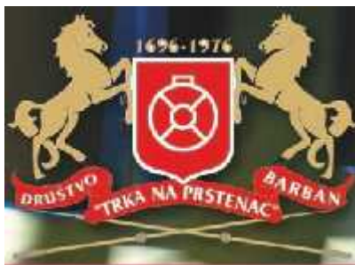
Slika 4. Grb Društva Trka na prstenac

Prema podacima iz 1696., Trka se održavala na dan Duhova u lipnju, ali su organizatori obnovljene Trke odlučili ili termin premjestiti u kolovoz, kada je turistička sezona u punom jeku. Njezina je svrha održavanja, tako je od samih početaka, izrazito turistička. Od tada se Trka na prstenac održava tri vikenda u mjesecu kolovozu. Službeni dio programa započinje u večernjim satima, u petak sveanim podizanjem zastave s grbom Društva Trka na prstenac 13 (sl. 4). Nastavlja se otvaranjem izložbi i drugim kulturnim programima te tradicionalnim turnirom u briškuli i trešeti. Idući dan, u subotu, središnji događaj je Trka za viticu, a uz nju organizirani su i sportski događaji, nogometni turnir i turnir u pljočkanju. Navečer je na glavnom trgu organizirana zabava uz koncert popularnih izvođača. U nedjelju je glavni događaj, odnosno Trka na prstenac koja započinje u 17:00 sati, a nakon toga slijedi kulturno-umjetnički program i koncert zabavne glazbe.