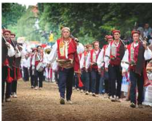
Slika 17. Alkarski momci

Alkarski momak je pješak u alkarskoj povorci koji je obućen u bogatu narodnu nošnju, a na ramenu nosi pušku kremenjaču. On je alkarov pomagač i dužnost mu je prihvatiti konja i koplje svog alkara nakon svake trke. Alkarski momci su naočiti, stasiti, kršni i plešati ljudi. Oni su predstavnici svih slojeva Cetinske krajine. U izbor alkarskih momaka ulaze oni koji vanjskim izgledom, visinom i izrazom lica, dostojanstvenim držanjem i odrješitošću najbolje odgovaraju zahtjevima momaka za dužnosti, imaju razvijen osjećaj za koračanje u taktu glazbe te odgovorno ispunjavaju program priprema za momke. Izbor alkarskih momaka vrši se svake godine, izabire ih Arambaša, a konačni sastav momaka utvrđuje vojvoda. Pri izboru momaka mora se imati u vidu i zastupljenost raznih područja Cetinske krajine (sl. 17, sl. 22).