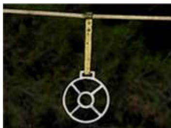
Slika 8. Prstenac (meta)