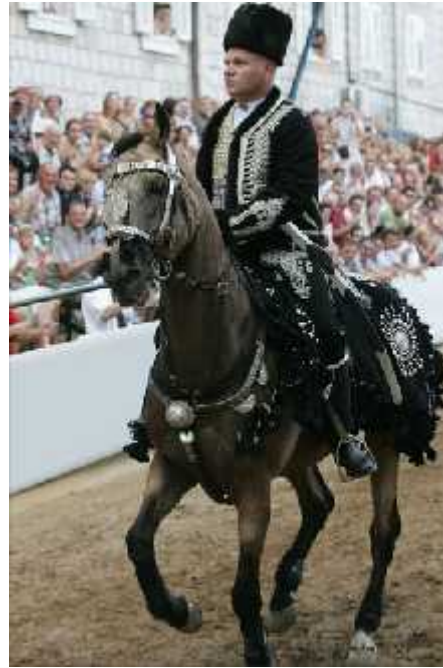
Slika 20. Alaj- auš

➤ Alkarski momci – nose starinsku bogatu narodnu nošnju i naoružani su starinskim oružjem (sl. 17, sl. 22). Njihova se odora sastoji od: