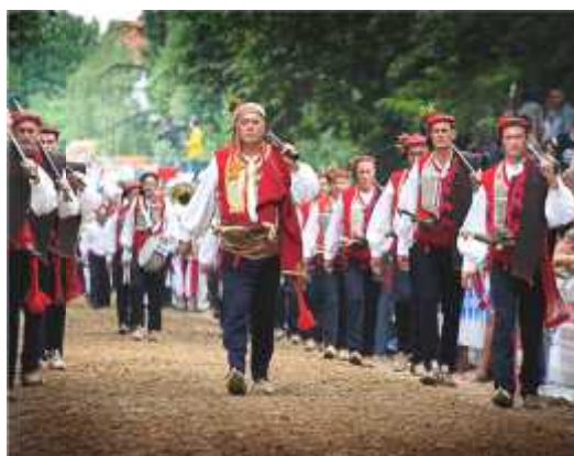
Slika 17. Alkarski momci

Alkarski momak je pješak u alkarskoj povorci koji je obućen u bogatu narodnu nošnju, a na ramenu nosi pušku kremenjaču. On je alkarov pomagač i dužnost mu je prihvatiti konja i koplje svog alkara nakon svake trke. Alkarski momci su naočiti, stasiti, kršni i plešati ljudi. Oni su predstavnici svih slojeva Cetinske krajine. U izbor alkarskih momaka ulaze oni koji vanjskim izgledom, visinom i izrazom lica, dostojanstvenim držanjem i odrješitošću najbolje odgovaraju zahtjevima momaka za dužnosti, imaju razvijen osjećaj za koračanje u taktu glazbe te odgovorno ispunjavaju program priprema za momke. Izbor alkarskih momaka vrši se svake godine, izabire ih Arambaša, a konačni sastav momaka utvrđuje vojvoda. Pri izboru momaka mora se imati u vidu i zastupljenost raznih područja Cetinske krajine (sl. 17, sl. 22).