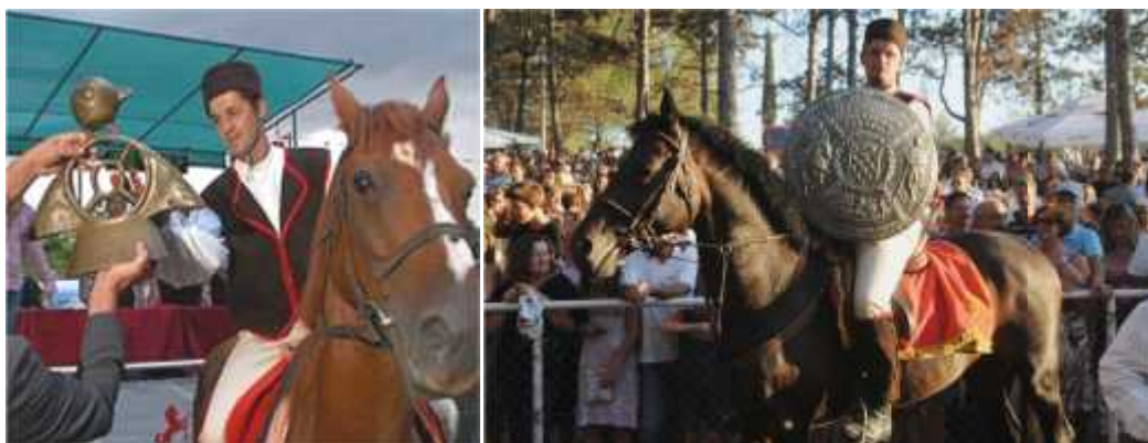
Slika 3. Slavodobitnici s prijelaznim nagradama („Ptica – Prstenac“ i „Štitić“)

Nakon nagrade za prvu Trku, razbijene bukalete, idućih godina dodjeljivali su se pehari, a zatim je 1985. ustanovljena prijelazna nagrada „Ptica – Prstenac“, izlivena u bronci, rad akademskog kipara Josipa Diminića iz Labina. Diminić je izradio i monumentalnu kamenu skulpturu „Ptica prstenac“ koja je postavljena na barbanski trg 2002. Godine 1998. uvedena je i nova nagrada za slavođobitnika, a od 2009. pobjedniku se dodjeljuje i bakreni „Prijelazni štitić predsjednika Republike Hrvatske za slavođobitnika Trke na prstenac“, rad akademskog kipara Alije Rešića (sl. 3).