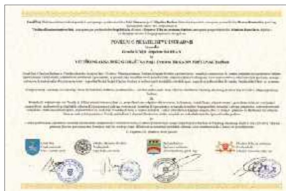
Slika 24. Povelja o prijateljstvu i suradnji Grada Sinja i Općine Barban te Viteškog alkarskog društva Sinj i Društva Trka na prstenac Barban

O uvanju i nastavku tradicije održavanja ovih dviju konji kih igara svakako pridonose i ina ice koje su se razvile po njihovu uzoru. Tako su se razvile mototrke i morske trke na prstenac, dje je alke i razvojem suvremene tehnologije robotrke i roboti ka alka.