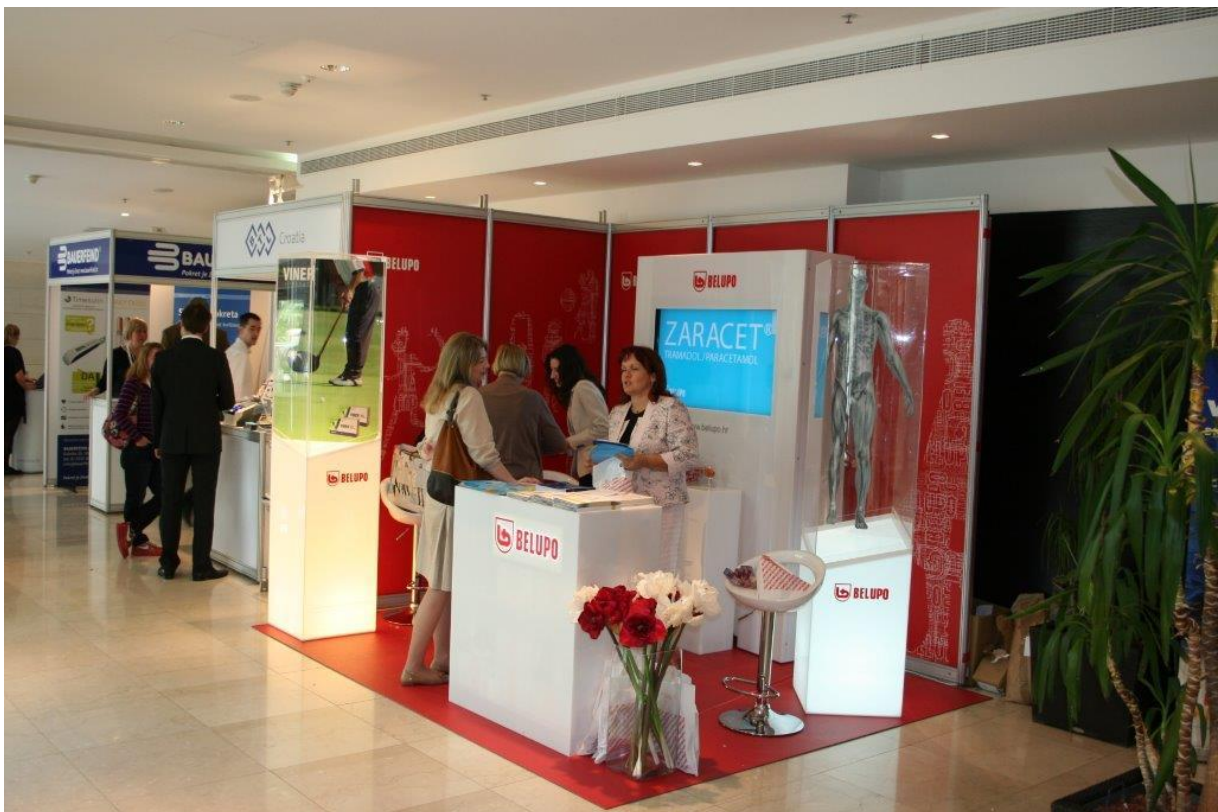
Slika 9. Belupov pult 2