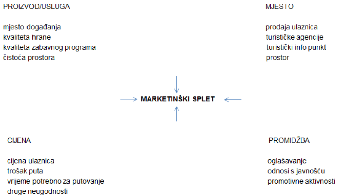
Slika 3. Marketinški splet

Izvor: Van Der Wagen, Lynn. Carlos, Brenda. 2008. Event Management – Upravljanje događanjima. Mate d.o.o. Zagreb, str. 73