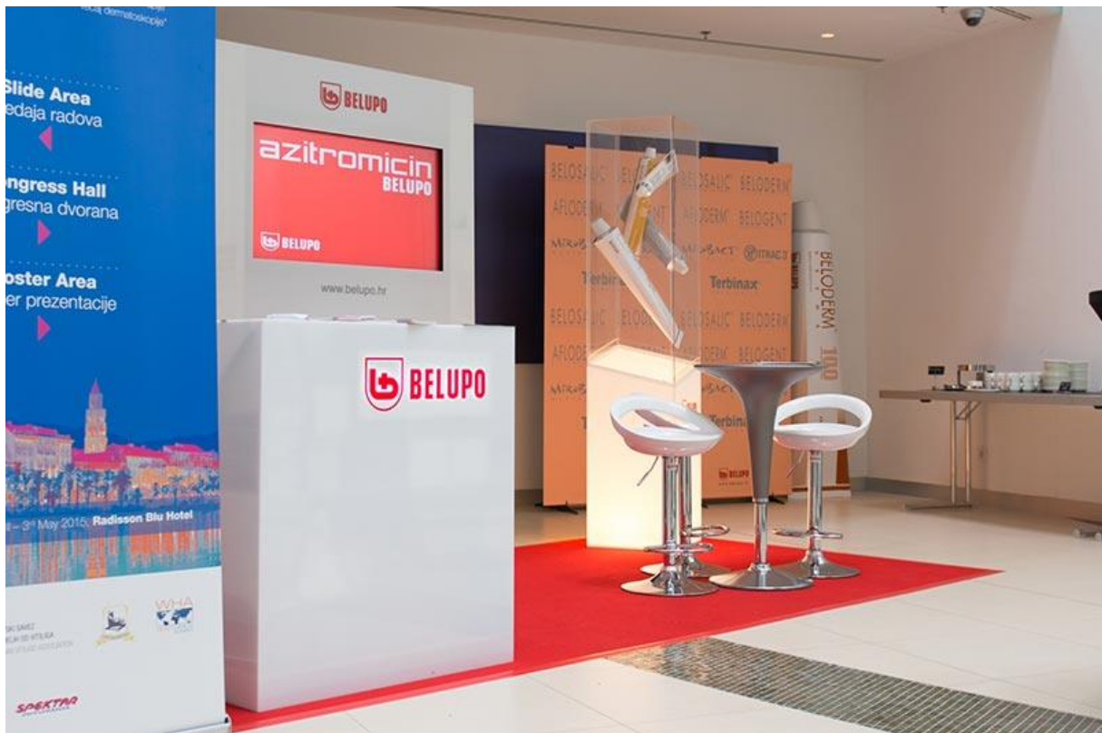
Slika 8. Belupov pult 1