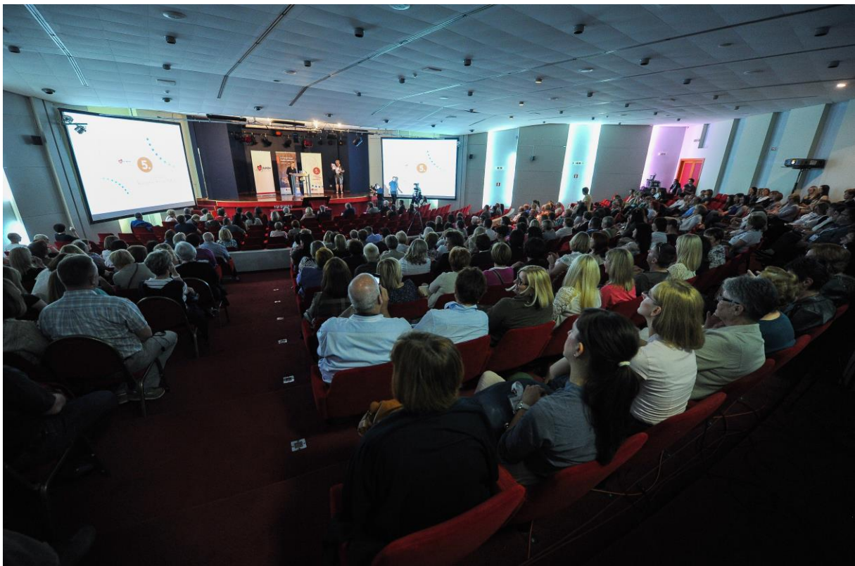
Slika 7. Predavanje