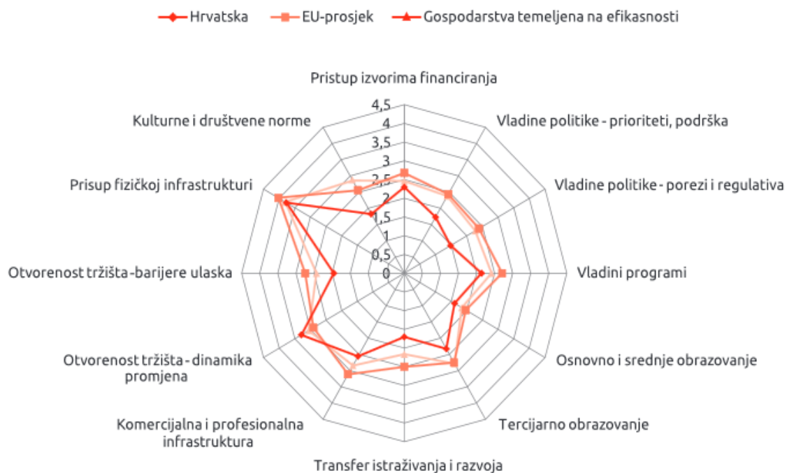
Slika 1. Usporedba poduzetničkog ekosustava u Hrvatskoj s onim na razini Europske unije i gospodarstava koja se temelje na efikasnosti u 2016. godini

Izvor: Singer, S. et al. (2017.) Što čini Hrvatsku (ne)poduzetničkom zemljom? Dostupno na: http://www.cepor.hr/wp-content/uploads/2017/05/GEM2016-FINAL-za-web.pdf (03.06.2017.), str. 56.