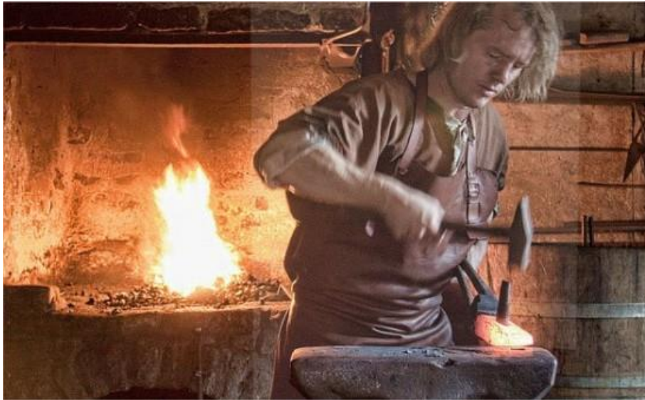
Slika 6. Primjer konceptualne ilustracije holograma 2