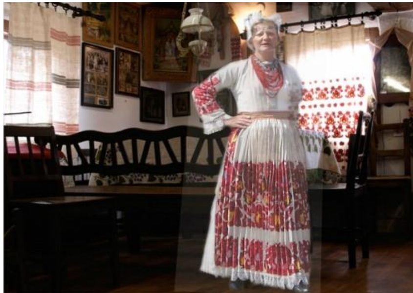
Slika 5. Primjer konceptualne ilustracije holograma 1