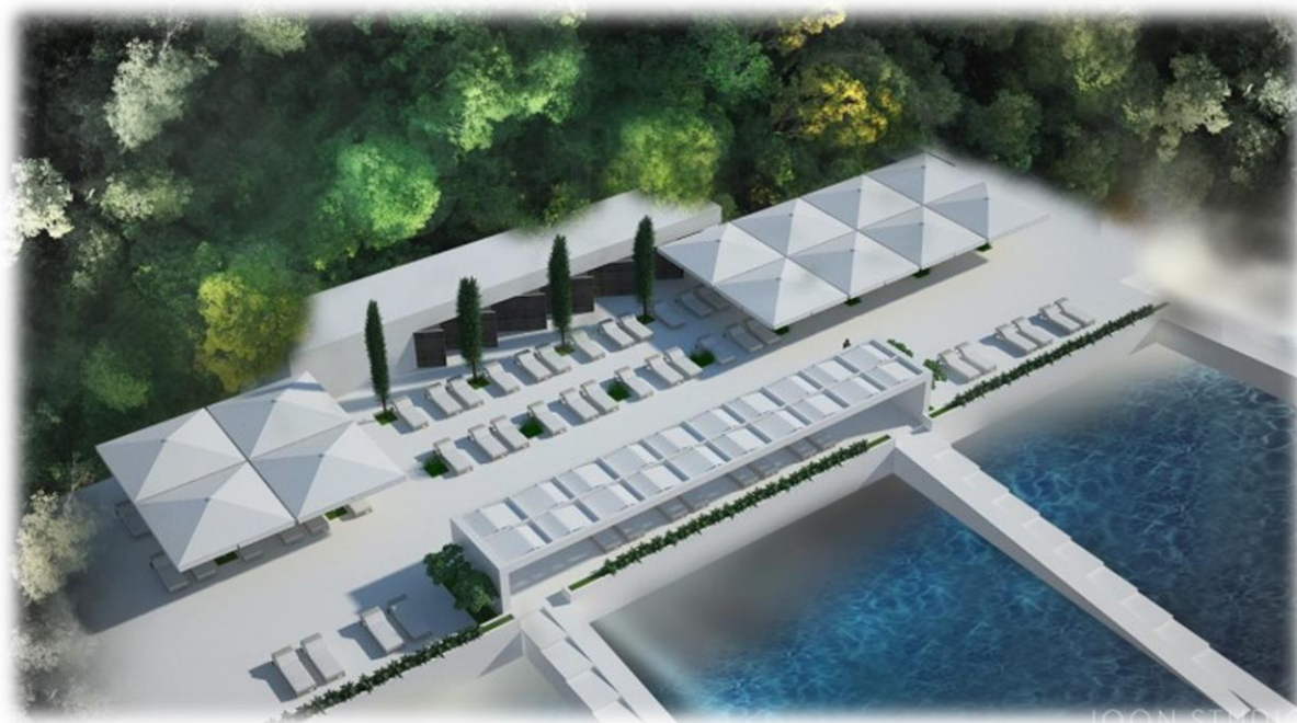
Slika 4. Vizualizacija plaže Bolnica 1