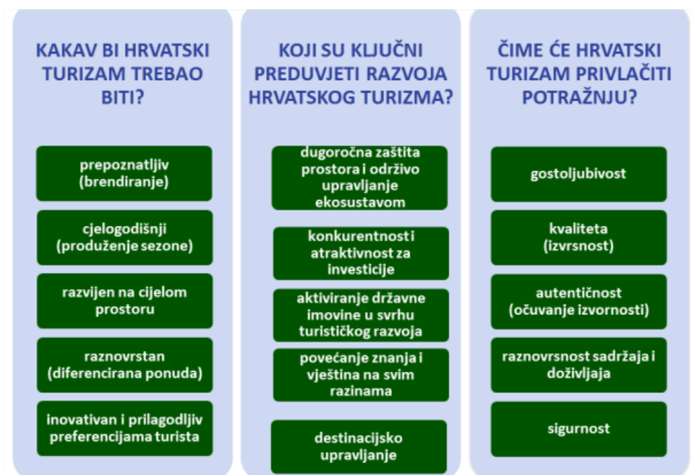
Slika 2. Vizija razvoja turizma RH do 2020.