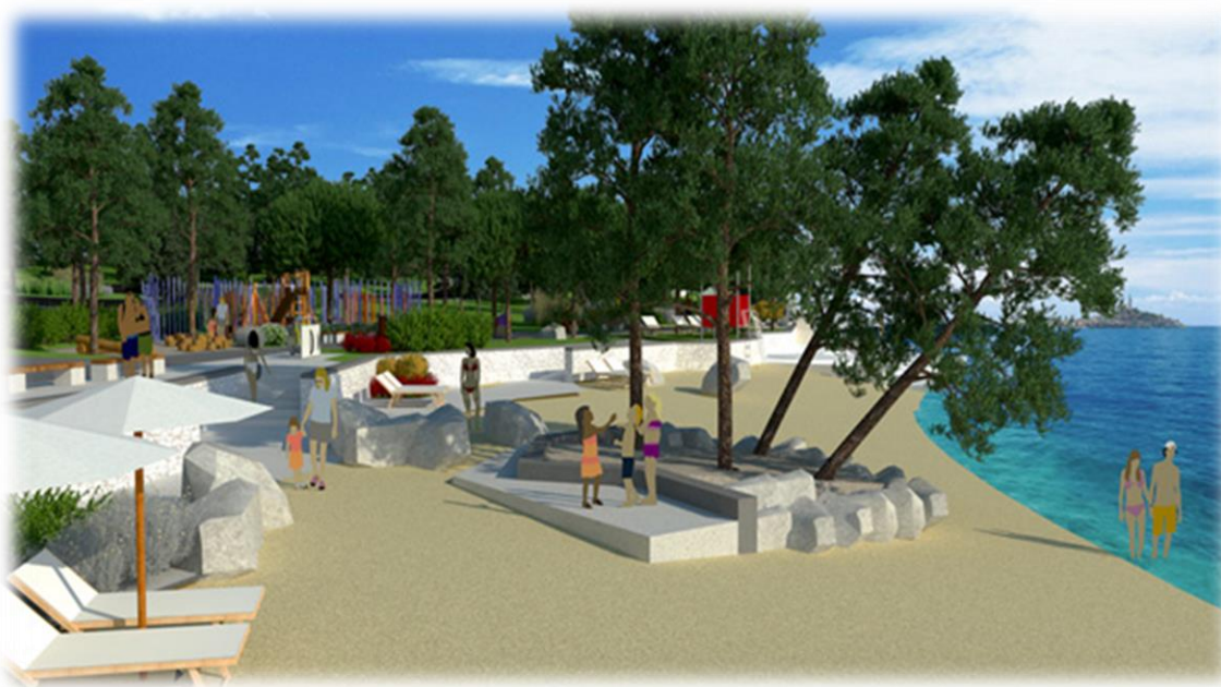
Slika 3. Prikaz uređene plaže Val de lessa