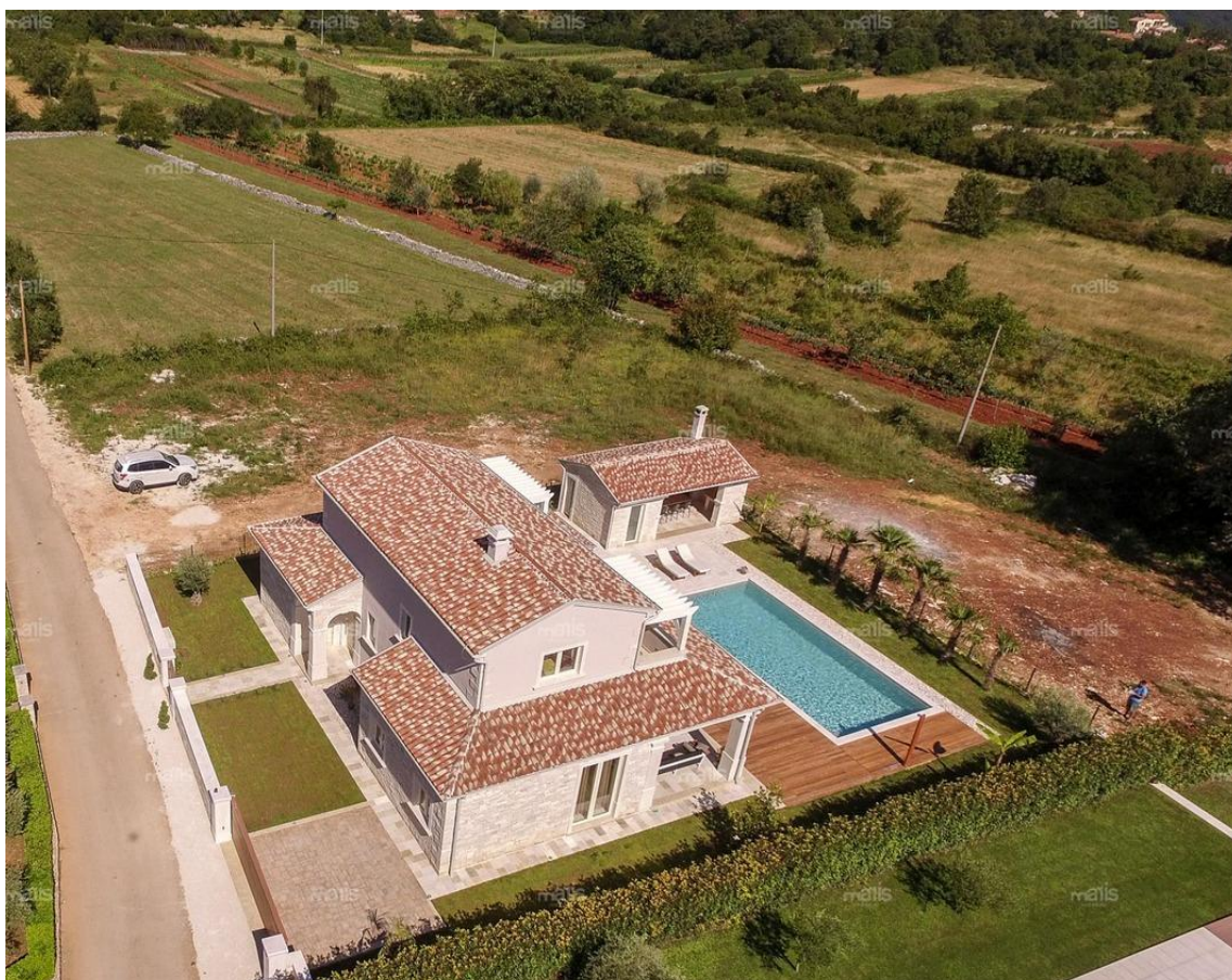
Slika 6. prikazuje tipičan primjer luksuzne vile u središnjem dijelu istarskog poluotoka koja ima sve potrebne karakteristike kako bi u kombinaciji sa upoznavanjem starih seoskih

buke, očuvani okoliš, komunikacija s domaćinima, domaća hrana i upoznavanje seoskih poslova. Ovakav način turizma mogao bi za Hrvatsku biti adut u smislu luksuznog turizma na nov način. Ako se postavi pitanje zašto na nov način kada već postoji Ferien auf dem Bauernhof u Njemačkoj i Austriji, Vacances a la Ferme u Francuskoj te Farmhouse holiday u Engleskoj? Odgovor je jednostavan i leži u činjenici različitosti tradicije svake države i njezine ruralne kulture. 72 Naime, ono što je karakteristično za engleski ruralni turizam ne mora nužno značiti primjenjivost u hrvatskom i obrnuto. Mogućnosti ruralnog turizma Istre kao luksuznog oblika turizma leže u činjenicama kako seljačka turistička gospodarstva na luksuzan način nude komforni smještaj turistima, mir i izolaciju unutar ograđenog ili pomalo nedostupnog vanjskog prostora za druge ljude, autohtoni izgled kuća u kombinaciji sa najsuvremenijom opremljenosti u smislu tehnike i kućanskih aparata, povratak prirodi, mogućnost upoznavanja s lokalnom kulturom i starim poslovima i sl., a sve to bez nužnosti gradnje novih smještajnih kapaciteta, već samo korištenjem onih postojećih. (Sl. 6.)