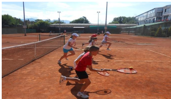
Slika 7. Sat sportskog tjelesnog vježbanja tenisa

Učlanjivanje u sportske klubove najčešće provodi roditelj ako djeca iskažu interes za neki sport, a ponekad roditelji učlanjenje provede autonomno. Ovakva vrsta tjelesnog vježbanja u pravilu se provodi s djecom starije dobne skupine. Struktura sata i obilježja sata su ista kao i kod sata tjelesne i zdravstvene kulture. Sadržaji su usuglašeni s potrebama pojedinog programa npr. skijanja, tenisa i sl. Trajanje sata može trajati četrdeset i pet minuta (npr. sportska gimnastika) ili šezdeset minuta (npr. tenis, plivanje i sl.).