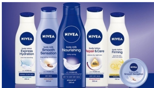
Slika 9: Nivea proizvodi za njegu tijela