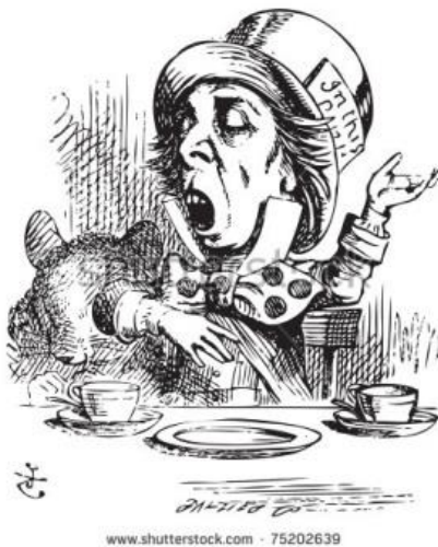
Slika 5. Klobučar

Klobučar se odlikuje prebacivanjem s mjesta na stol u bilo kojem trenutku, stvarajući osobne primjedbe, pitajući zagonetke i recitirajući besmisleni poeziju. Alisa je s njim boravila na čajanci, na kojoj joj je bilo strašno dosadno. Mnogi pisci misle da je Klobučar referenca na Theophilusa Cartera, trgovca namještaja poznatog u Oxfordu. Međutim, malo je vjerojatno da je Carter bio model Hattera, jer nema dokaza da je Carroll ikada pozvao Tenniela u Oxford za bilo koju svrhu. Klobučar, Ožujski Zec i Puh Spavalica su otuđeni od samih sebe, jednolični, izgubljeni, beživotni. Ilustracija Sir John Tenniela pokazuje Ožujskom Zecu slamku na glavi, što je uobičajeni način prikazivanja ludila u vrijeme Viktoriana.