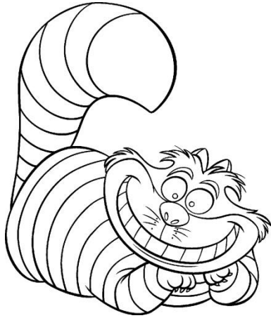
Slika 4. Cerigradska Mačka

Klobučar se odlikuje prebacivanjem s mjesta na stol u bilo kojem trenutku, stvarajući osobne primjedbe, pitajući zagonetke i recitirajući besmisleni poeziju. Alisa je s njim boravila na čajanci, na kojoj joj je bilo strašno dosadno. Mnogi pisci misle da je Klobučar referenca na Theophilusa Cartera, trgovca namještaja poznatog u Oxfordu. Međutim, malo je vjerojatno da je Carter bio model Hattera, jer nema dokaza da je Carroll ikada pozvao Tenniela u Oxford za bilo koju svrhu. Klobučar, Ožujski Zec i Puh Spavalica su otuđeni od samih sebe, jednolični, izgubljeni, beživotni. Ilustracija Sir John Tenniela pokazuje Ožujskom Zecu slamku na glavi, što je uobičajeni način prikazivanja ludila u vrijeme Viktoriana.