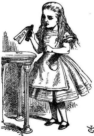
Slika 1. Alisa ( https://goo.gl/UUgb2P , preuzeto: 15. studenog 2017.)

U ovoj priči glavni lik jest dijete , kao i u svakoj priči i u ovoj nailazimo na glavne i sporedne likove. Glavni lik u ovoj priči je i sama Alisa kojoj se događaju neobične zgode i nezgode s raznim bićima i stvorenjima. Ona je sedmogodišnja djevojčica koja je puna mašte, radoznala, ponekad nestrpljiva, ljutita, a s druge strane nježna, pažljiva, dobra i plemenita. Sposobna je da suosjeća s drugima, uporna, ponosna, te puna ljubavi. Također, njezin lik je baziran na djevojčici koja postoji, a zove se Alice Liddell.