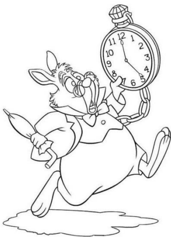
Slika 2. Bijeli Zec

Prema Visinko (2001) unutarnje vibracije Alisine zebnje možemo čitati u svemu što se pojavljuje kao buka (zečji glas i naredbe „Moramo spaliti kuću!“), a Alisino iščekivanje, neizvjesnost, strah možemo čitati tišinom koja se pojavljuje između bučnih događaja.