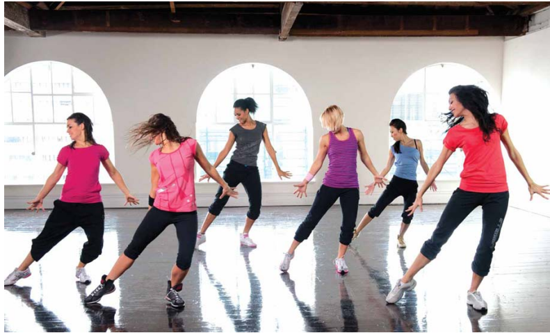
Slika 3.8. Aerobik različitih plesnih stilova,[8]