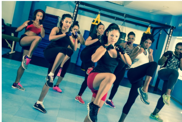
Slika 3.9. Aerobik s elementima borilačkih sportova,[9]

Vrsta treninga na bazi elemenata borilačkih sportova i aerobika uz pratnju glazbe.