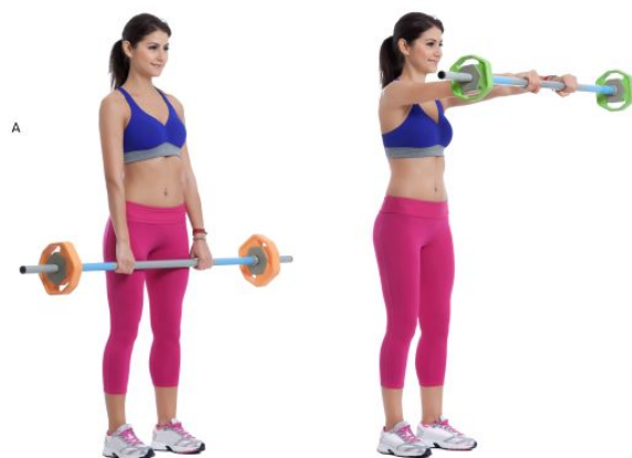
Slika 3.11. Šipke s utezima,[11]

Trening u kojem se koriste šipke i utezi čija se težina prilagođava sposobnostima vježbača.