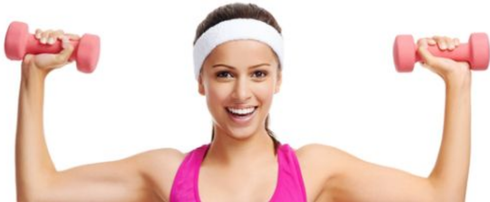
Slika 3.10. Trening s bučicama,[10]

Bučice su dio opreme koja se koristi u treningu dizanja utega i predstavljaju tip slobodnih utega. Trening je kružnoga tipa, a u svakom krugu je obuhvaćeno cijelo tijelo.