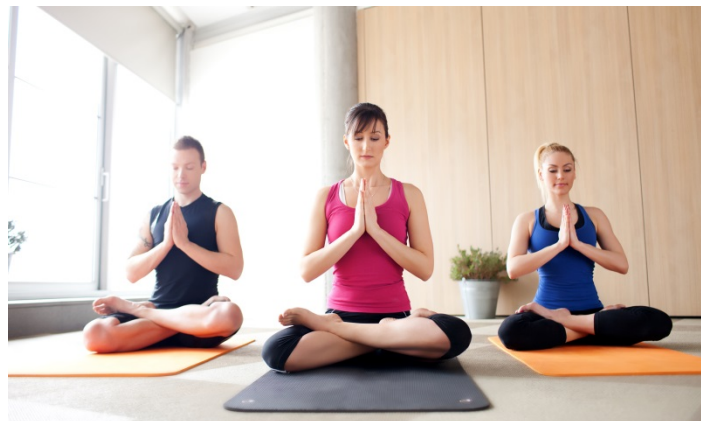
Slika 3.13. Yoga.[13]

Trening koji označava sustavan pristup unutar religijskih tradicija. Sam cilj yoge predstavlja jedinstvo tijela, srca i uma, tj. harmoniju motoričkih radnji, emocija i misli.