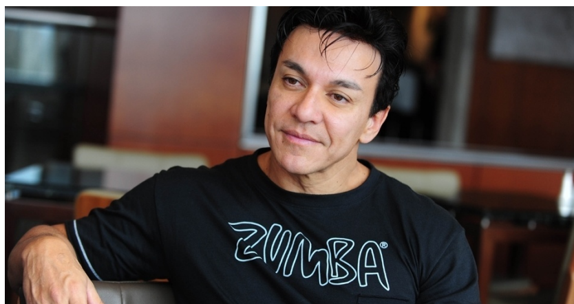
Slika 3.5. Beto Perez,[5]

Kolumbijac Alberto Perez 90-tih godina 20. st. osmišljava Zumbu – grupni plesni fitness program prije svega karakteriziran glazbom i pokretima latino-američkih plesova. Ljudi diljem Amerike vježbaju Zumbu već 20 godina te je već godinama rasprostranjena po različitim kontinentima.