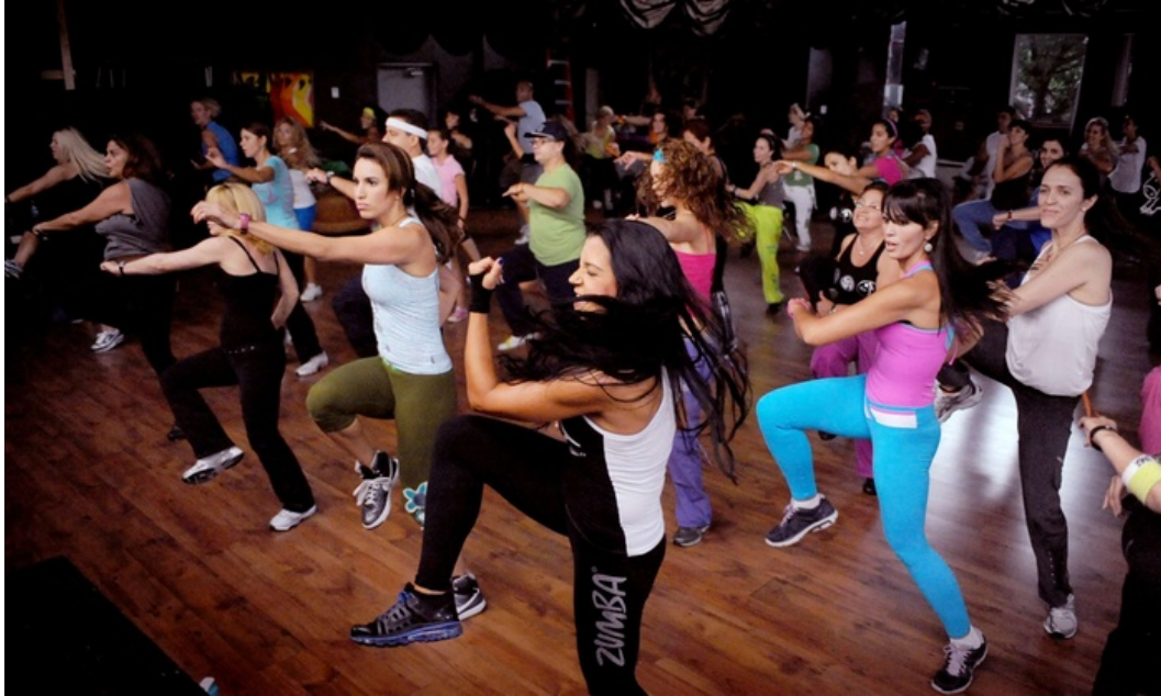
Slika 4.3. Sat Zumba fitnessa,[16]

modificiraju kako bi u određenim intervalima više opteretili određene mišićne skupine. Sve se to događa, a da vježbači nisu ni svjesni da vježbaju. Atmosfera je motivirajuća i zabavna. Nakon glavnog dijela ide "cool down" (smirivanje intenziteta) ili vježbe snage kao u aerobiku, a za kraj slijedi istežanje.