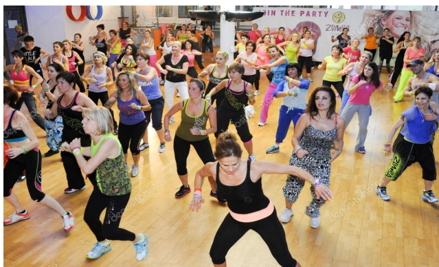
Slika 4.1. Zumba fitness,[14]