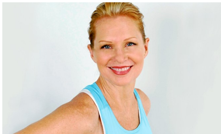
Slika 3.3. Gin Miller,[3]

Gin Miller je 80-tih godina 20. st. osmislila vježbanje na step klupici tzv. "Step aerobik" koji je gotovo 20 godina bio jedan od najpopularnijih oblika grupnog fitnessa.