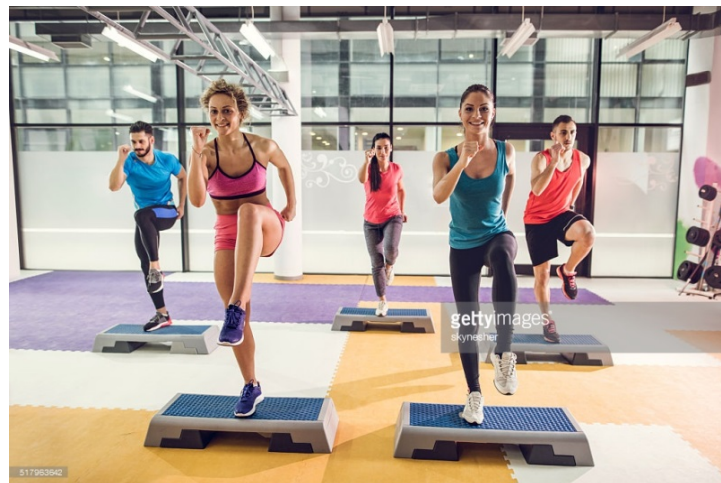
Slika 3.7. Step aerobik,[7]

Vrsta aerobika predstavlja aerobni trening u kojem se upotrebljava steper, na koji se tijekom treninga vježbači penju i silaze, radeći pri tome koreografirane pokrete uz pratnju muzike koja daje ritam.