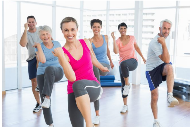
Slika 3.6. Klasični hi/lo aerobik,[6]