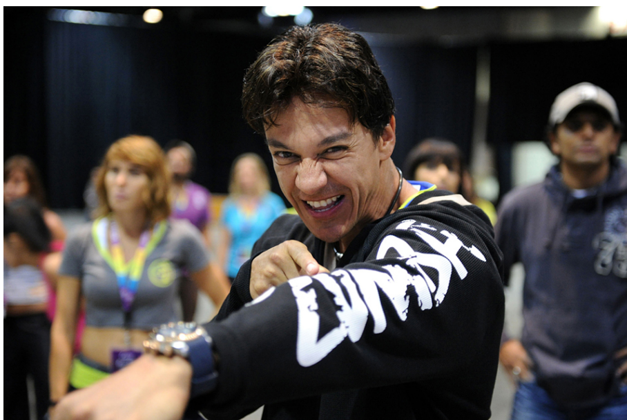
Slika 4.2. Beto Perez. Osnivač Zumba fitnessa,[15]