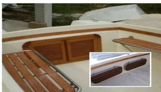
Slika 4: Klupice na brodici