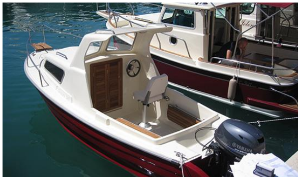
Slika 3: Model Gurges 545