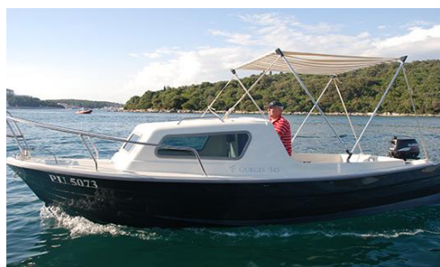
Slika 5: Brodica sa sklopivim krovom