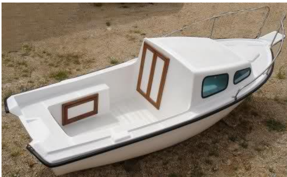
Slika 2: „Istranka“