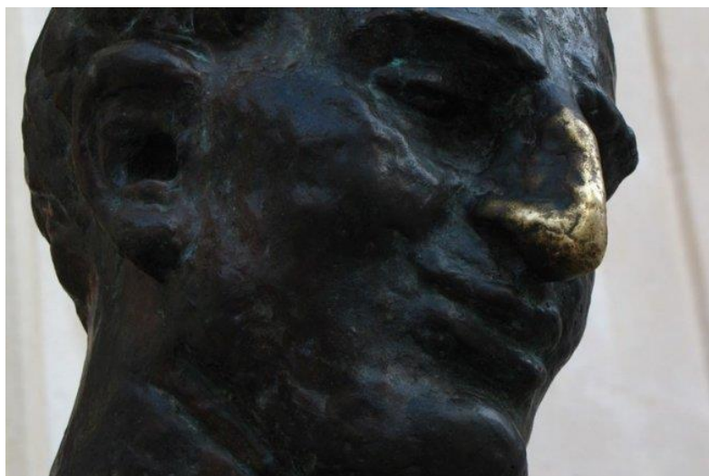
Slika 2. Marin Držić, spomenik Ivana Meštrovića (06. 02. 2018.)

Tezu o značaju vrline u ljudskom životu možemo usporediti s onom Držićevom. U njoj autor govori o odnosu prema dobrim, plemenitim, skromnim i pravim ljudima – „ljudima nazbilj“. Na osnovu toga s pravom možemo pomisliti kako je Držić svoju tezu o postojanju oprečnih odnosno različitih ljudi, pronašao upravo u starim filozofskim koncepcijama.