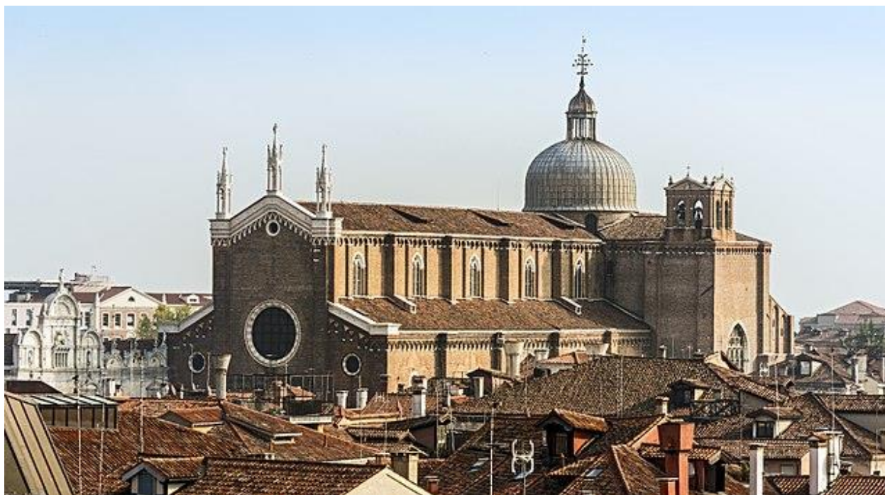
Slika 3. Crkva svetih Ivana i Pavla u Veneciji (02. 10. 2018.)