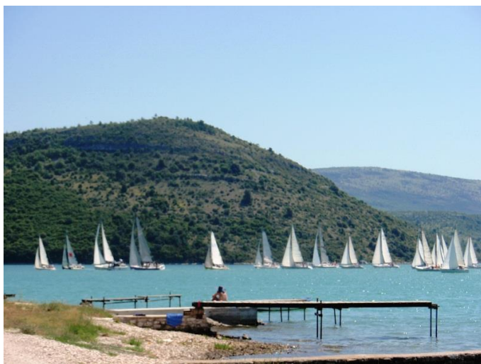
Slika 7. Regata Barbanske rivijere