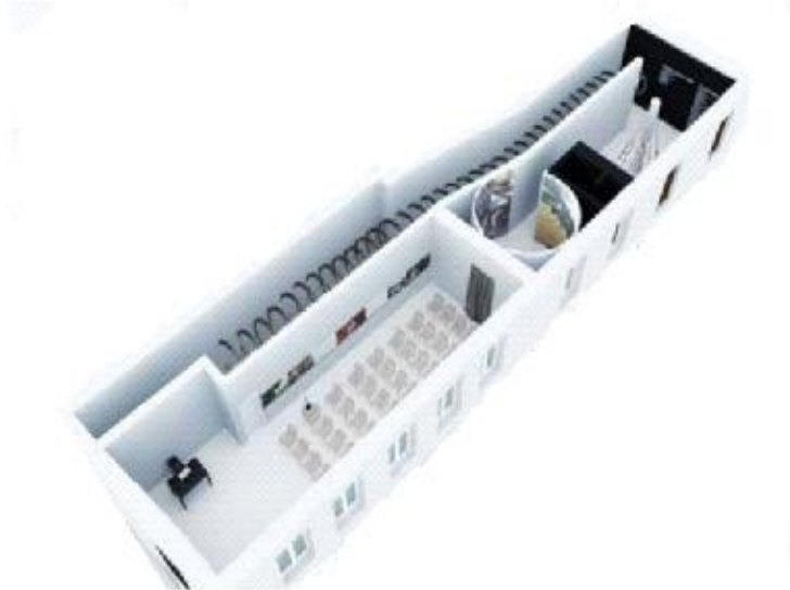
Slika 7. Centar za posjetitelje