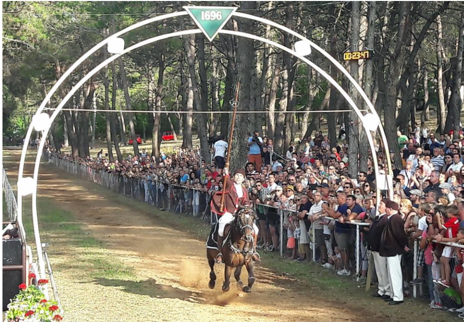
Slika 6. Prikaz Trke na prstenac