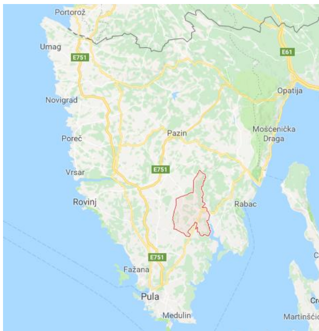
Slika 2. Prikaz položaja općine Barban