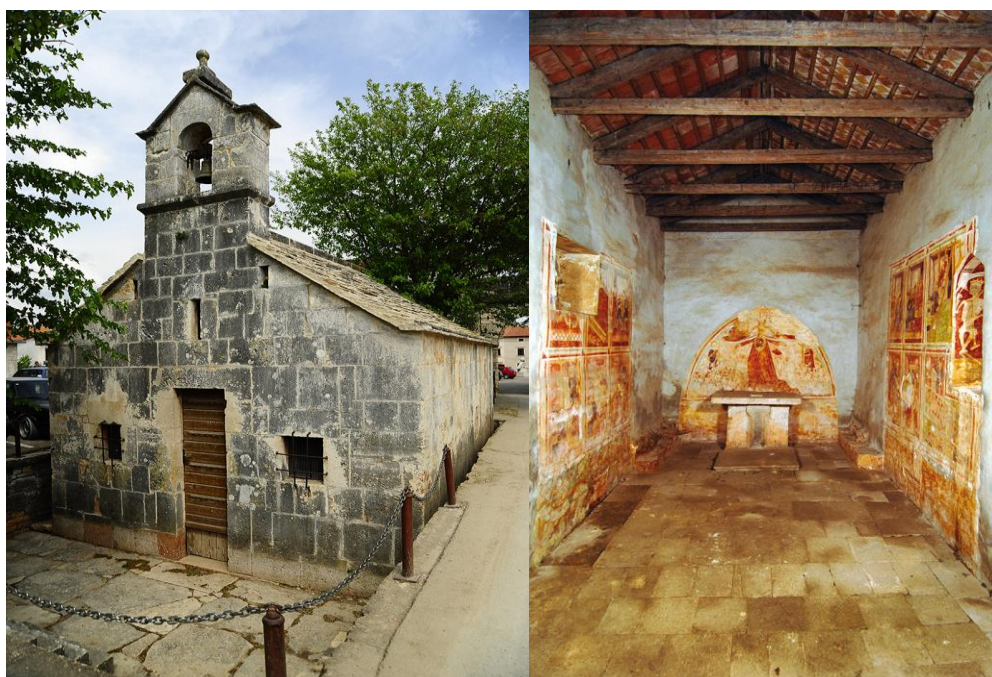
Slika 4. Prikaz crkve sv. Antuna pustinjaka i fresaka