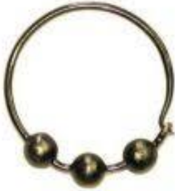
Slika 5. Barbanski rančin