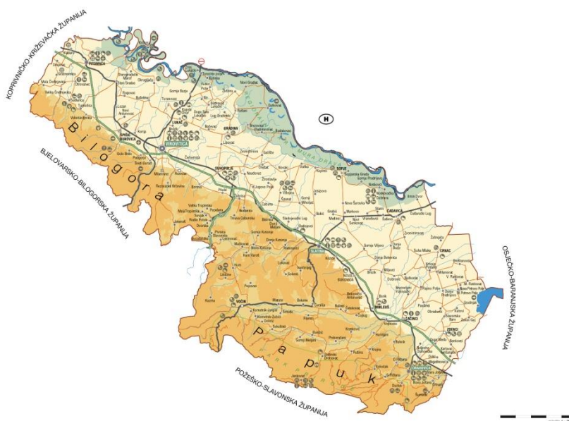
Slika 3 - Reljefni prikaz Virovitičko-podravske županije