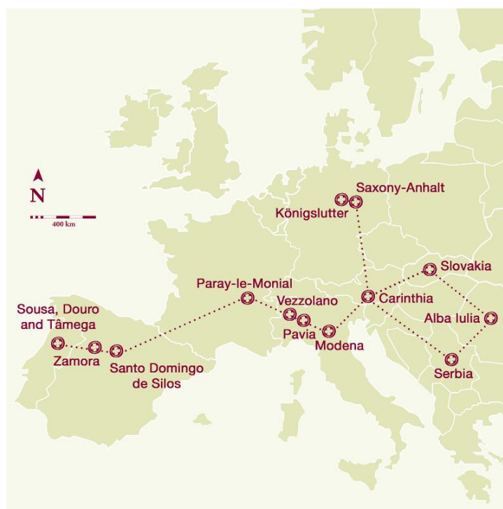
Slika 2 - Mapa Transromanica rute