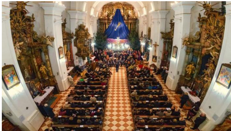
Slika 6 - Unutrašnjost crkve Sv. Roka u Virovitici