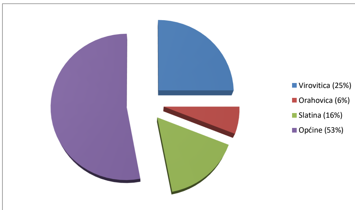
Grafikon 1 - Broj stanovnika Virovitičko-podravske županije