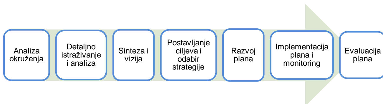
Slika 1 - Model procesa planiranja turizma