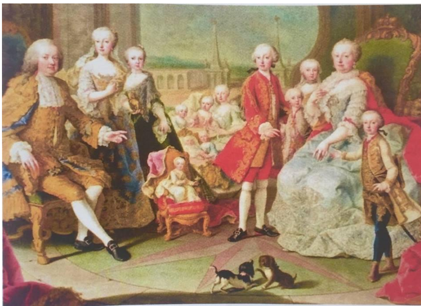
Slika 13. Marija Terezija i njezina obitelj (oko 1754.)

Izvor: Gračanin, Hrvoje, Slavne povijesne ličnosti , Zagreb: Meridijani, 2015., str. 189.