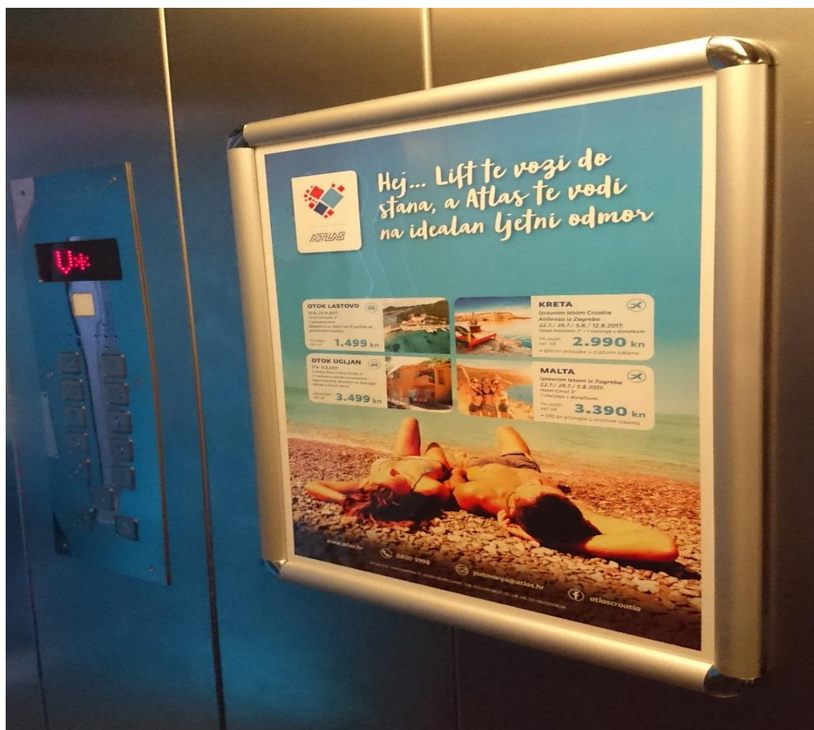
Slika 6: Oglašavanje u dizalu tvrtke Atlas d.d.