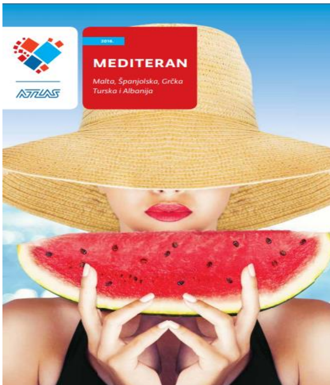
Slika 5: Katalog u pdf-u tvrtke Atlas d.d.