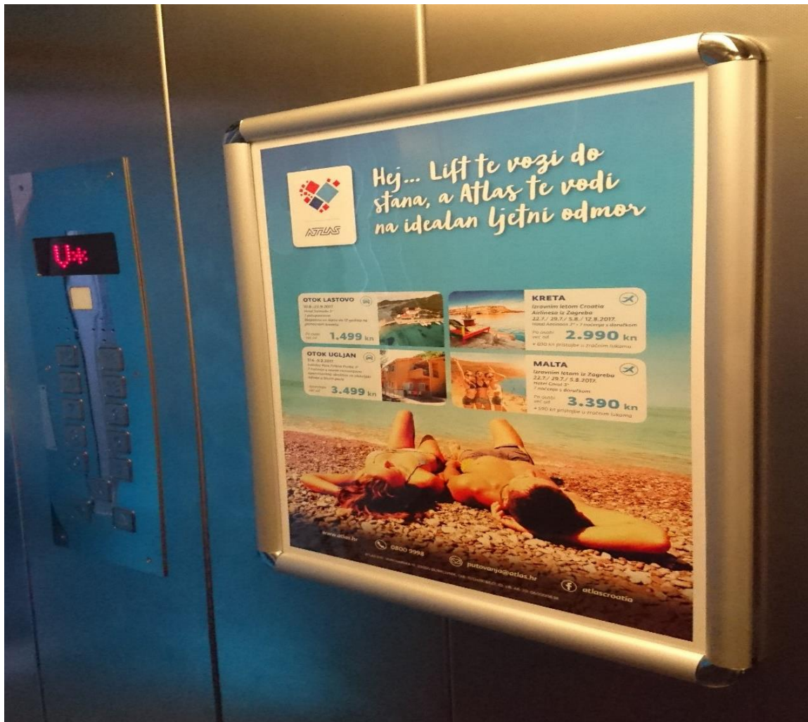
Slika 6: Oglašavanje u dizalu tvrtke Atlas d.d.