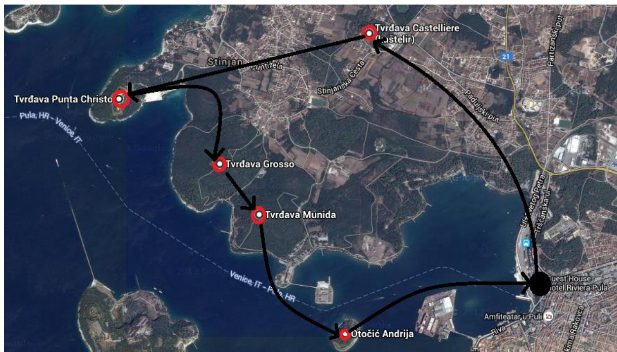
Slika 3. Ključne točke drugoga dana rute Putevima fortifikacija

Kratkom vožnjom autobusom grupa stiže u Štinjan, točnije pred Castelliere, utvrdu ukopanu u zemlju, odakle ih nakon razgledavanja bus vozi do utvrde Punta Christo. Ta uvrda bila je najveća je i najjača obalna utvrda carskog i kraljevskog tvrđavnog topništva Austro-Ugarske monarhije, a danas se u njoj preko ljeta odvijaju brojni društveni, kulturni i zabavni programi, koncerti, festivali, izložbe, programi za djecu i mlade, radionice, predstave i performansi. Zatim se pješice nastavlja prema utvrdi Monte Grosso, s koje se pruža predivan pogled i bitnici Valmaggione. Prije nego što se grupa brodom uputi na otočić Sv. Andrije u razgled utvrde Kaiser Franz i na piknik ručak, posjetiti će utvrdu Munidu. Sljedi povratak u hotel.