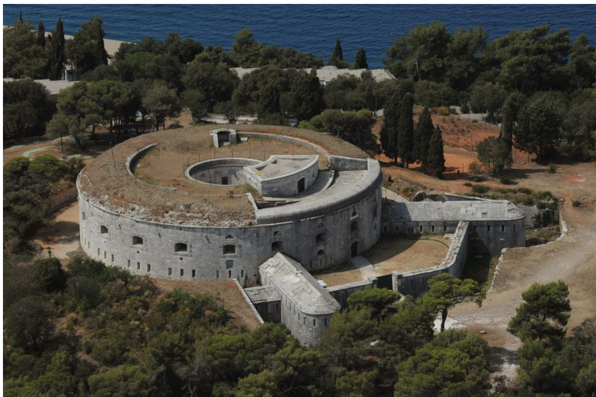
Slika 1. Fort Bourguignon