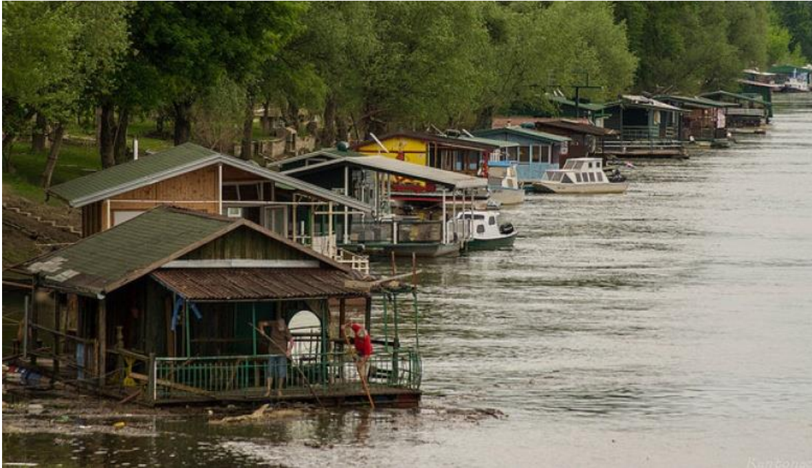
Slika 1. Splavarska ulica u Slavonskom Brodu