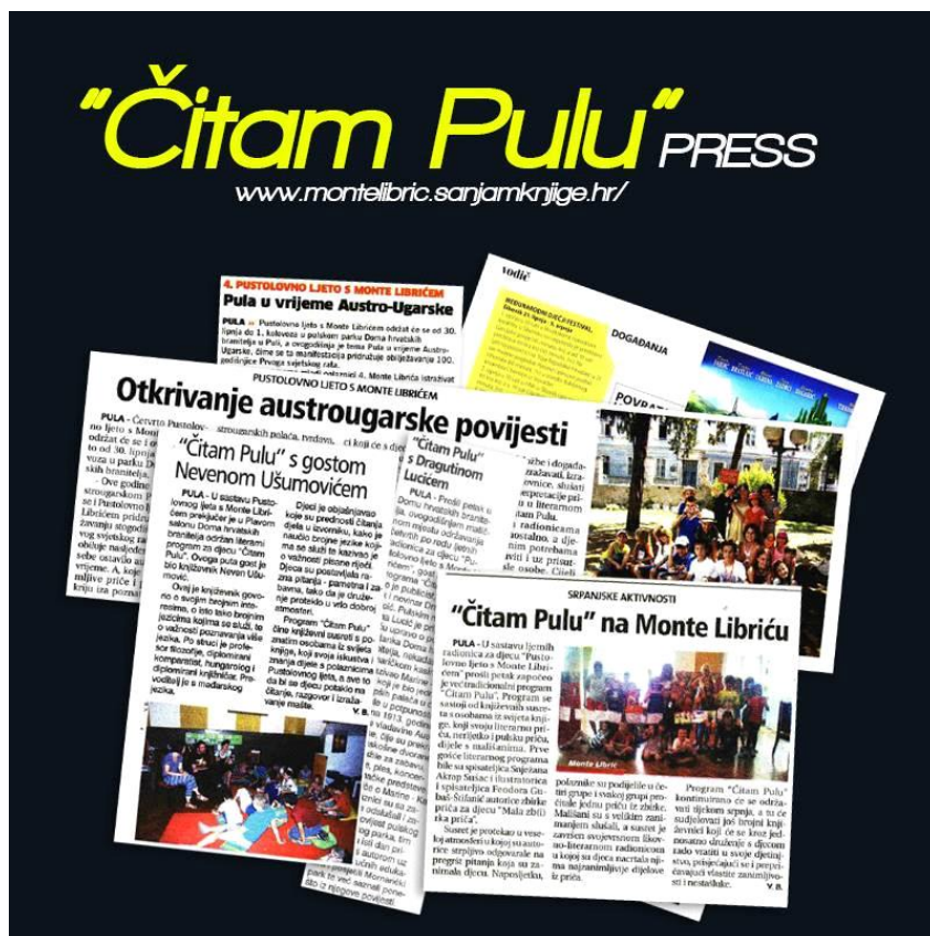
slika 3. članci u novinama o Monte Libriću

Radi kulturnog, društvenog i edukativnog značaja Monte Librić spomenut je u Glasu Istre među kulturnim novostima i za to organizatori nisu morali izdvojiti nikakva sredstva.