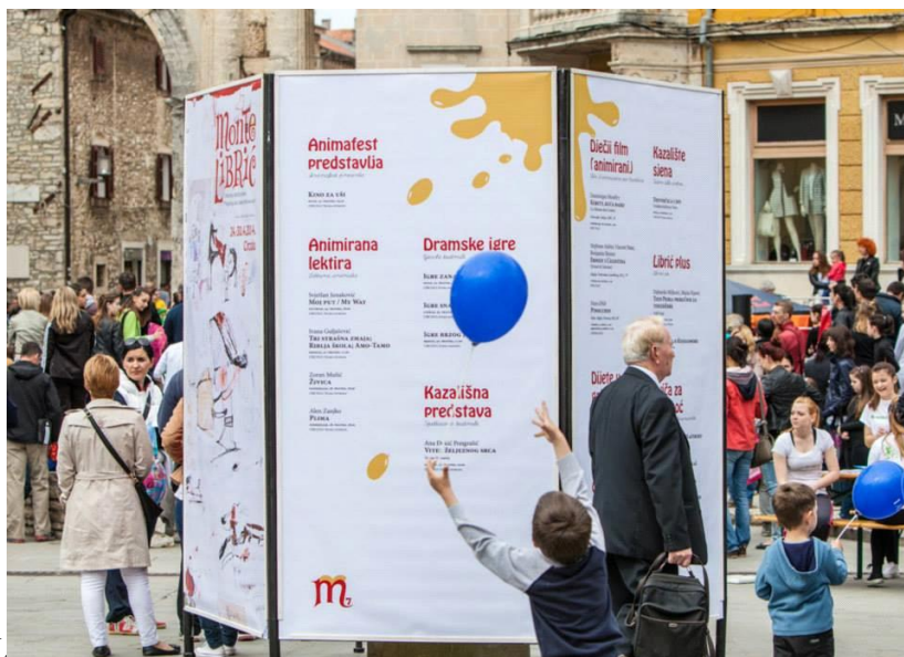
slika 2. plakat-program ML

slike preuzete s Facebook stranice, 19.09.15. 16:07