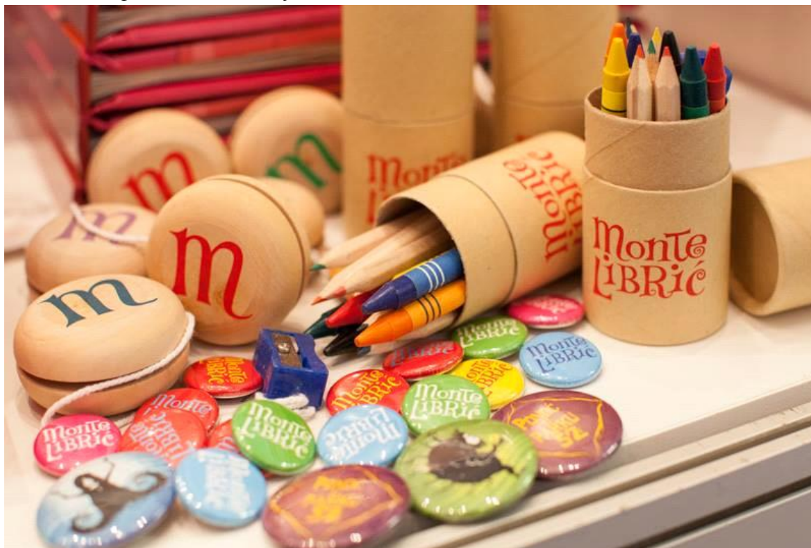
slika 5. neki promotivni materijali Monte Librića

Bedževi imaju na sebi pojedine ilustracije iz knjiga izdanih od strane Monte Librića, a bojice i kutije za olovke naći će primjenu kod školaraca i mlađe djece.