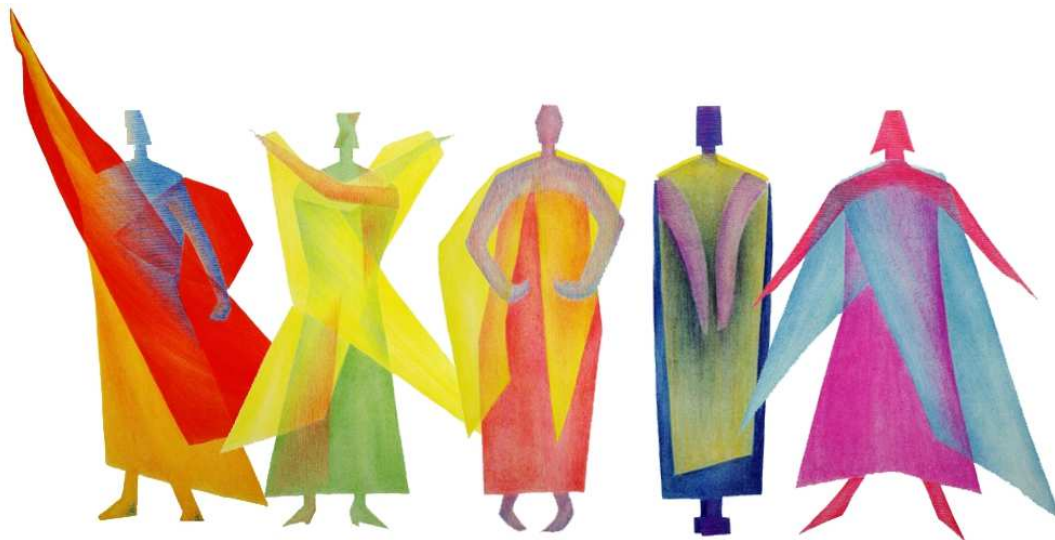
Slika 5. euritmija

Izvor: ( https://centar-rudolf-steiner.com/euritmija/ , pristupljeno: 27. 8. 2018.)