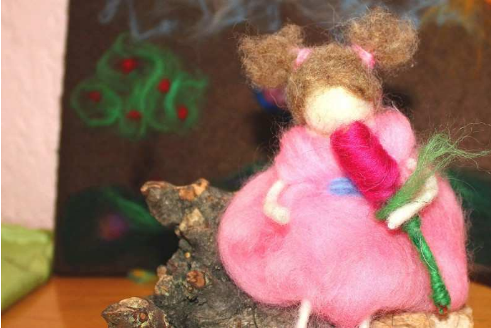
Slika 2. Waldorfska lutka