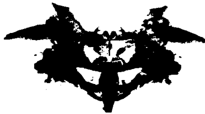
Slika 3: Projekcija Rorschachova testa