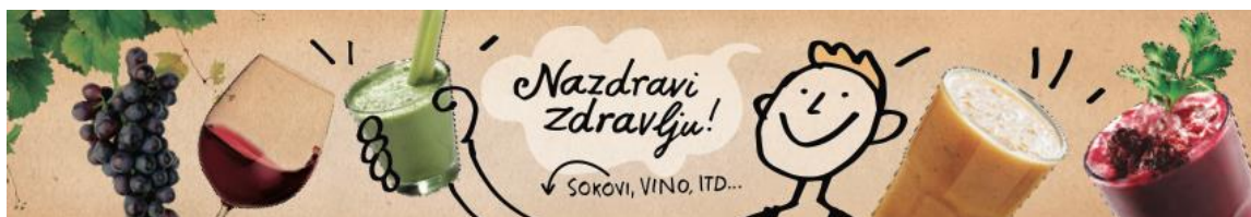
Slika 5. Komunikacija bio&bio trgovina