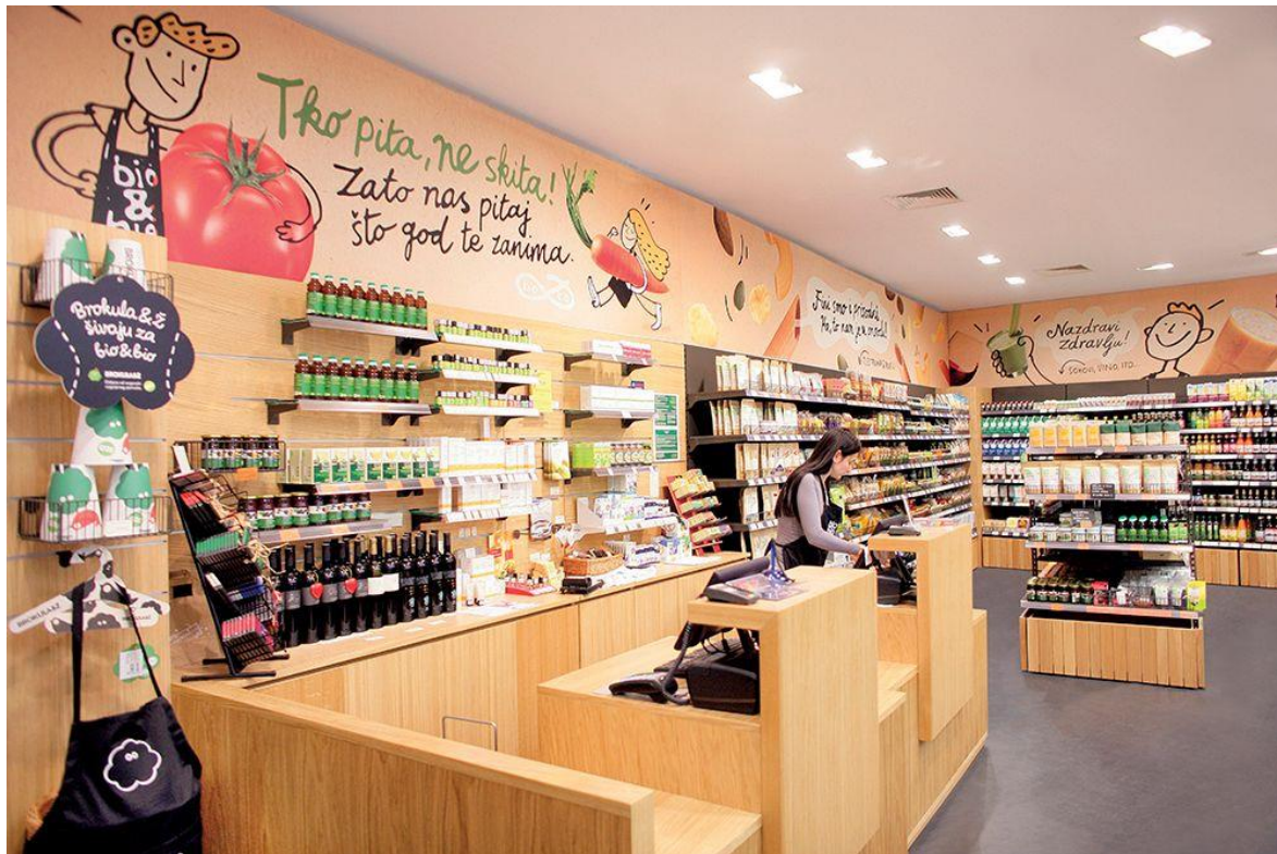
Slika 7. Bio&bio trgovina