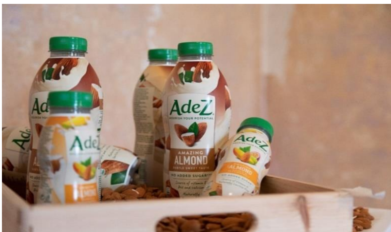
Slika 3. AdeZ