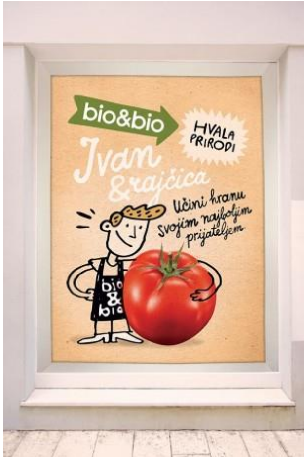
Slika 6. Prodavač i njegovo omiljeno povrće