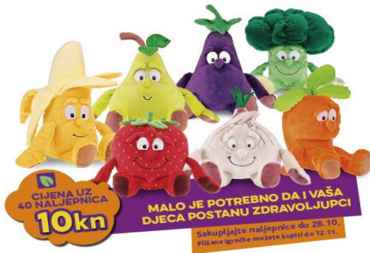
Slika 4. Zdravoljupci