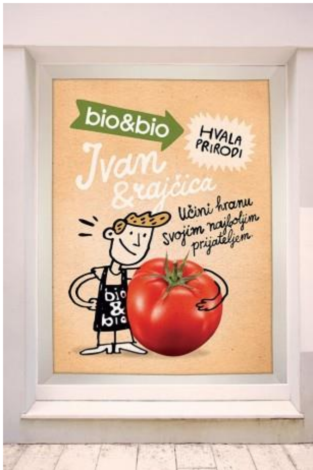
Slika 6. Prodavač i njegovo omiljeno povrće