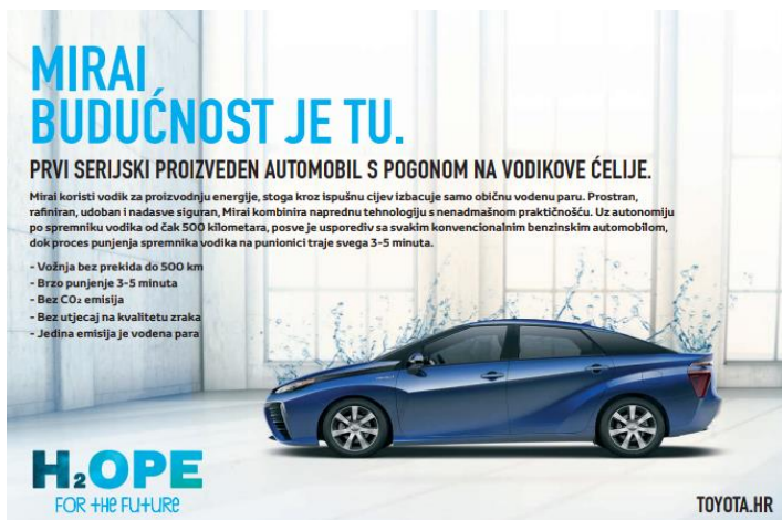
Slika 8. Toyota Mirai