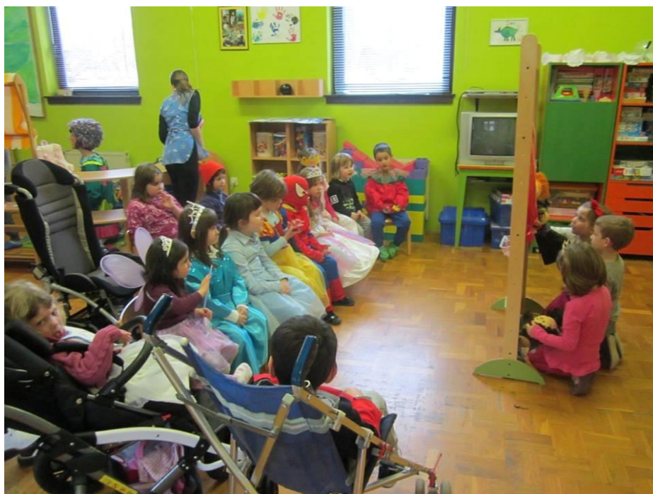
Fotografija 2. Prilagodba prostora