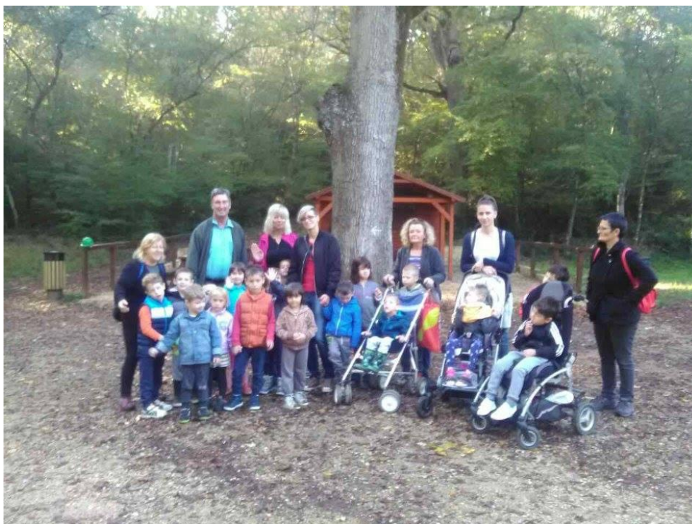
Fotografija 3. Prilagodba aktivnosti