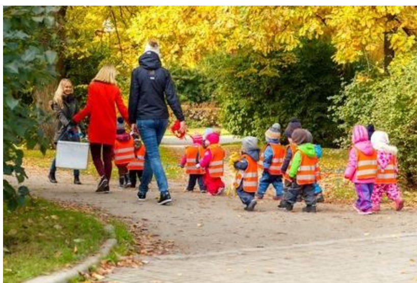
Slika 9. Šetnja prirodom

Šetnja se smatra vrijeme koje dijete provede hodajući na zraku, no nije preporučljivo djecu izlagati lošim vremenskim uvjetima, točnije kada je gusta magla, kada pada jaka kiša ili mokar snijeg te kada su visoke ili niske temperature. Na šetnju se najčešće ide prije podne, a vraća se neposredno prije ručka (Findak, 1995:64). Dužina puta šetnje ovisi o dobi djece te je važno da odgojitelj stalno održava kontakt sa djecom i potiče na promatranje (Findak, 1995).