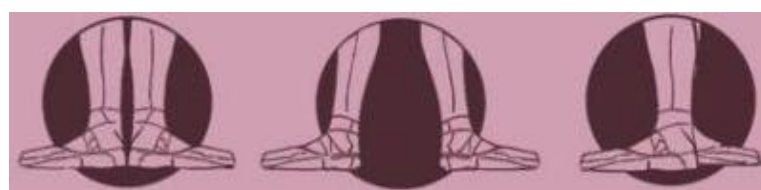
Slika 1. Prve tri pozicije u baletu

U izvođenju baletnih pozicija obično dodajemo i plié - polako savijamo koljena i ravnih se leđa spuštamo u polučučanj.