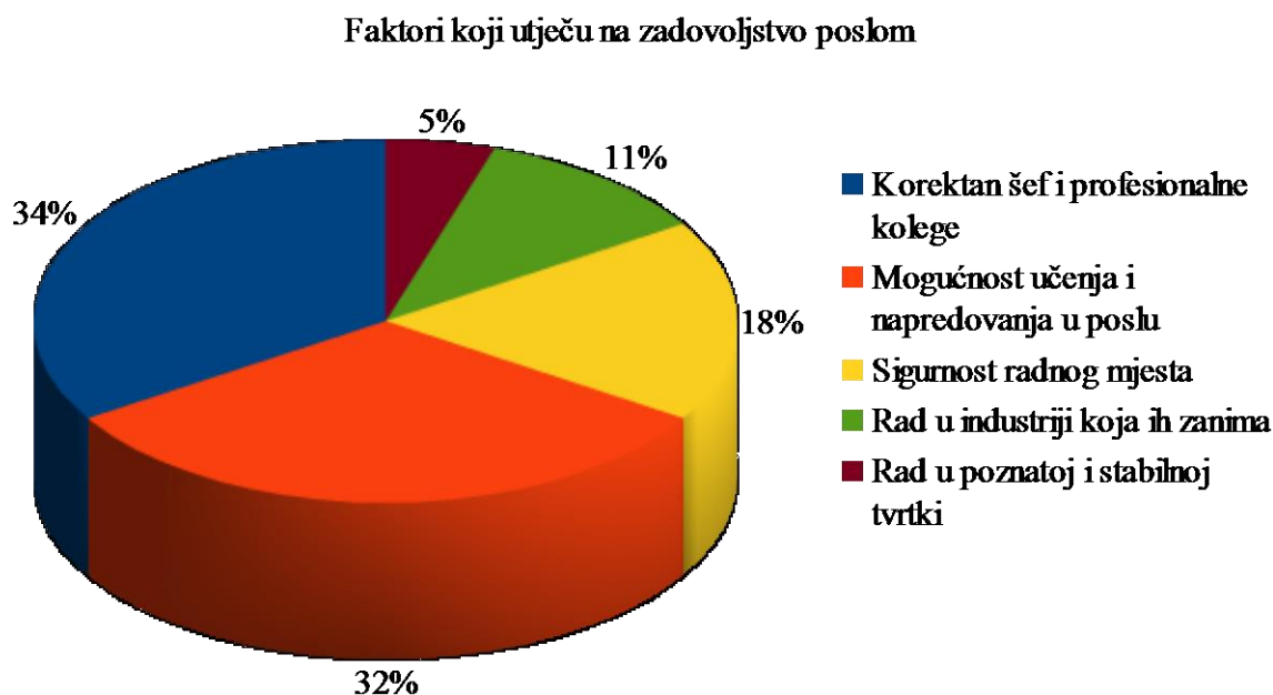
Graf 2. Faktori koji utječu na zadovoljstvo poslom

Treća anketa je istraživala faktore koji utječu na zadovoljstvo poslom (graf 2.). Portal MojPosao proveo je anketu na više od 1000 ispitanika. Iz ankete je vidljivo da je plaća bitan faktor, ali nije i jedini 66 .