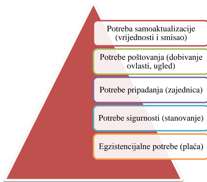
Slika 1. Maslowljeva teorija potreba