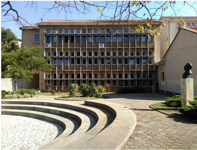
Slika 13. Osnovna škola Silvije Strahimira Kranjčevića Senj