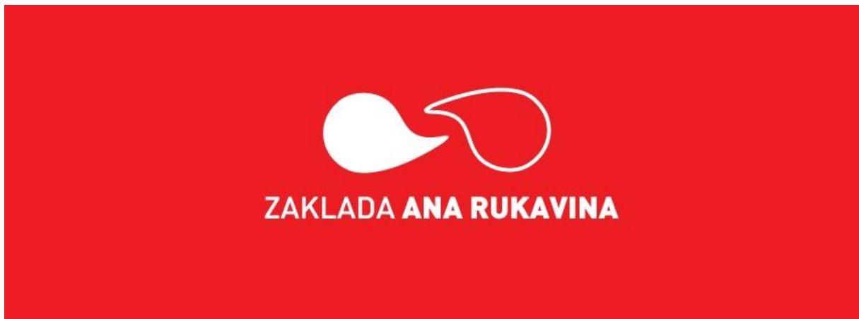
Slika 14. Logo zaklade Ana Rukavina

Izvor: http://www.zaklada-ana-rukavina.hr/ (18.02.2018.)