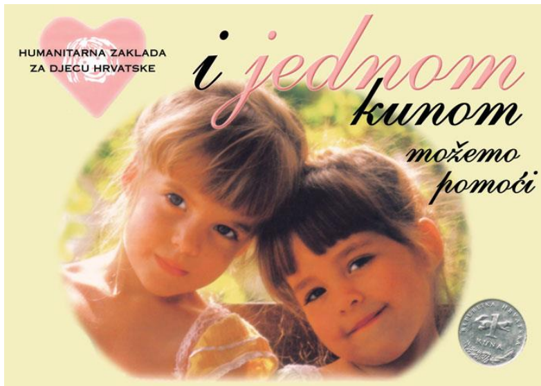
Slika 12. „I jednom kunom možemo pomoći“