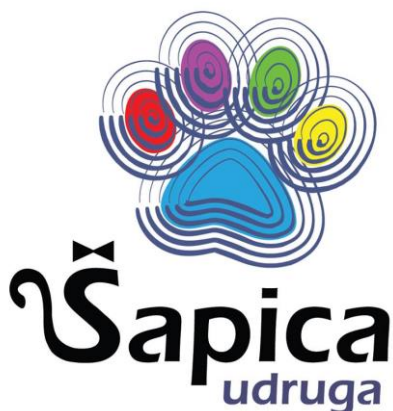
Slika 6. Logo Udruge Šapica

Udruga Šapica je neprofitna nevladina udruga za zaštitu životinja koja je osnovana i registrirana 2006. godine u Zaprešiću. Udrugu je osnovala nekolicina istinskih ljubitelja životinja koji su svojim predanim radom značajno doprinijeli zbrinjavanju pasa i mačaka na području grada Zaprešića i okolice. Osnovana je sa svrhom zbrinjavanja i udomljavanja napuštenih, zlostavljanih i ranjenih životinja, te promicanja njihovih prava. Slika 6. prikazuje logo Udruge Šapica.