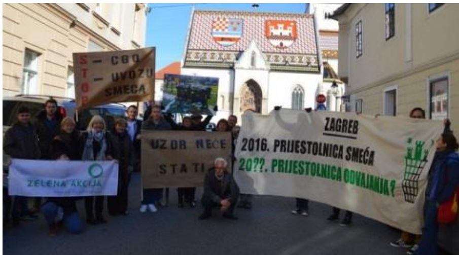
Slika 11. Akcija otpad