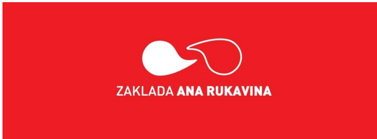
Slika 14. Logo zaklade Ana Rukavina