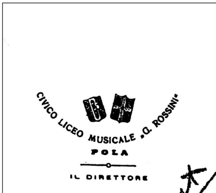
5. Fotografija pečata Glazbenog liceja Gioachino Rossini

Rad ustanove bio je međutim praćen mnogobrojnim problemima povezanim s formalno-pravnim statusom. Iako je škola radila prema nastavnom programu ministarstva školstva, nije bila izjednačena s državnim glazbenim institutima, pa joj je školski inspektorat osporavao pravo da izdaje diplome i svjedodžbe. Škola je rješavanje problema prepustila prefektu (gradonačelniku) a on je pak tražio mišljenje od nadležnog Ministarstva koje je dozvolilo da da privatna glazbena institucija izdaje diplome, koje međutim mogu vrijediti samo kao potvrda završenih glazbenih studija i nemaju značenje pravnoga akta, tj. nisu izjednačene s diplomama koje izdaju državni glazbeni instituti. Unatoč što škola nije imala službenu dozvolu za upotrebu imena "gradska", niti je bila financirana iz sredstava gradskog proračuna, općina se nije protivila uporabi imenu ni korištenju gradskog pečata. Nakon 1936. godine ni u dnevnome tisku ni u arhivskim vrelima nema podataka o njezinu djelovanju. 12