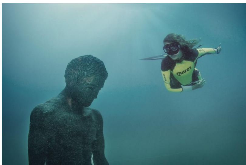
Slika 5. Skulptura Apoksiomena u Podvodnom arheološkom parku