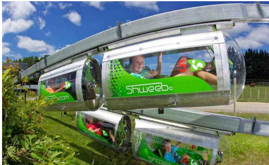
Slika 2. Schweeb Racer