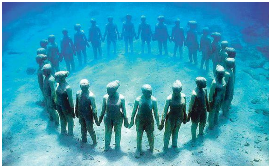
Slika 4. Skupina skulptura podvodnog muzeja u Kankunu