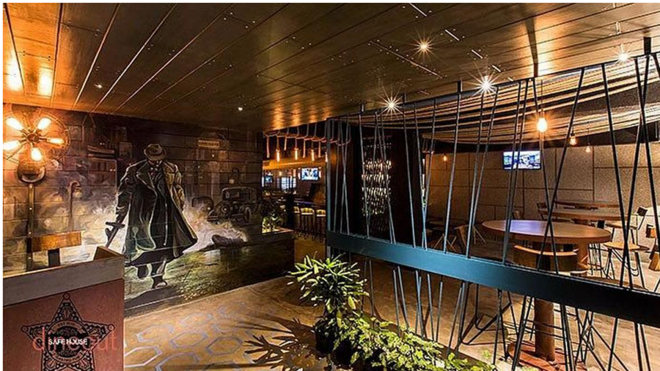
Slika 3. Restoran Safe House