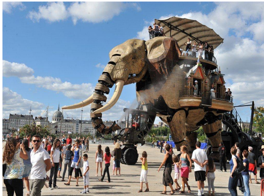
Slika 1. Mehanički slon u tematskom parku Les Machines de l'île