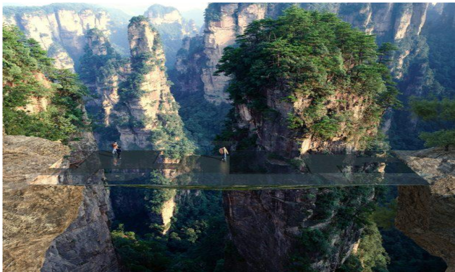
Slika 6. „Nevidljivi most“