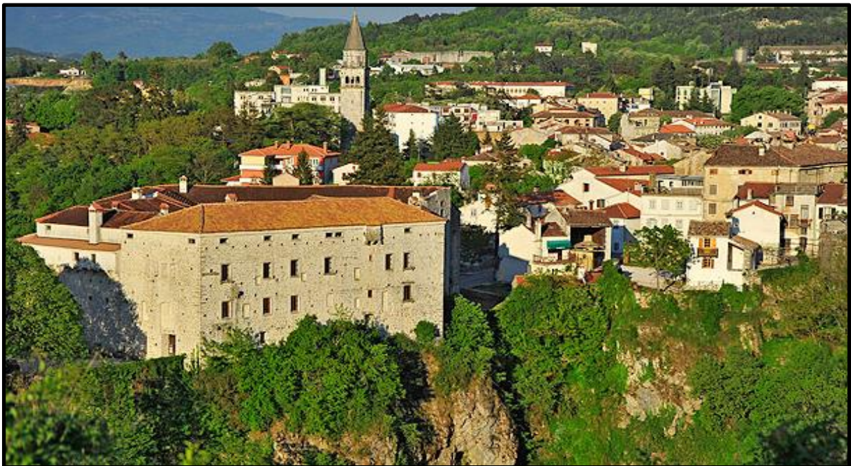
Slika 1. Današnji izgled grada Pazina