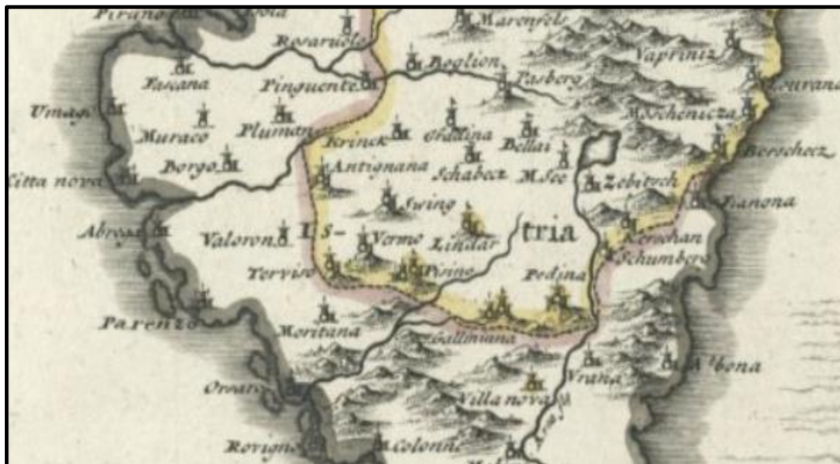
Slika 7. Karta Pazinske knežije