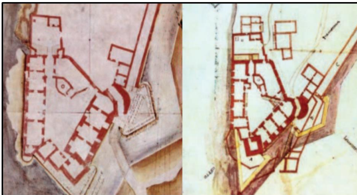
Slika 14. Prikaz utvrde na vojnim fortifikacijskim planovima