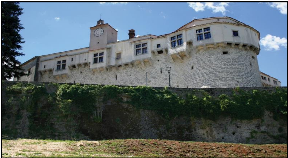
Slika 2. Pazinski kaštel