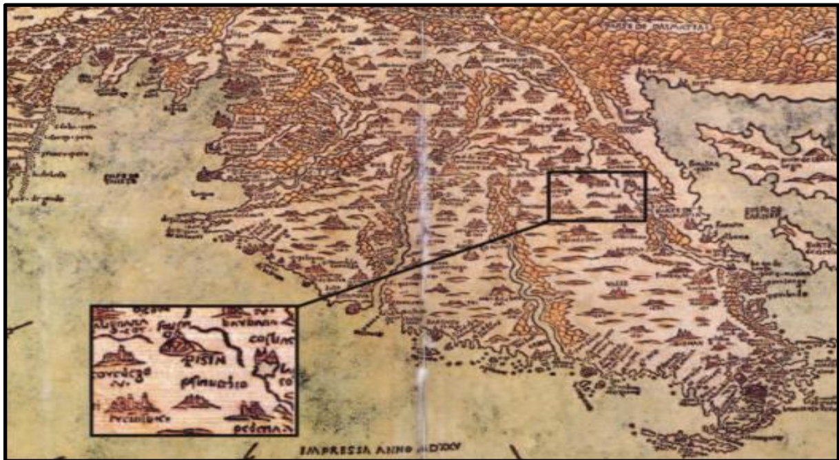
Slika 8. Karta Istre iz 1525.