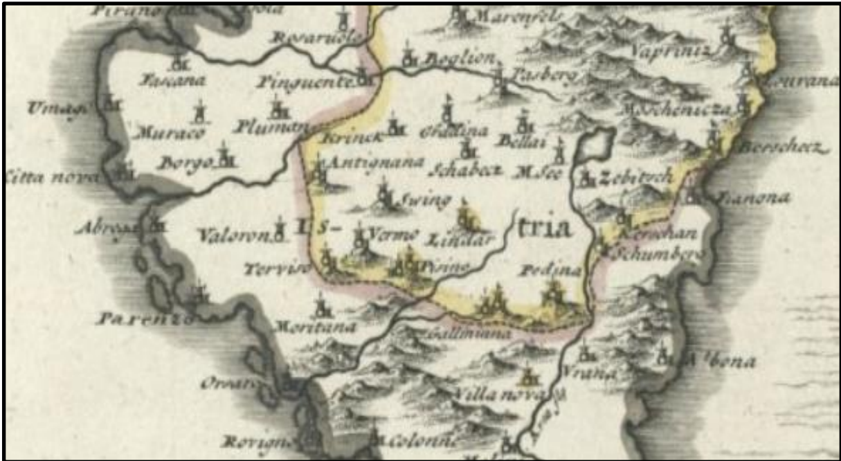
Slika 7. Karta Pazinske knežije