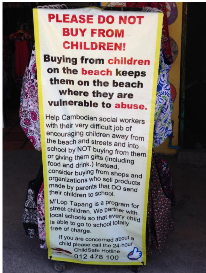
Slika 9. Obavijest o načinu zaštite djece na ulicama i plažama Kambodže