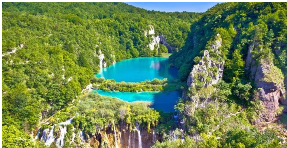
Slika 2. Jezero Novakovića Brod ( https://www.svesnizeno.hr/ , 28.7.2018.)

novi slapovi i kaskade. 16 Uz pomoć algi i mikroorganizama, taloženjem kristala kalcijevog karbonata iz vode, nastaju sedrene barijere. 17 Neki od brojnih slapova nastalih tim procesom su i Veliki slap, te slapovi Milke Trnine, imenovani po hrvatskoj opernoj pjevačici koja je, krajem 19. stoljeća, donirala novac tadašnjem Društvu za uređivanje i poljepšanje Plitvičkih jezera. 18