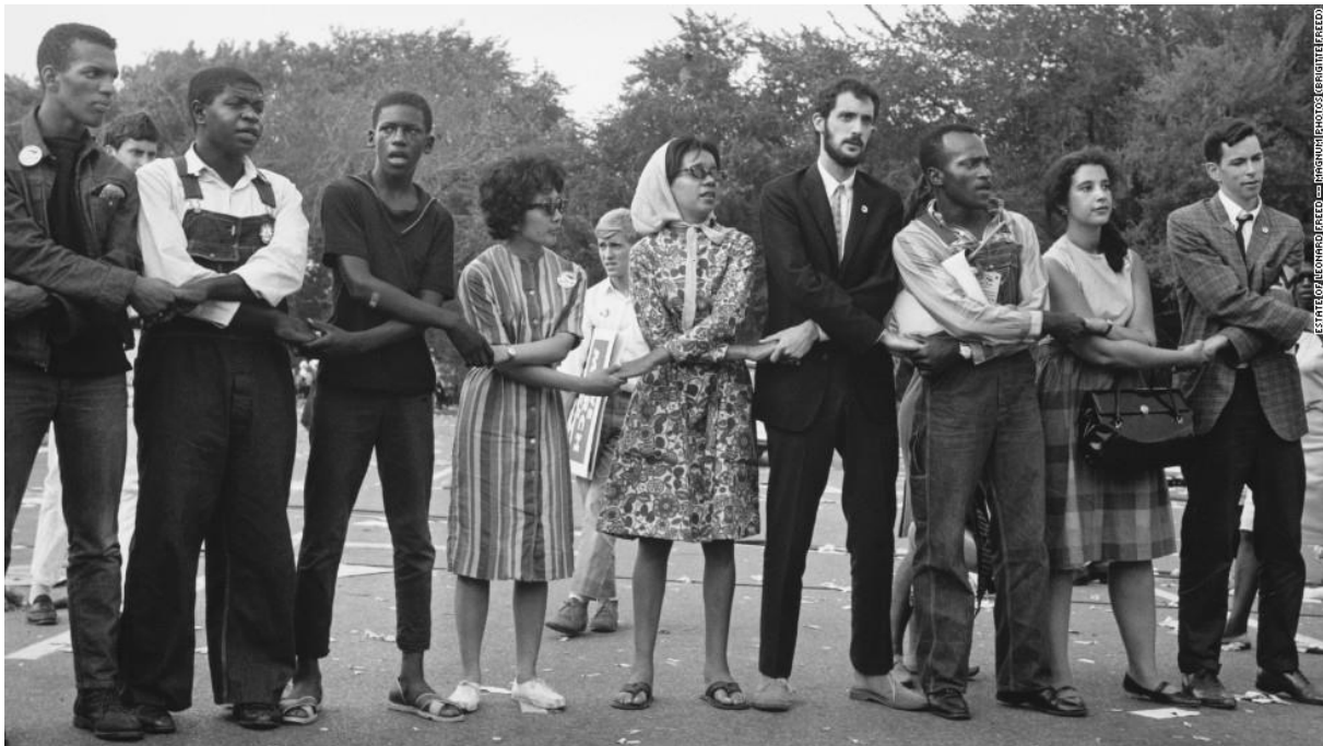
Slika 3. Pokret za građanska prava 1964.godine

Razlike u načinu života ne postoje samo u različitim vremenima i prostorima, nego i unutar istog društva. Današnje države imaju regionalne posebnosti zasnovane na gospodarstvu i različitim životnim uvjetima. Čak i unutar istog grada postoje razlike u načinu života određenih zajednica. To ne vrijedi samo za doseljenike, nego i za razlike među spolovima, seksualne navike, te etničke, dobne i klasne skupine. Antropologija bilježi sve te razlike, ali traži dokaze i o temeljnom jedinstvu svih ljudi (Moore, 2013:42).