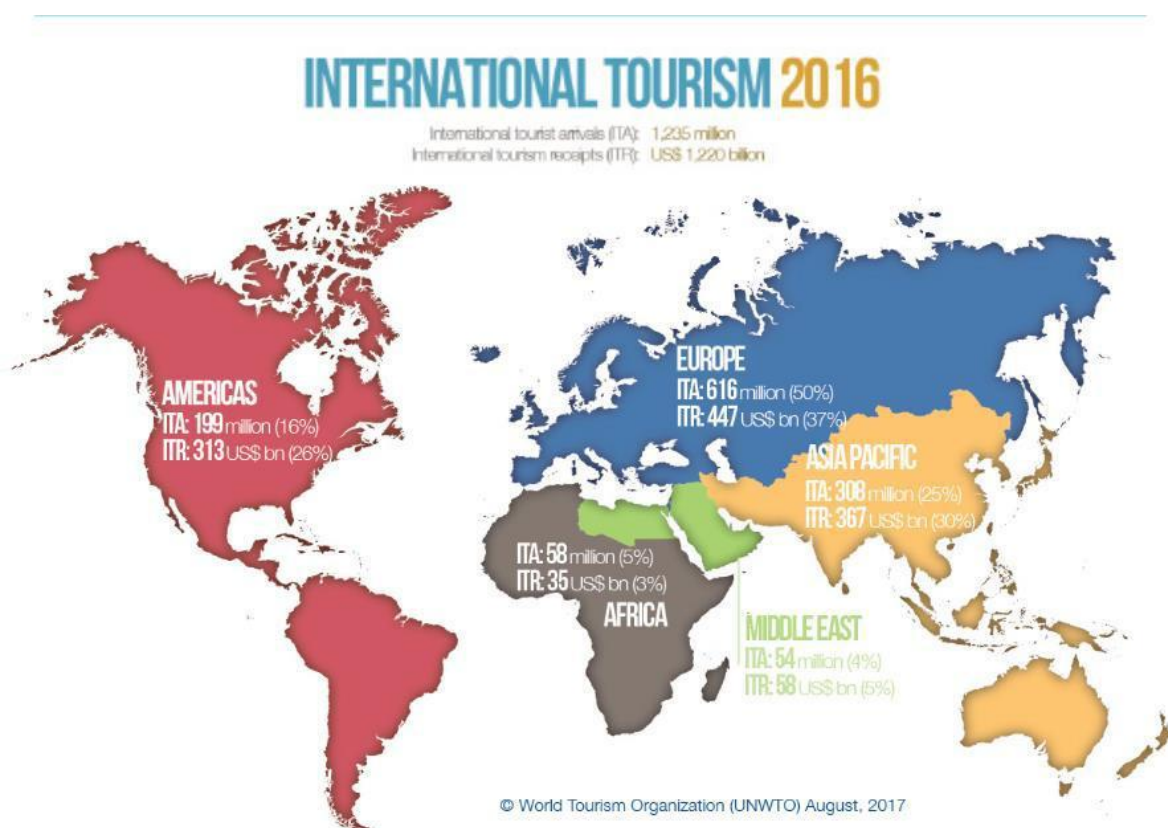
Slika 6. Internacionalni turizam u svijetu 2016.godine