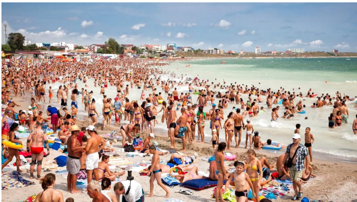
Slika 4. Masovni turizam