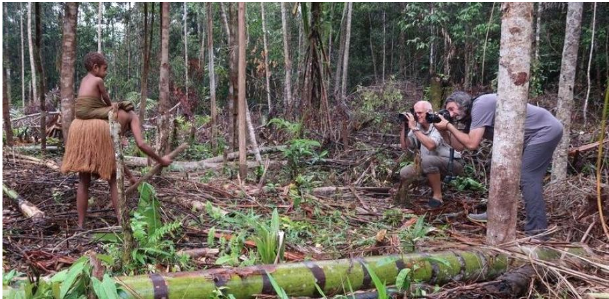
Slika 5. Turisti fotografiraju lokalno stanovništvo