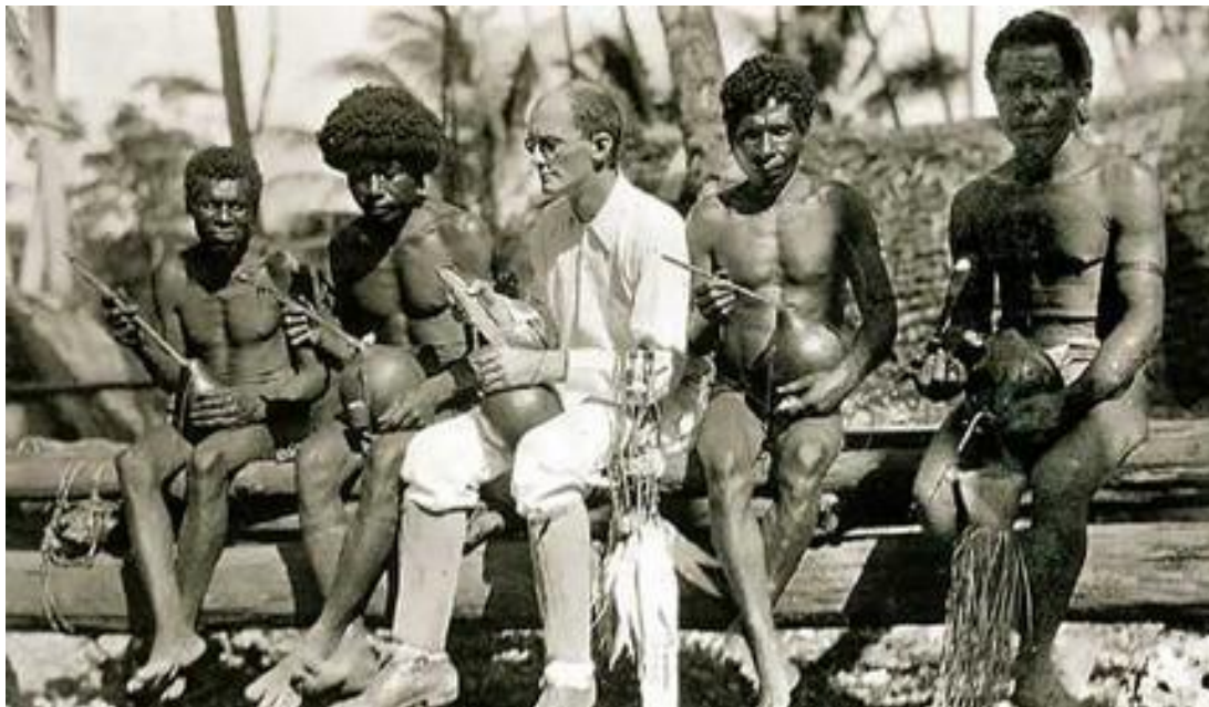
Slika 1.: Malinowski na Trobrijandskom otočju sa domorodcima Izvor: https://savageminds.org/tag/bronislaw-malinowski/ , (20.07.2018.)