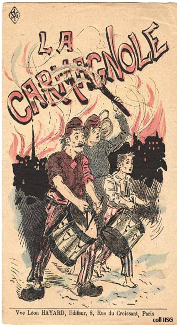
Slika br.7 Plakat povodom Francuskog nacionalnog festivala