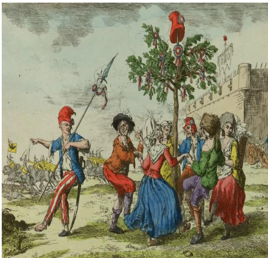
Slika br.6 Prikaz plesa na pjesmu La Carmagnole