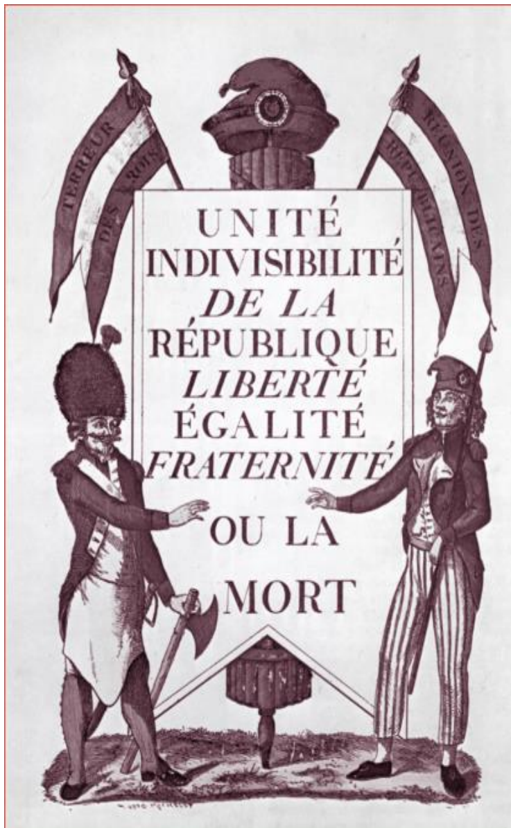
Slika br.1 Letak Maximiliana Robespierrea