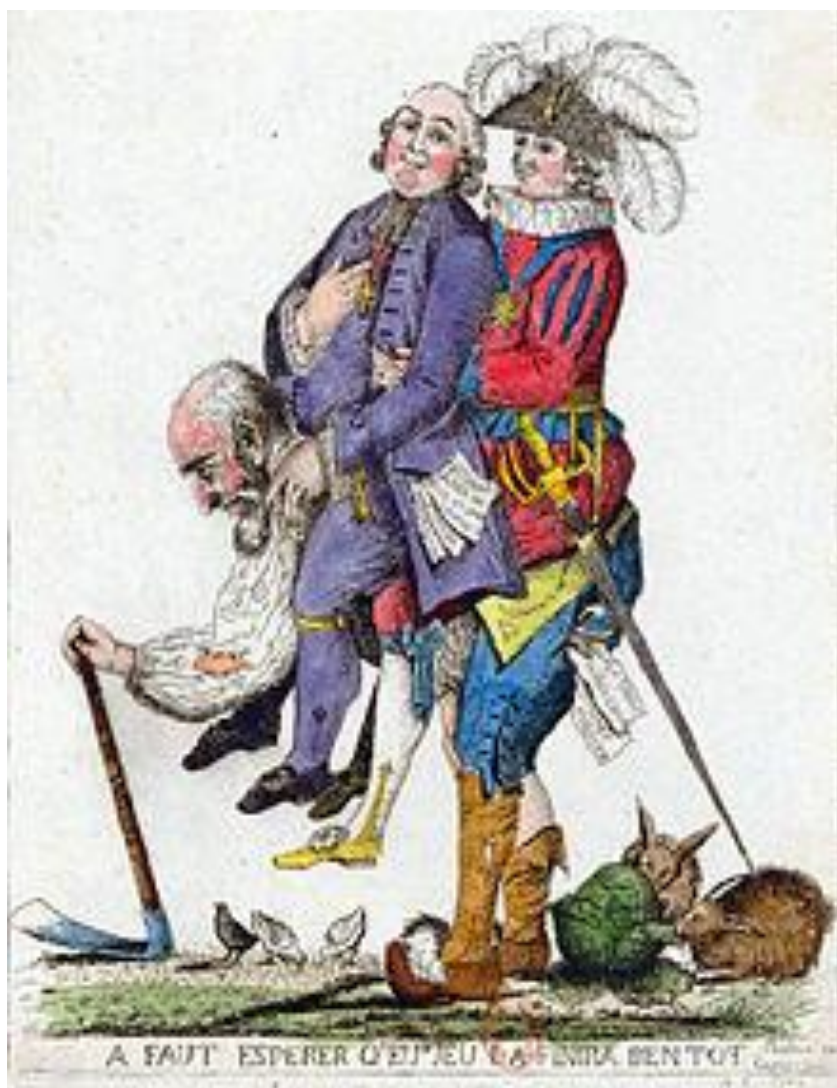
Slika br.3 Primjer satirične karikature potlačenog Trećeg staleža