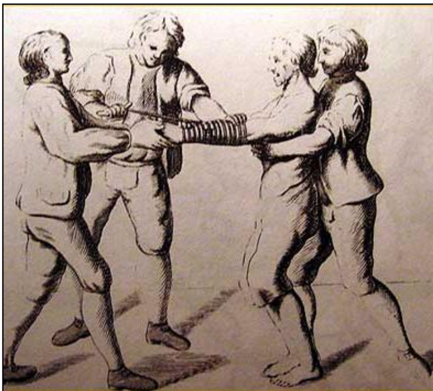
Prilog 5. Prije torture – vezivanje ruku uzicama ispletenim iz konjskoga repa (izvor: Heinrich Institoris, Jacob Sprenger, Malleus maleficarum = Malj koji ubija vještice , Stari grad, Zagreb, 2006., str. 525.)

(izvor: Vladimir, Bayer, Ugovor s đavlom: procesi protiv čarobnjaka u Evropi a napose u Hrvatskoj , Zora, Zagreb, 1953., str. 257.)