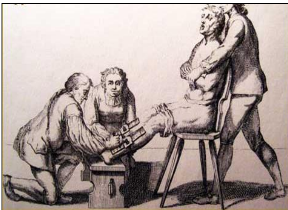
Prilog 2. i 3. Izgled i prikaz upotrebe „španjolske čizme“ (izvor: Vladimir, Bayer, Ugovor s đavlom: procesi protiv čarobnjaka u Evropi a napose u Hrvatskoj , Zora, Zagreb, 1953., str. 258.) Heinrich Institoris, Jacob Sprenger, Malleus maleficarum = Malj koji ubija vještice , Stari grad, Zagreb, 2006., str. 527.)