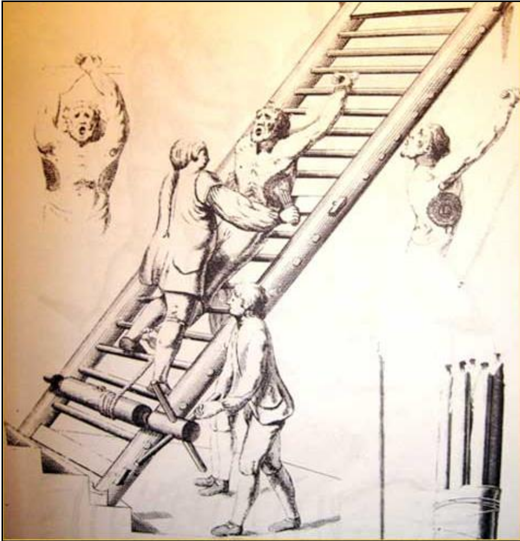
Prilog 1. Sprava za mučenje – „ljestve“ ili „lojtre“ (izvor: Heinrich Institoris, Jacob Sprenger, Malleus maleficarum = Malj koji ubija vještice , Stari grad, Zagreb, 2006., str. 526.)