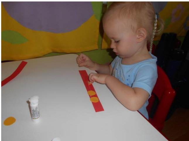
Slika br. 22 – Djevojčica izrađuje ogrlicu s dukatima

Druga skupina je pomoću kolaž papira i ljepila izrađivala dukate . Odgojiteljice su djeci izrezale trakice na koje lijepe krugove koji predstavljaju dukate . Na taj način su izradile nakit za mlade slavonske djevojke.