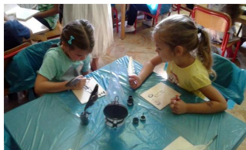
Slika br. 5 – Pisanje guščjim perom