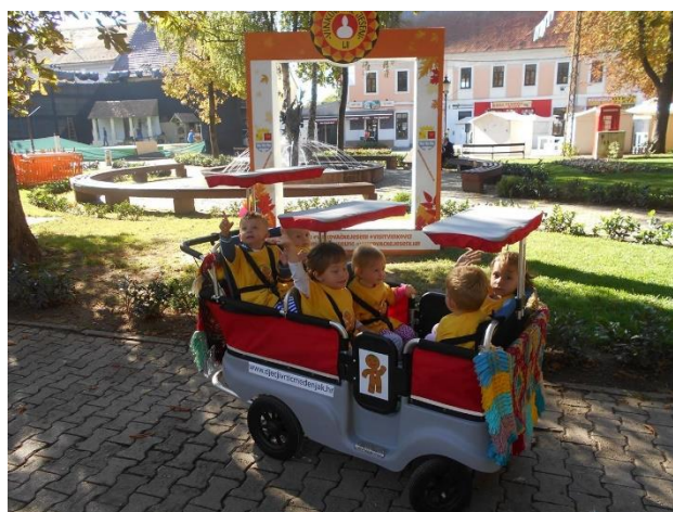
Slika br. 17 – Najmlađa skupina, Majstori u svojim svečano ukrašenim kolima