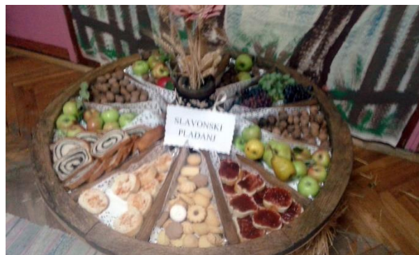
Slika br. 7 – Priređivanje doručka kao nekada