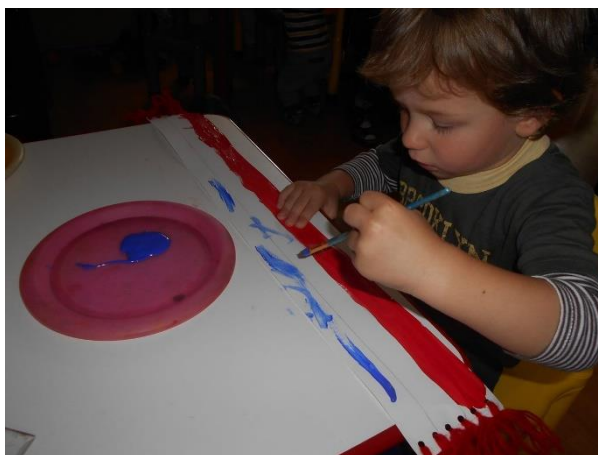
Slika br. 20 – Dijete oslikava peškir pomoću kista i tempera

Najmlađa skupina, Majstori , imala je pune ruke posla. Odgojiteljice su djecu podijelile u tri skupine. Svaka skupina je imala svoj likovni zadatak. Prva skupina oslikavala je peškire . Odgojiteljice su od papira izrezale oblik, a djeca su mogla birati likovnu tehniku. Neka su koristila kistove i tempere, dok je nekolicina koristila olovke u boji i bušilicu za papir s raznim oblicima.