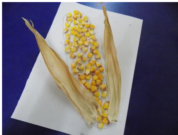
Slika br. 19 – Gotov rad djeteta iz odgojne skupine Genijalci