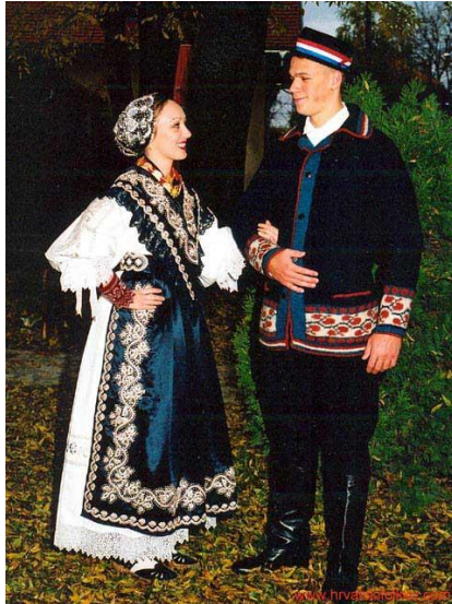
Slika 1. Slavonska narodna nošnja