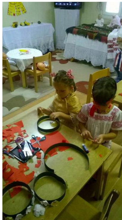
Slika br. 15 – Djeca izrađuju vjenčiće od kolaž papira i ljepila