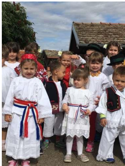
Slika br. 11 – Djeca na modnoj reviji dječjih narodnih nošnji