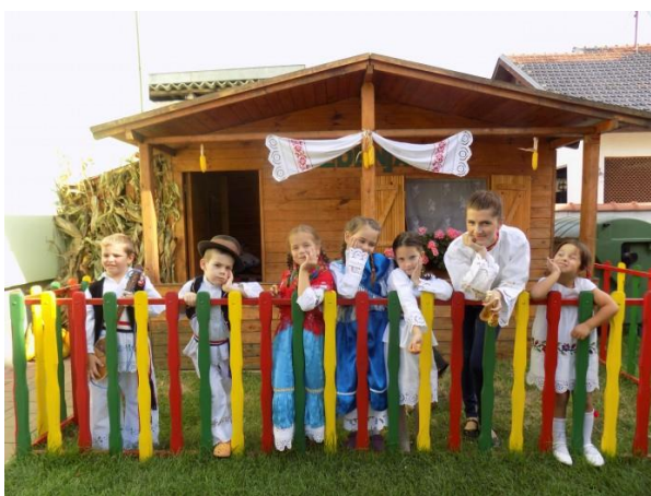
Slika br. 16 – Djeca vrtića Medenjak ispred Kućice Šokice

Posebno, za najmlađu skupinu, Majstori , odgojiteljice su njihov Bebemobil, u kojemu voze djecu u šetnju, ukrasila kao svečana slavonska kola. Bebemobil, ukrasile su peškirima i slavonskim narodnim tkanim tepisima. Po završetku uređivanja, odgojiteljice su posjele djecu u njihova uređena kola te su ih odvele u šetnju kako bi svima mogli pokazati svoj rad.