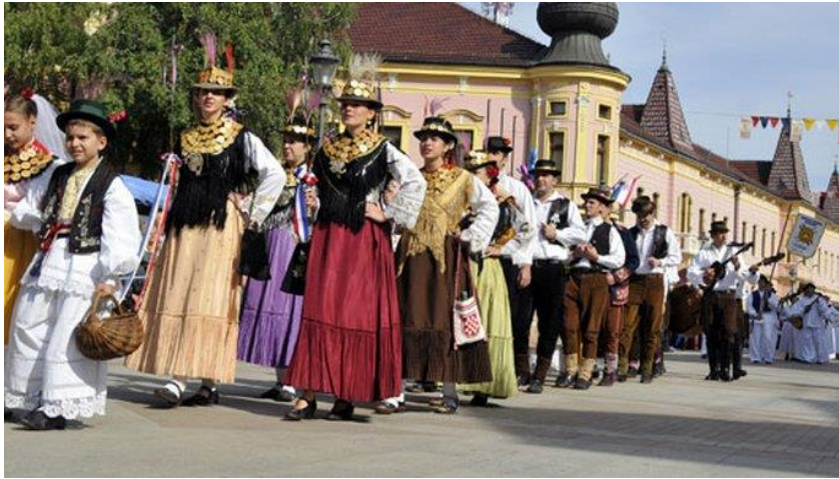
Slika 3. Svečani mimohod