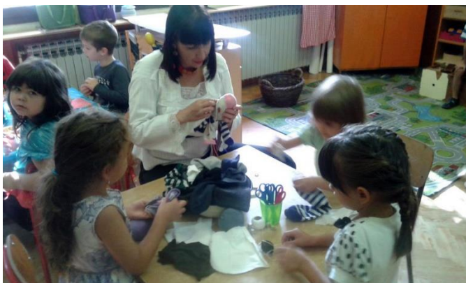
Slika br. 6 – Izrada krpenih lutki