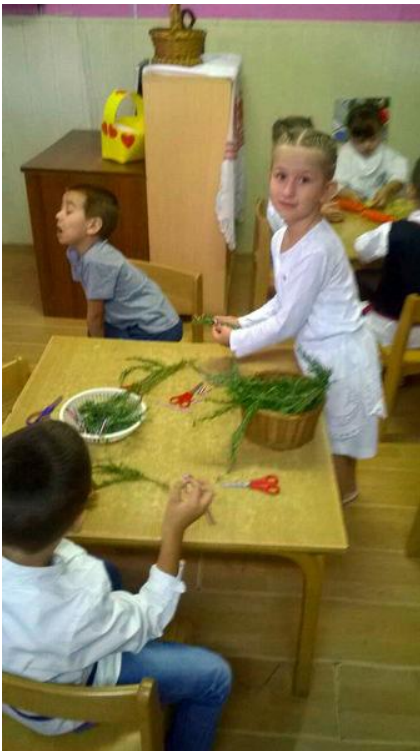
Slika br. 14 – Djeca izrađuju vjenčiće od ružmarina