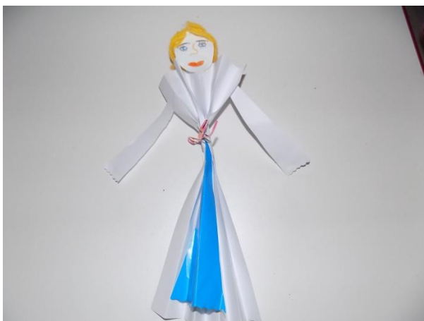
Slika br. 26 – Djetetov likovni uradak šokice

Najstarija odgojna skupina, Genijalci , dobila su malo teži zadatak. Pomoću kolaž papira, ljepila i škara morali su napraviti šokicu . Prvo su izrezali kolaž papir, zatim su ga morali zgužvati i zavezati mašnom kako bi dobili trodimenzionalni oblik haljine te su isti lijepili na papir. Nakon toga su dodavali glavu i ruke, a na glavi su flomasterima nacrtali oči, nos, usta i kosu. Na taj način djeca su vježbala finu motoriku ruke i prstiju te upornost i strpljivost u izradi samog zadatka