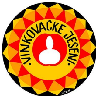
Slika 2. Grb Vinkovačkih jeseni

„To je smotra koja teži trajnoj afirmaciji izvornoga kulturno - umjetničkoga narodnoga stvaralaštva temeljenog na bogatoj baštini naroda vinkovačkoga kraja i cijele Hrvatske.“ (Službena stranica Vinkovačkih jeseni , 2018.).