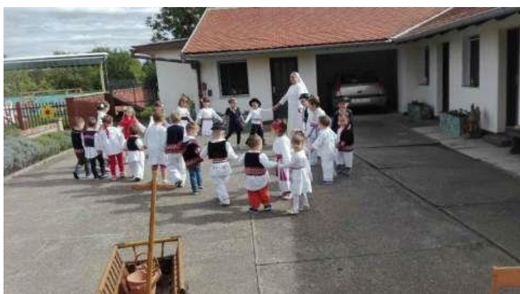
Slika br. 8 – Učenje plesanja slavonskog kola

Dječji vrtić Cvjetnjak je katolički vrtić u kojemu su osnivači i odgojiteljice časne sestre iz Družbe Sestara Služavki Malog Isusa – Provincija Presvetog Srca Isusova i Marijina. Prošle godine, 2017., zajedno s djecom organizirale su modnu reviju narodnih nošnji pod nazivom: Jeseni su, milo janje moje, barem da su u godini troje! . Djeca su obukla dječje narodne nošnje, neke stare i više od 120 godina. Modna revija se odvijala uz zvuke tamburice i veselog dječjeg pjevanja. Djeca su se igrala igara koje su igrali njihovi predci, ali i učili plesati slavonsko kolo. Na taj način, djeca su došla u doticaj s raznim tradicionalnim predmetima, ali i jesenskim plodovima.