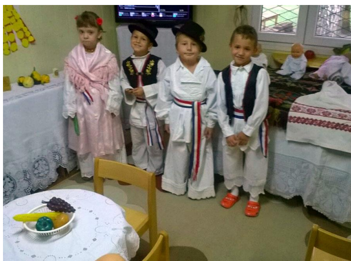
Slika br. 13 – Djeca u narodnoj nošnji