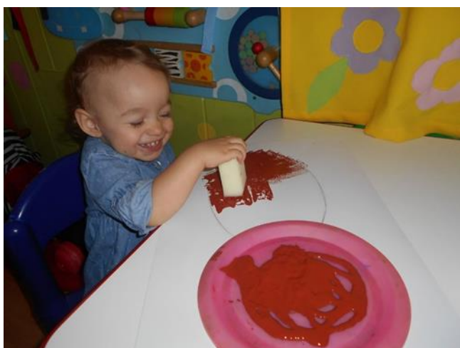
Slika br. 24 – Dijete oslikava tamburicu

Treća skupina, imala je zadatak pomoću tempera naslikati narodno, slavonsko glazbalo, tamburicu. Odgojiteljice su kao i u prethodna dva zadatka, nacrtale oblik, a djeca su uz njihovu pomoć oslikala tamburicu sa spužvom i smeđom temperom. Spužvu su umakali u temperu te su na taj način nanosili boju na papir. Kada se boja osušila, izrezan je oblik tamburice te su crnim flomasterom nacrtane žice.