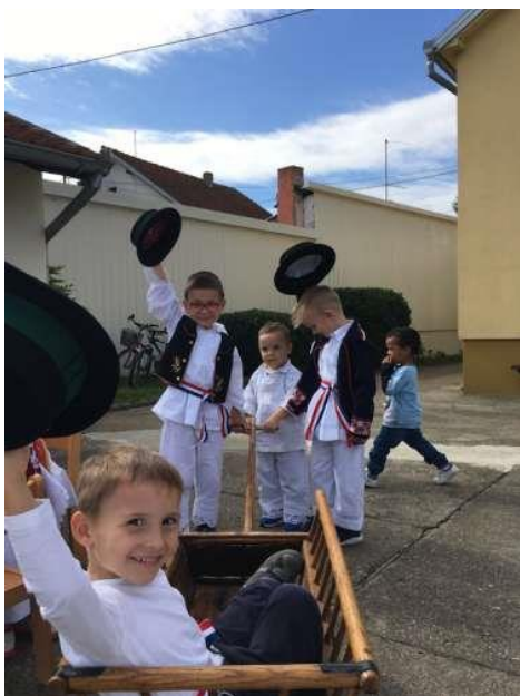
Slika br. 9 – Djeca se voze u slavonskim kolima