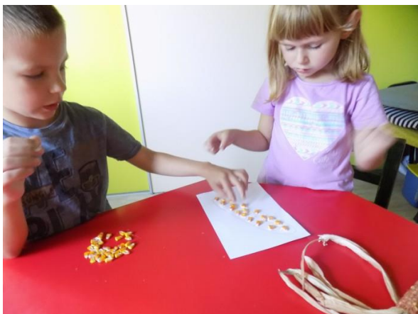
Slika br. 18 – Djeca odgojne skupine Genijalci , lijepe zrna kukuruza na papir

Najstarija skupina, Genijalci , imala je najzahtjevniji zadatak. Svako dijete dobilo je klip kukuruza iz kojega su morali iščupati zrna. Prvo su ih dobro promotrili, te su ih zalijepili na papir, na sami predložak. Po završetku lijepljenja zrna, otrgnuli su i šušku te je lijepili pored zrna, kako bi njihov kukuruz dobio pravi oblik. Ovim zadatkom djeca su vježbala snagu ruku te finu motoriku prstiju koja će im biti potrebna kod pisanja olovkom u školi.