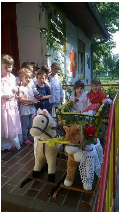
Slika br. 12 – Svečana zaprega na ulazu u vrtić

U sklopu akcije Volim Vinkovce , Dječji vrtić Lenije , osvojio je 1.mjesto u kategoriji odgojno-obrazovnih ustanova.