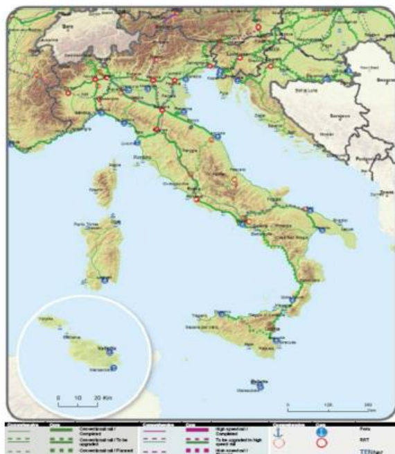
Slika 4. Osnovna i sveobuhvatna: željeznice (teret)

Kartografski prikazi u Strategiji informativne su prirode i služe isključivo za potrebe ovog dokumenta.