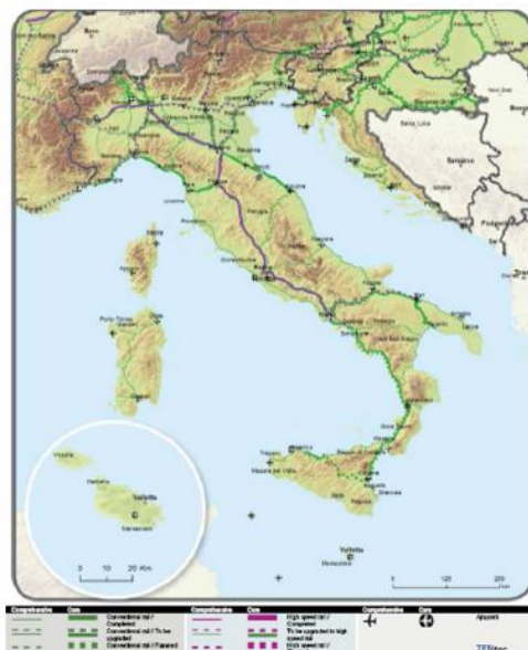
Slika 3. Osnovna i sveobuhvatna mreža: željeznice (putnici)