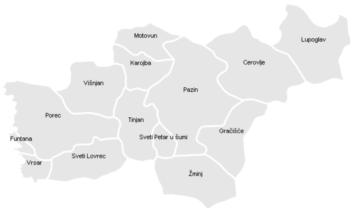
Slika 4.: Prikaz Lag-a Središnja Istra