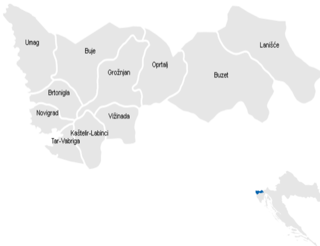
Slika 3.: Prikaz LAG-a Sjeverna Istra