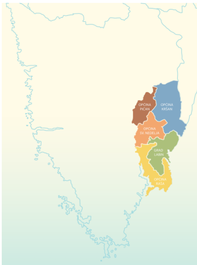
Slika 5.: Prikaz LAG-a Istočna Istra