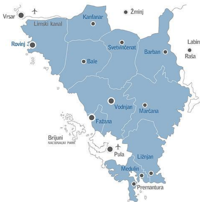
Slika 6.: Prikaz LAG- a Južna Istra